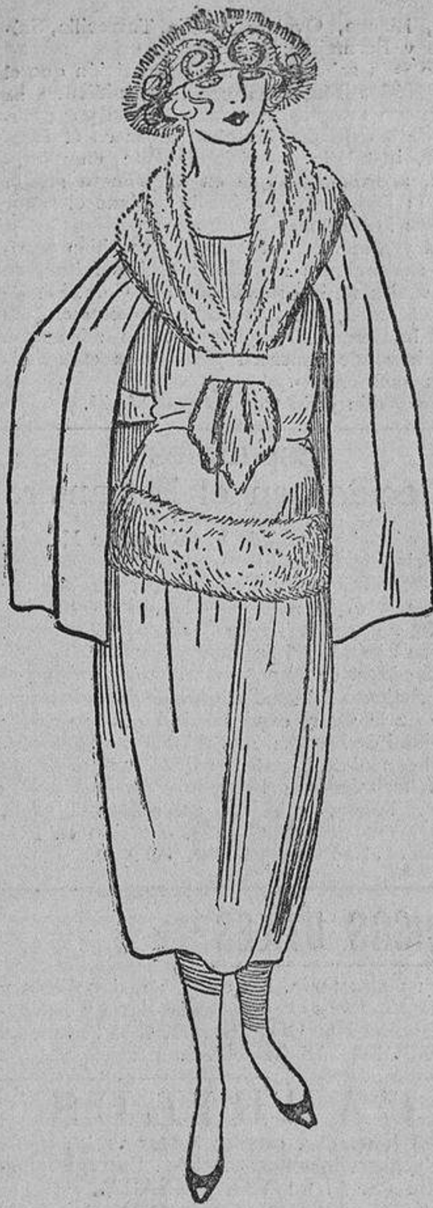
En punto de lana color mostaza y lana escarlada del mismo tono.

Los demás muebles del comedor son bajos y largos como se usan ahora. En el hueco del balcón un gran «stor» de tul bordado color crudo como las paredes, y sobre ellas unos grabados de Puvís de Chavannes.