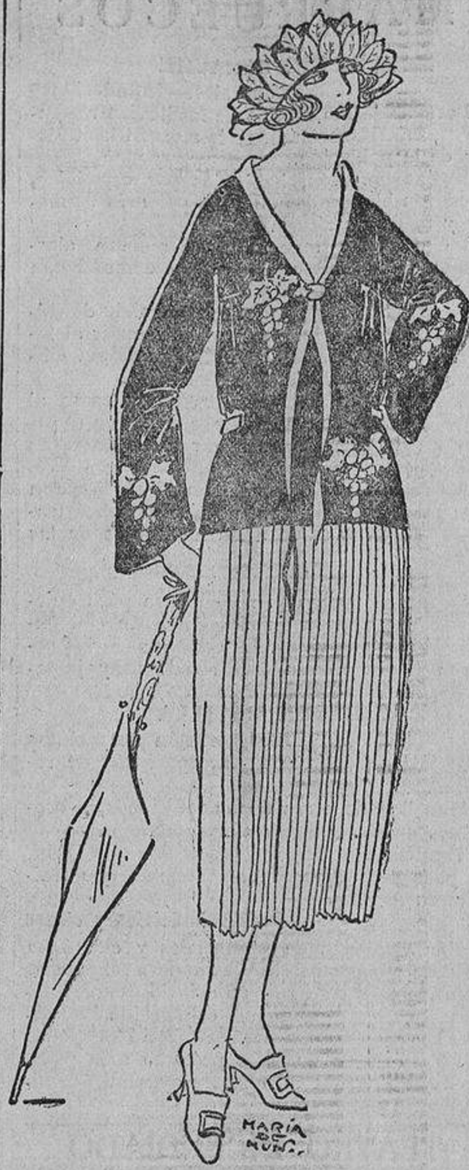
Sobre una falda, con delantero plisado, fresa, una blusa azul marino, sobre la cual hay, bordadas en fresa, unas uvas.