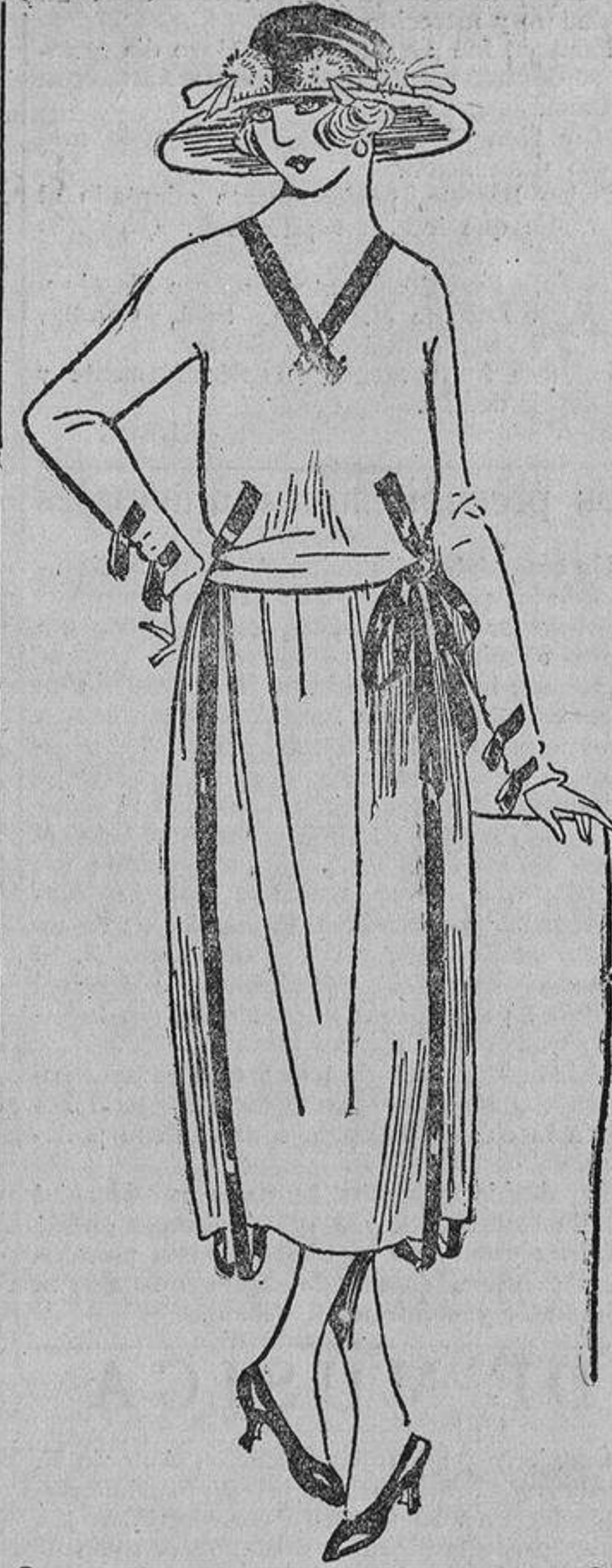
De paño flexible verde oscuro con cintas encerradas colocadas con originalidad.

Por la doble puerta abierta se ve el gabinete, que sirve a la vez de dormitorio y saloncito de recibo, porque, como he dicho, esta casa es un cascarón de nuez. En vez de una cama vulgar tiene un diván o cama turca que le sirve de diván, cubierta de una tela original, y profusión de almohadones de distintos estilos y colores sabiamente armonizados. Al lado una mesita baja con las últimas revistas o novelitas y una pantalla que ilumina discretamente este rincón.