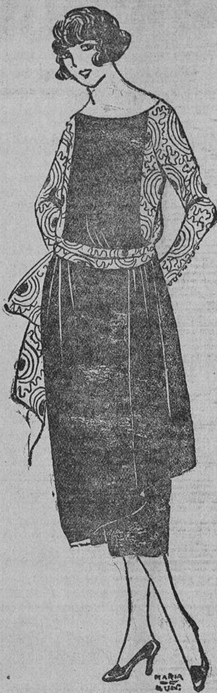
Raso negro de caída flexible, combinado con un «doulard» estampado en negro y verde.