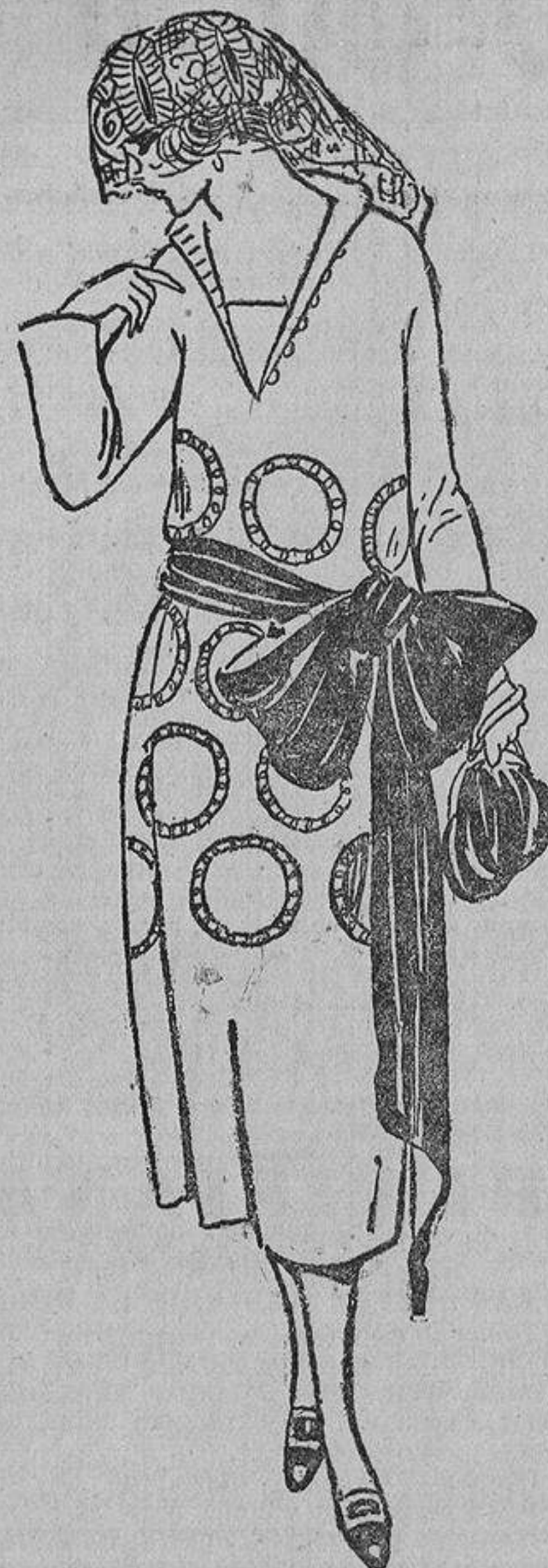
Gabardina azul marino adornado con círculos cortados y unidos por abalorios de madera en color verde; banda del mismo color.

desaparición de los diligentes ayudas de cámara a poner las manos en la masa.