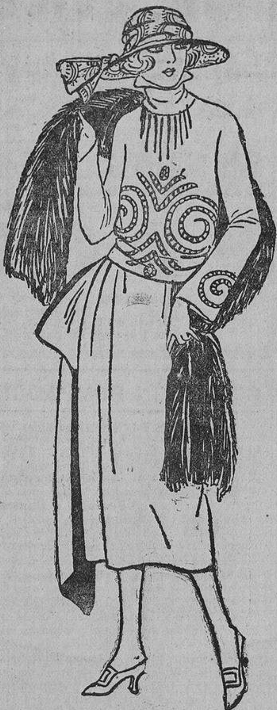
De «charmeuse» negra o gabardina azul marino con bordados o abalorios azul «nattier» y banda forrada del mismo tono.

Para el paseo matinal: zapato de piel de ternera marrón muy oscuro o negro, suelas espesas. Estos zapatos se lustran con tanta insistencia que deben parecer charol. Un «dandy» no vacila desde la