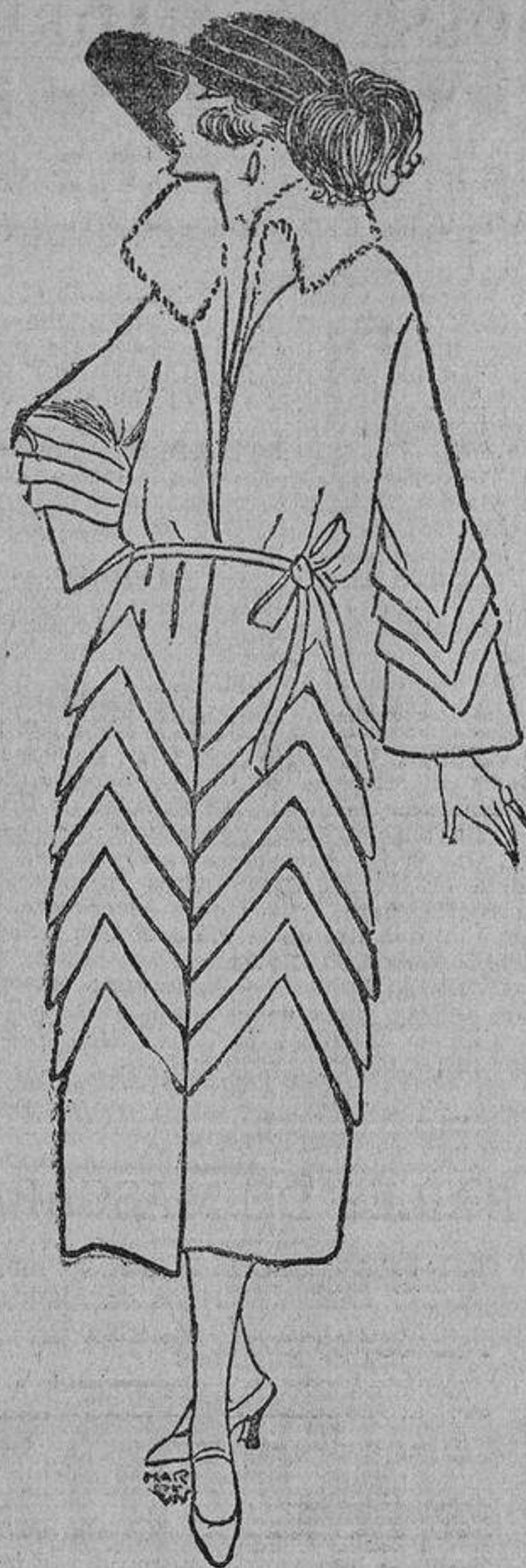
Elegante abrigo, de paño Suecia, adornado con biesses de su misma tela.