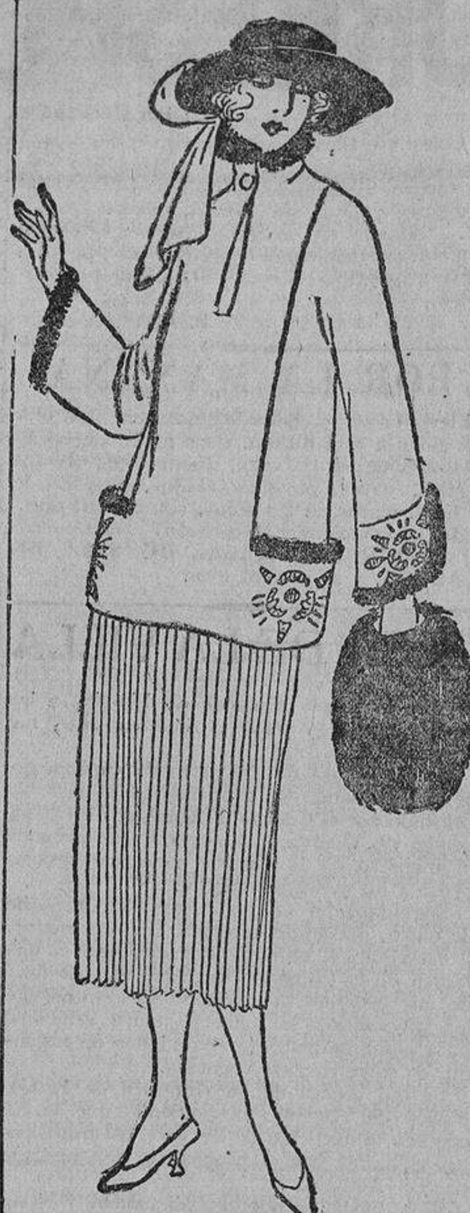
Rojo oscuro, piel negra y bordados idem. La falda plisada solamente delante, de lado a lado.

Muchas señoras no son amigas de estas fotografías para sus retratos; les gusta más verse la cara bien blanca, sin una sombra, como en los retratos corrientes; es un prejuicio sin fundamento creer que están más guapas; esos retratos vulgares les dan una belleza de cromó, de «bom-bón»; pero les resta personalidad, «carácter».