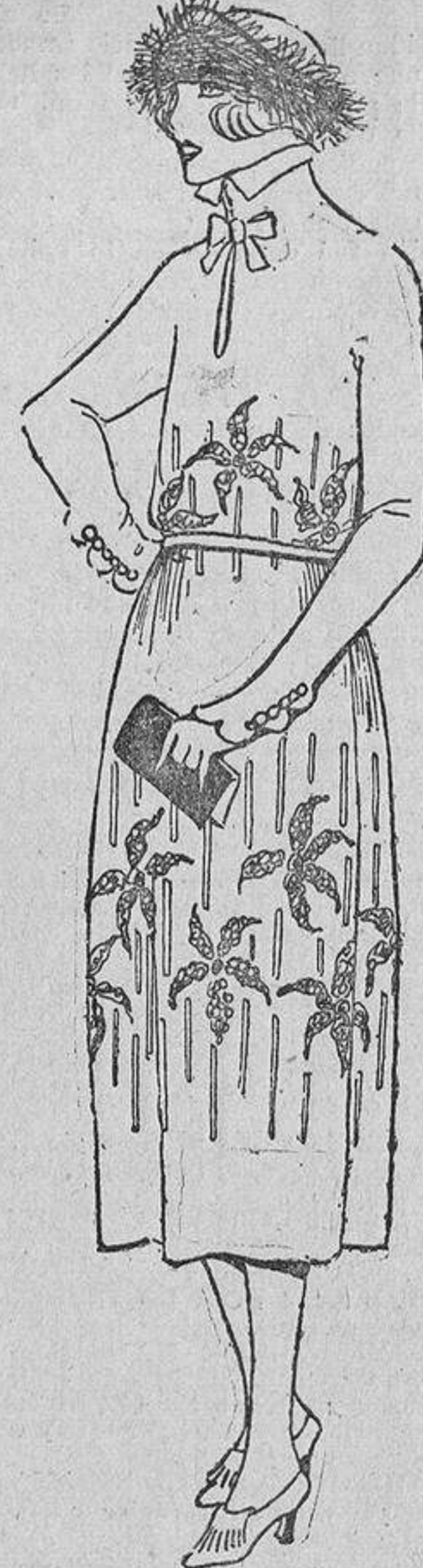
¡Qué bonita idea para un bordado!, sea en lanas, cuentas, azabaches o espumilla.