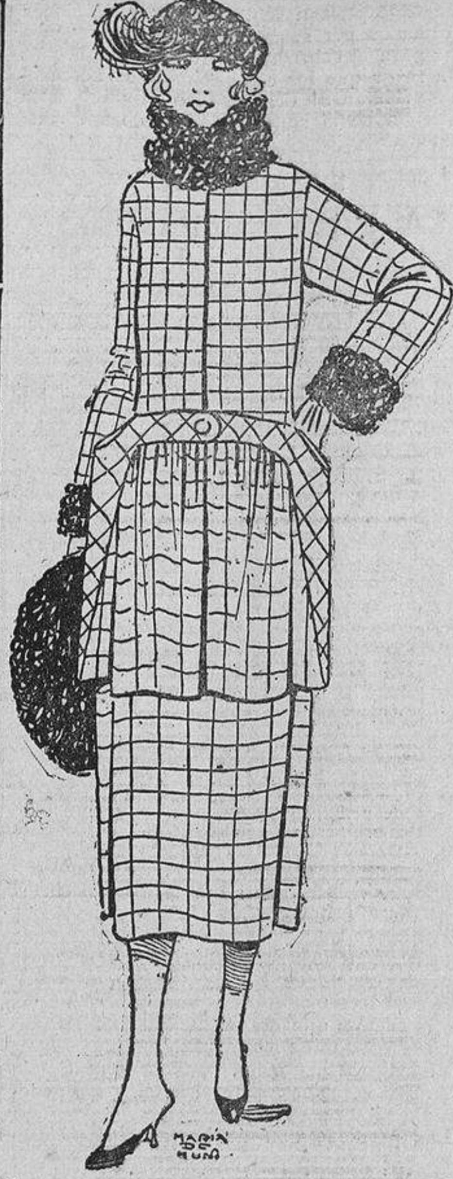
Eligiendo lo mismo un tejido claro, a cuadros, como oscuro, a listas claras, siempre resultará original este traje sastre.