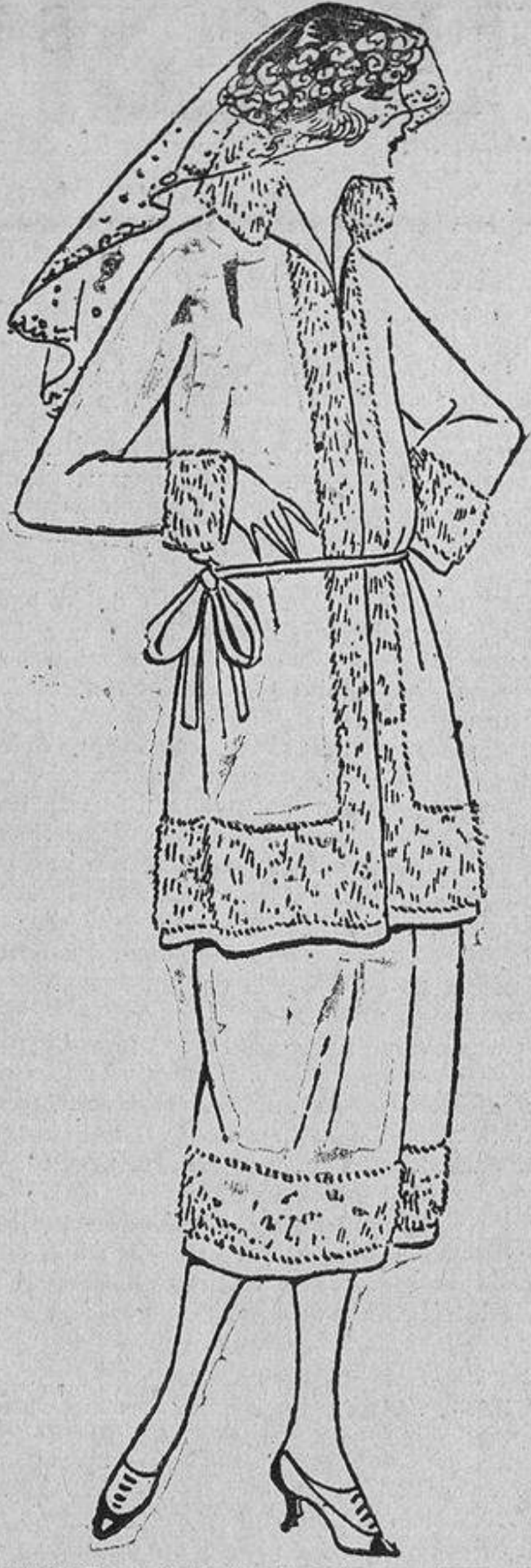
Un traje de punto de lana puede adornarse, en vez de piel, con tiras de lana escardada del mismo tono que el traje.

Segunda. Dejemos a un lado el estado de salud reinante en la familia. Digamos brevemente si nos hallamos bien o mal; pocas palabras son suficientes. No hay nada tan triste como los relatos interminables sobre el estado sanitario de una familia numerosa.