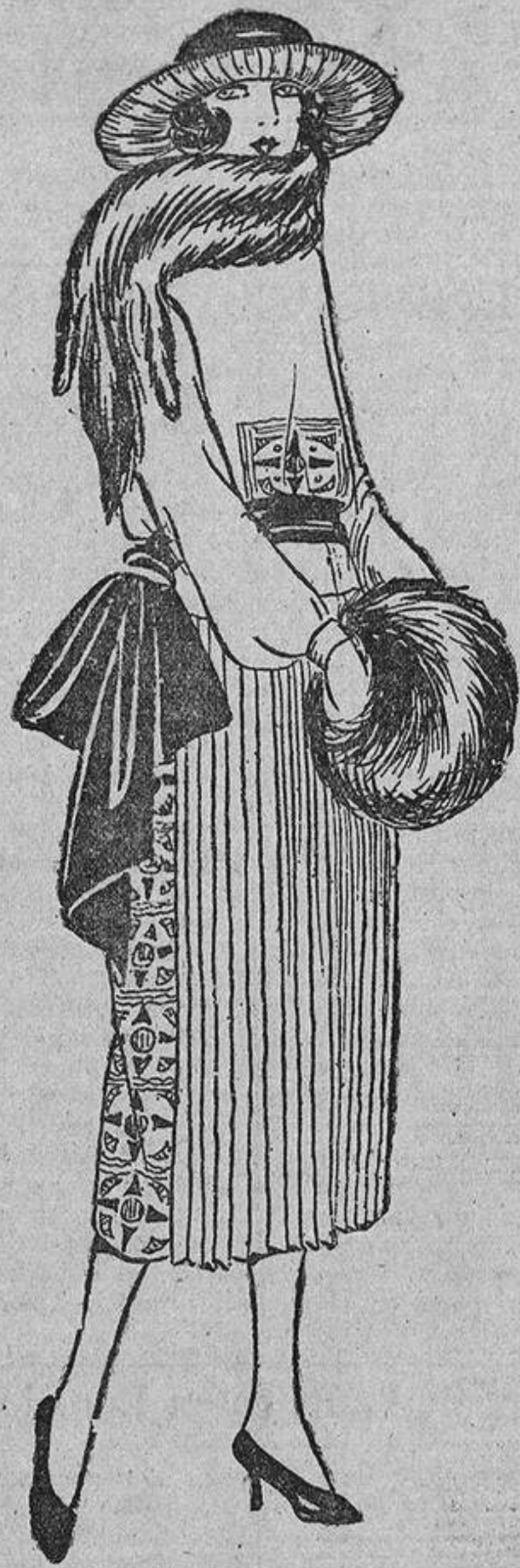
Hay que llevar los colores de moda: el «cobre», por ejemplo, bordado en negro, en una franja que desciende a los lados, como en este modelo, con delantero plisado.