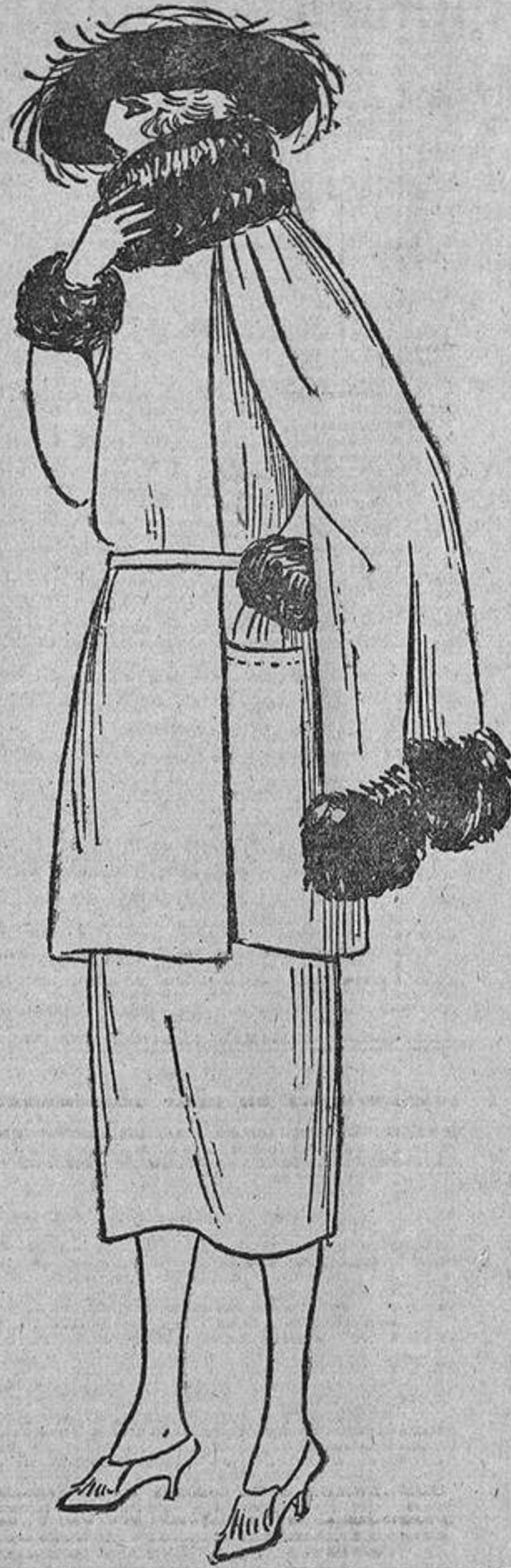
Hay que llevar también una capa cortita sobre un vestido entero, o como en este caso, sobre una confortable chaqueta.