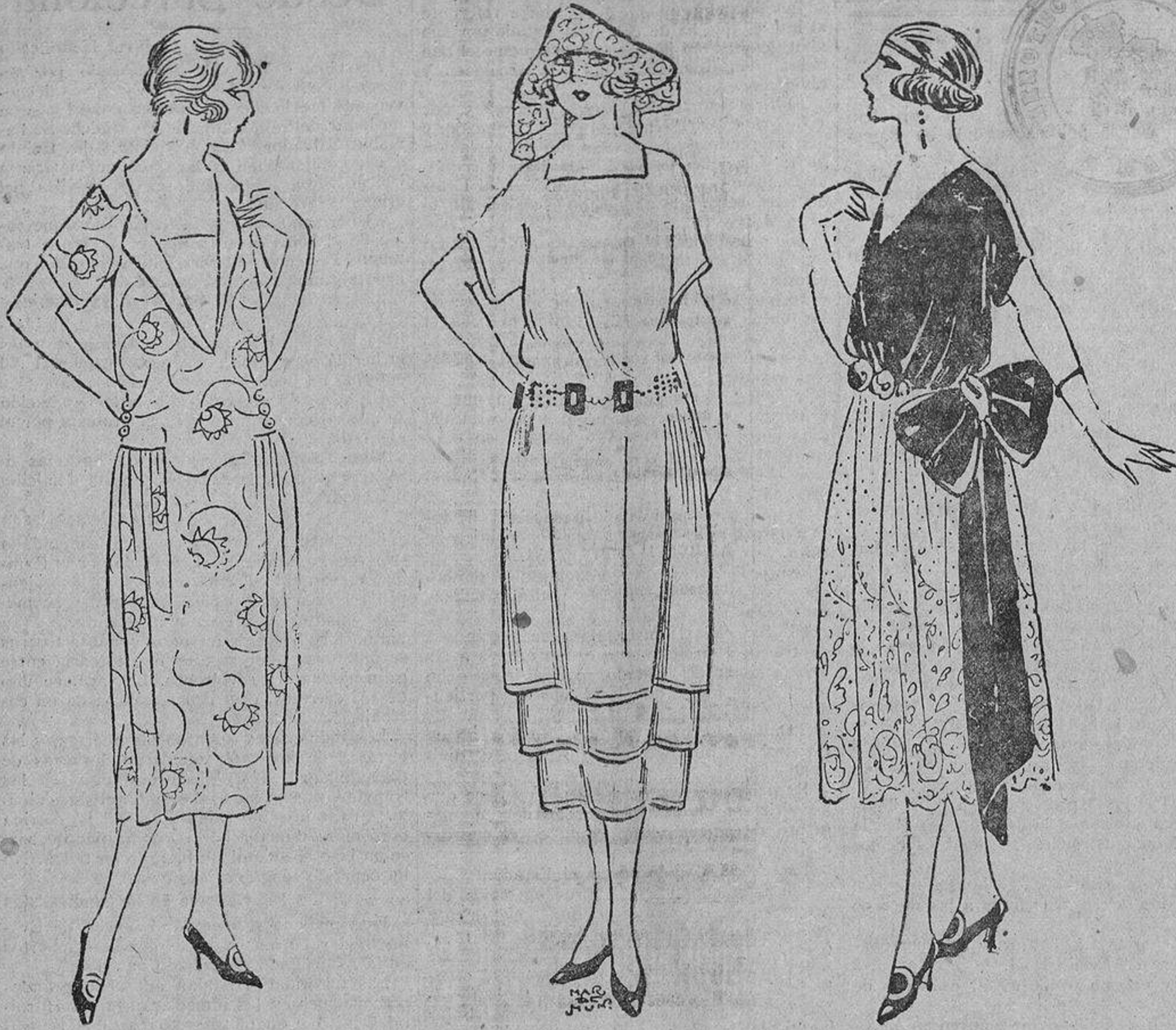
Sencillo y elegante este modelo de flexible brocado marrón, con pechero y solapas de seda salmón muy pálido. También resultará lindo en azul marino.

Se celebra un matrimonio; él es un ricachón, y ella de modesta familia. Todo el mundo, «todo», hombres y mujeres, comentan con entusiasmo y cariño aquella unión, augurándole una eterna felicidad. Este sentimiento unánime responde a que por parte de él, desde luego, se supone un matrimonio por amor (todavía tiene influencia sobre las almas el sentimentalismo). No se piensa que la novia pueda unirse sólo por el interés, sin amor, y si por alguna mente cruza esta idea, no se le da gran importancia, ni se teme que por