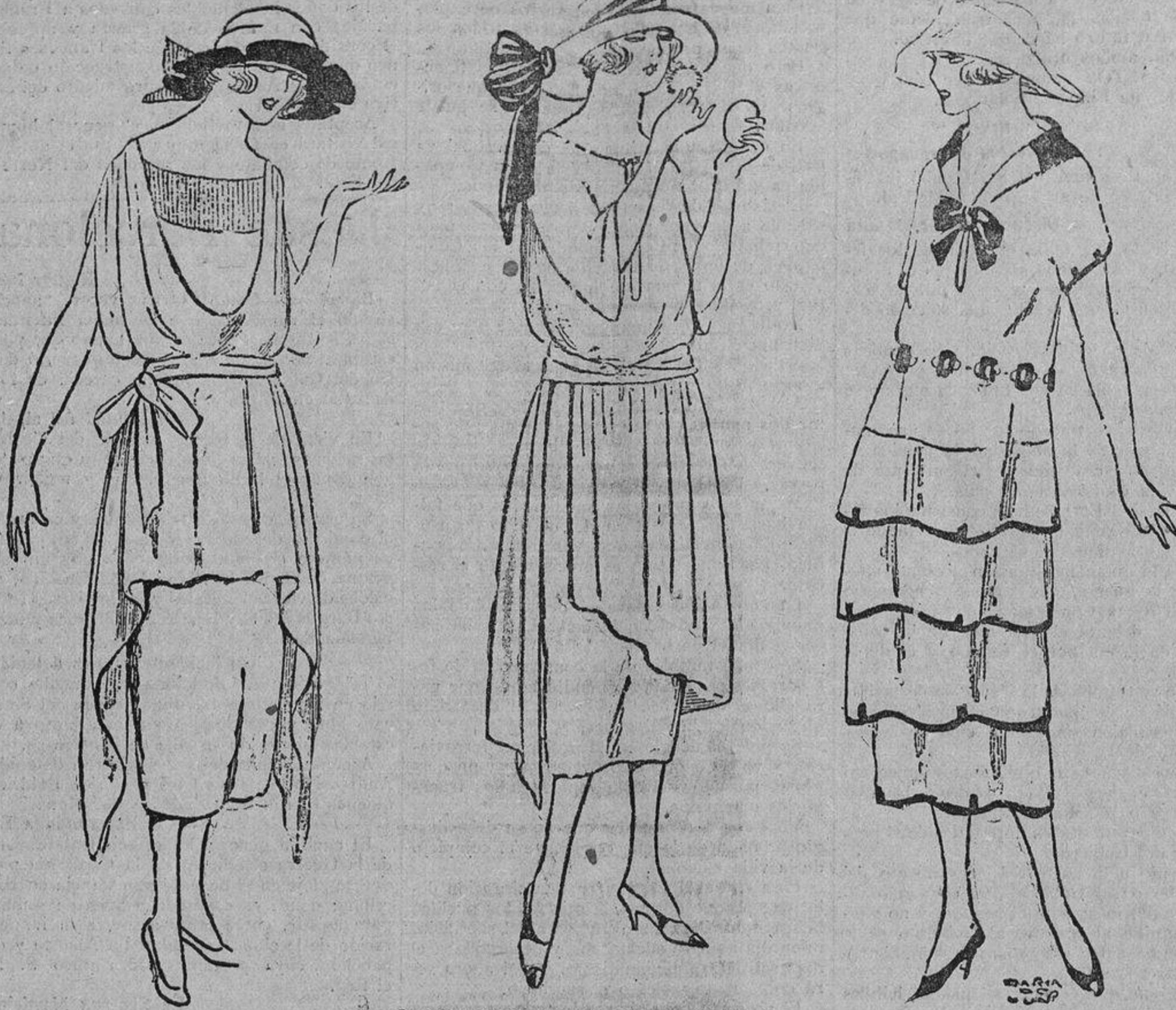
Crespón de seda verde mar, cuerpo blusón y delantal largo a los lados.

Enamorada. Por la descripción que hace de su novio, rubio sonrosado, pelo rizado,