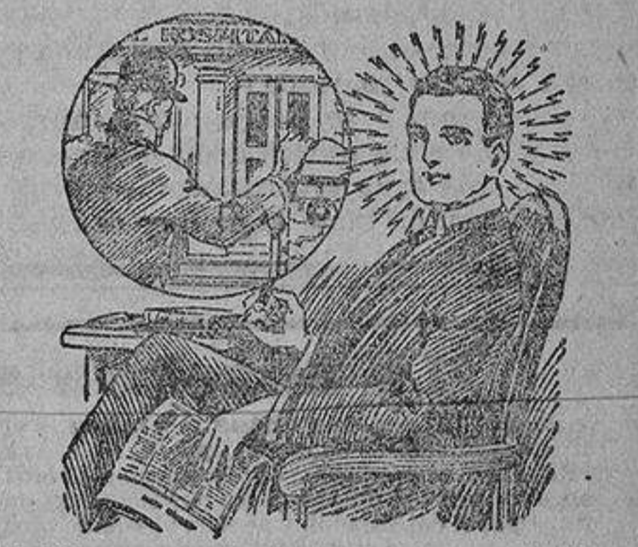
Podéis curaros sin abandonar las comodidades de vuestra casa. Las aplicaciones Pulvermacher son el único método para administrar la cura por la electricidad, recomendada por más de cincuenta eminencias médicas y por la Academia Oficial de Medicina de París.

Hoy en el mundo la neurastenia es más frecuente que nunca. Por consiguiente, es una buena noticia saber que se ha descubierto un tratamiento empleado con éxito extraordinario en grandísimo número de casos que se habían resistido hasta aquí al tratamiento médico ortodoxo. En el nuevo método no se emplean medicinas ni drogas, sino la más poderosa de todas las fuerzas de la Naturaleza, la electricidad, y todos los que padecen neurastenia—un estado intensamente agotante de bancarota nerviosa—deben escribir inmediatamente pidiendo el libro que se ofrece, en el que se describen los medios que están produciendo resultados maravillosos.