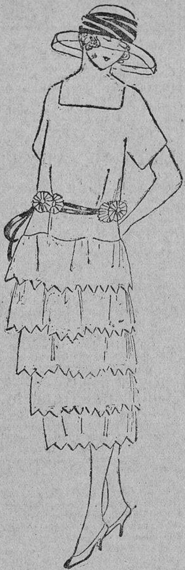
En lino rosa, con festones blancos; cintura de terciopelo azul porcelana.

«Si mi mujer se niega a que abra su correspondencia, quiere decir que me oculta algo, una falta seguramente. El día en que una mujer tiene algo que ocultar, el