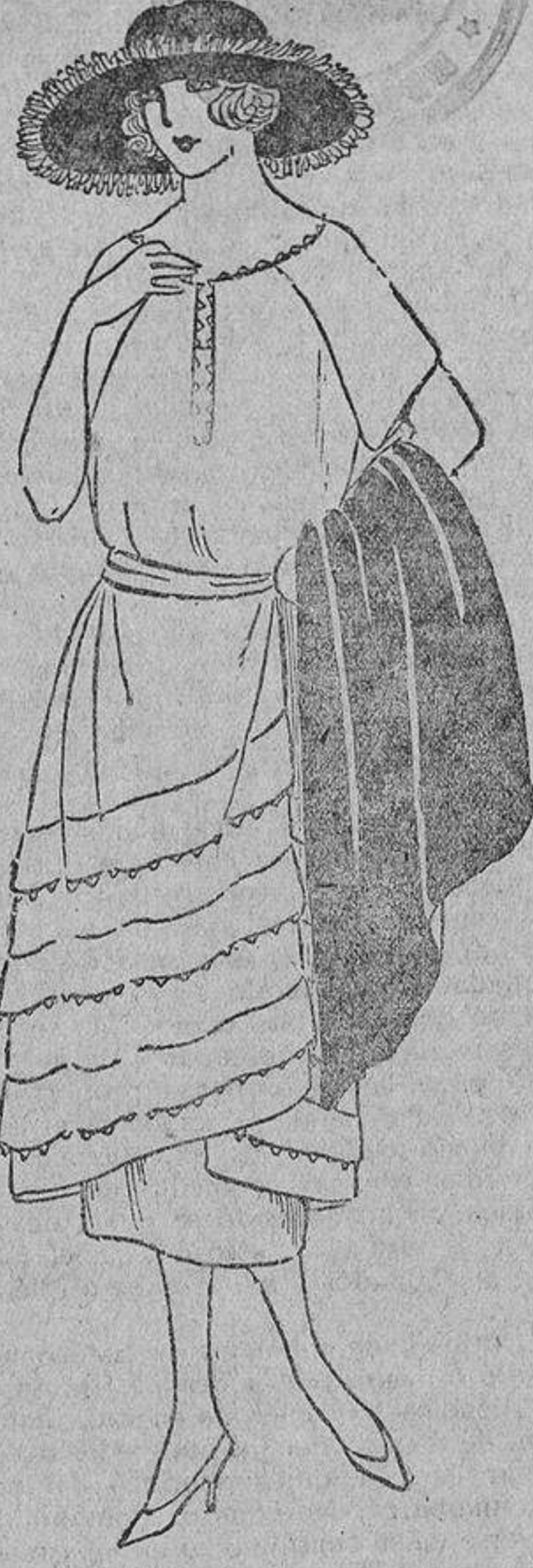
En tela de hilo con tres loras ribeteadas con riquitos; movimiento ligeramente recogido a un lado.

gusano de la mentira y de la felonía se instala para roer el fruto del matrimonio.»