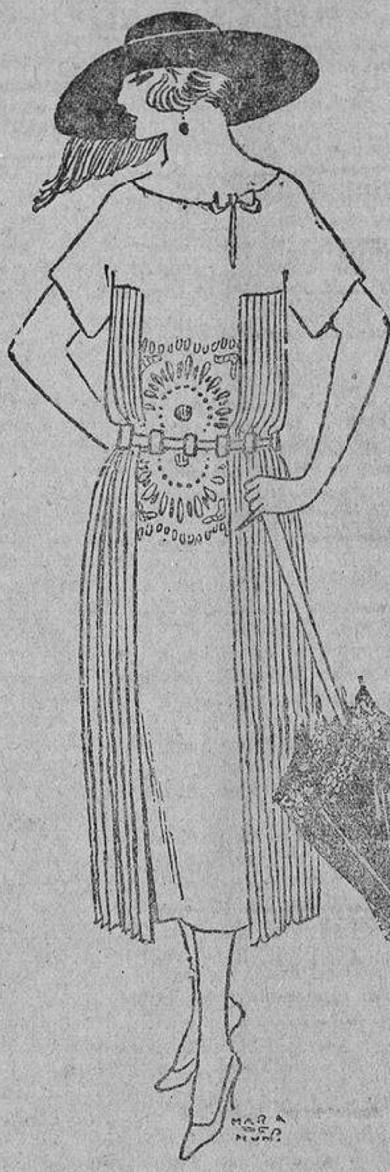
En tussor blanco, con bordados blancos o amarillos; y cintura plegada en terciopelo amarillo.