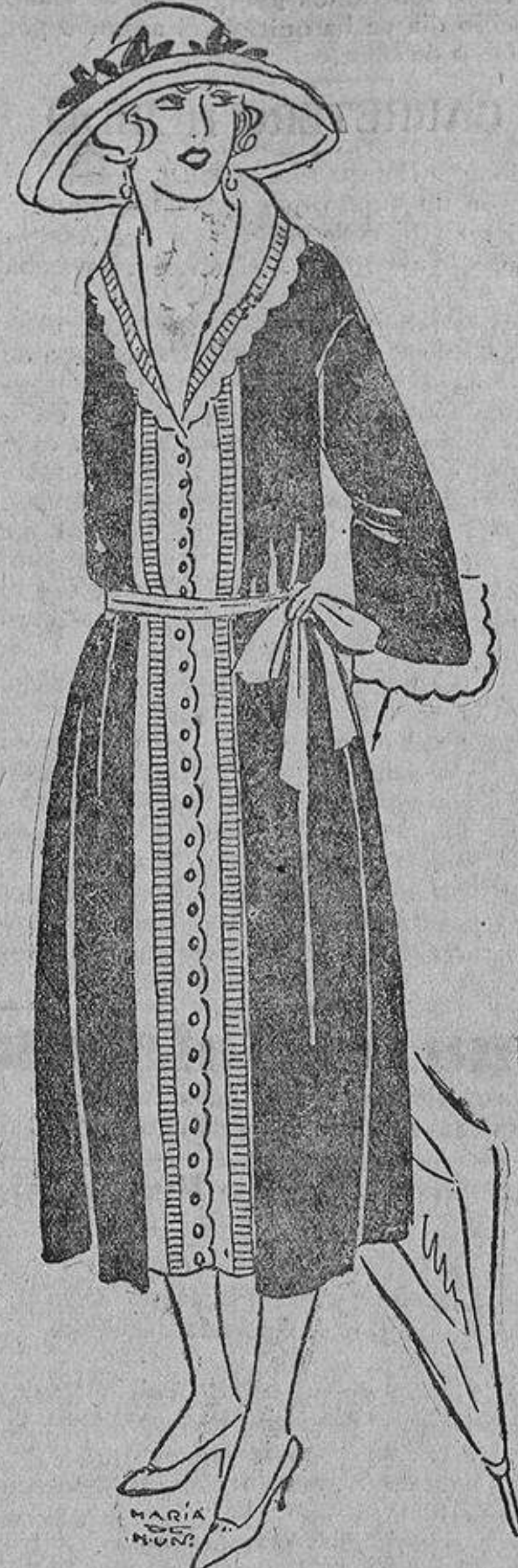
Muy elegante este vestido de crepón de China o tafetán negro, sobre una funda de organdí blanco con botoncitos negros.

una medias de tela de araña sumamente transparentes. Del sombrero descendía ostentosamente una gran «pena»; hacían bien en colgarla del sombrero, porque si no, nadie hubiera sospechado que la tenían.