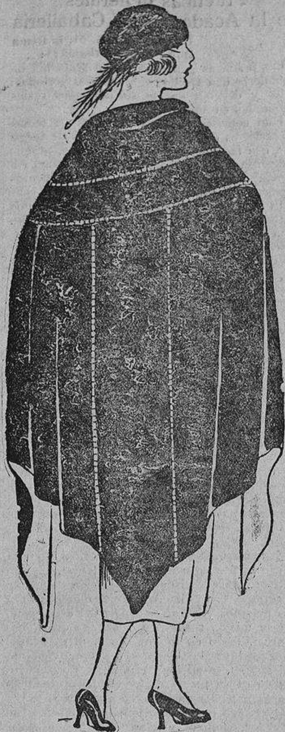
Capa de crepón de seda mate, negra. Forma tres picos y tiene como adorno unas vainicas.

Hace unos días pude contemplar a dos muchachas con su mamá probablemente, que me causaron un efecto deplorable. Sumamente escotadas, con un escote redondo y muy empolvado; las caras pintadas con exageración, los vestidos estrechos, y tan cortos, que apenas descendían unos dedos bajo la rodilla para dejar ver