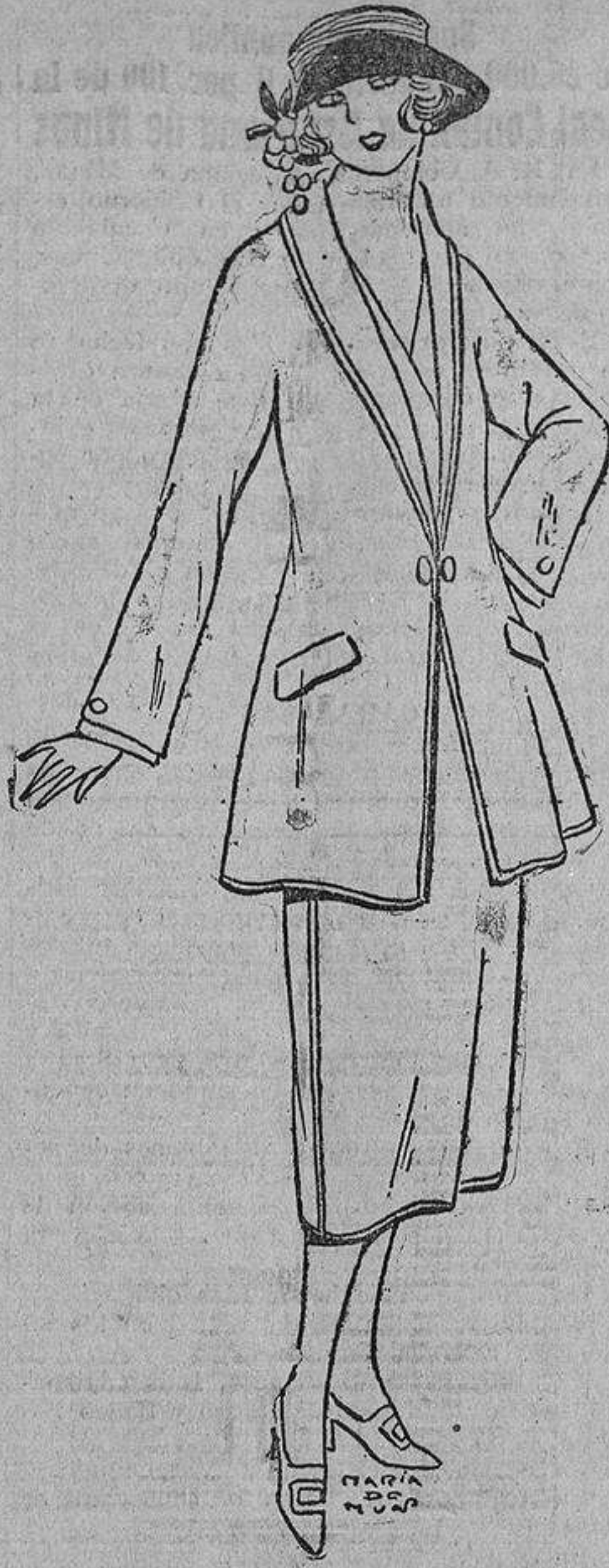
Para calle, nada mejor que un sencillo traje sastré de gabardina «belge» con cinta encerrada, un tono más oscura.