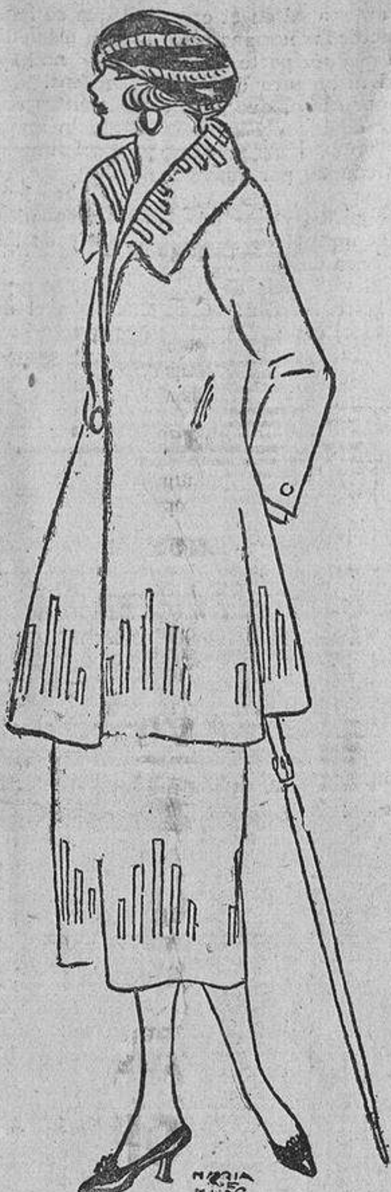
Para primavera, donde se permite a los trajes sastre más fantasía, este modelo adornado con trencillas o incrustaciones de piel de cabritilla.