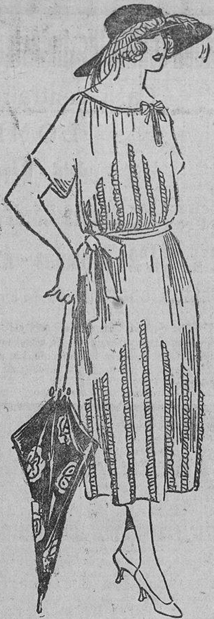
Muy «joven» este vestido recto, fruncido en el escote a lo «virgen», de crespón de China azulina y tiras plisadas de la misma tela.

Viene abril; adornemos nuestros sombreros con flores irreales y frutas fantástica, porque, en verdad, los coloridos de estas flores son de tonos tan extraños, que la Naturaleza no los había previsto. Las espigas no son doradas cuando se lucen en los sombreros, y al ver las uvas