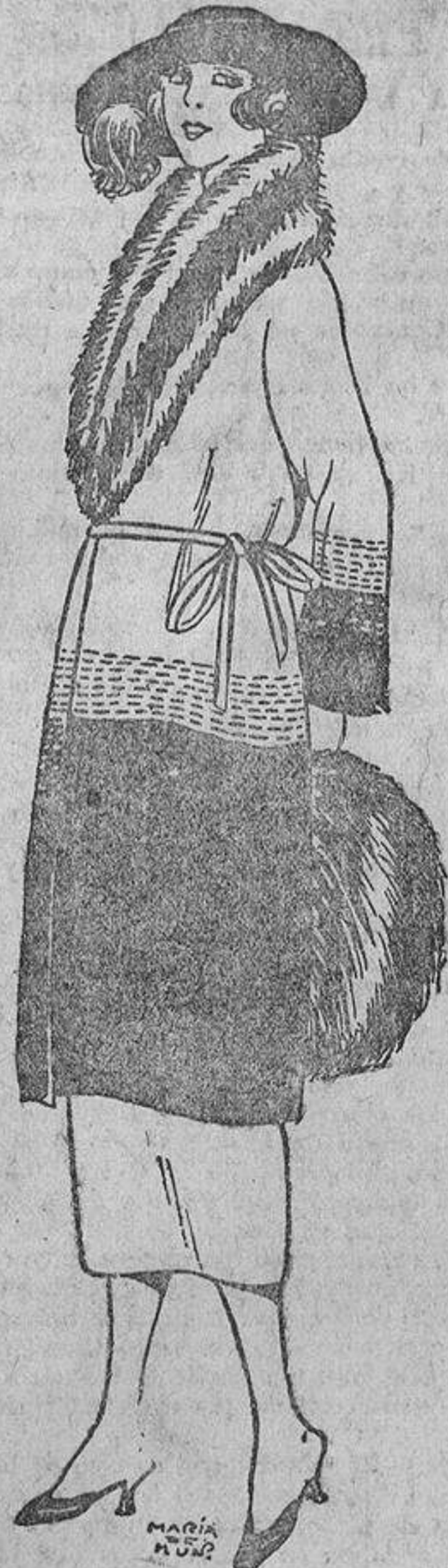
Sobre la tira de terciopelo marrón, respuntes «beige» y viceversa. Cuello de piel de tonos rojizos.

tas, así como alguna epidemia. También subirán las subsistencias. Todo esto lo sabemos, lectoras, sin ser unas pitonisas como madame de Thebes.