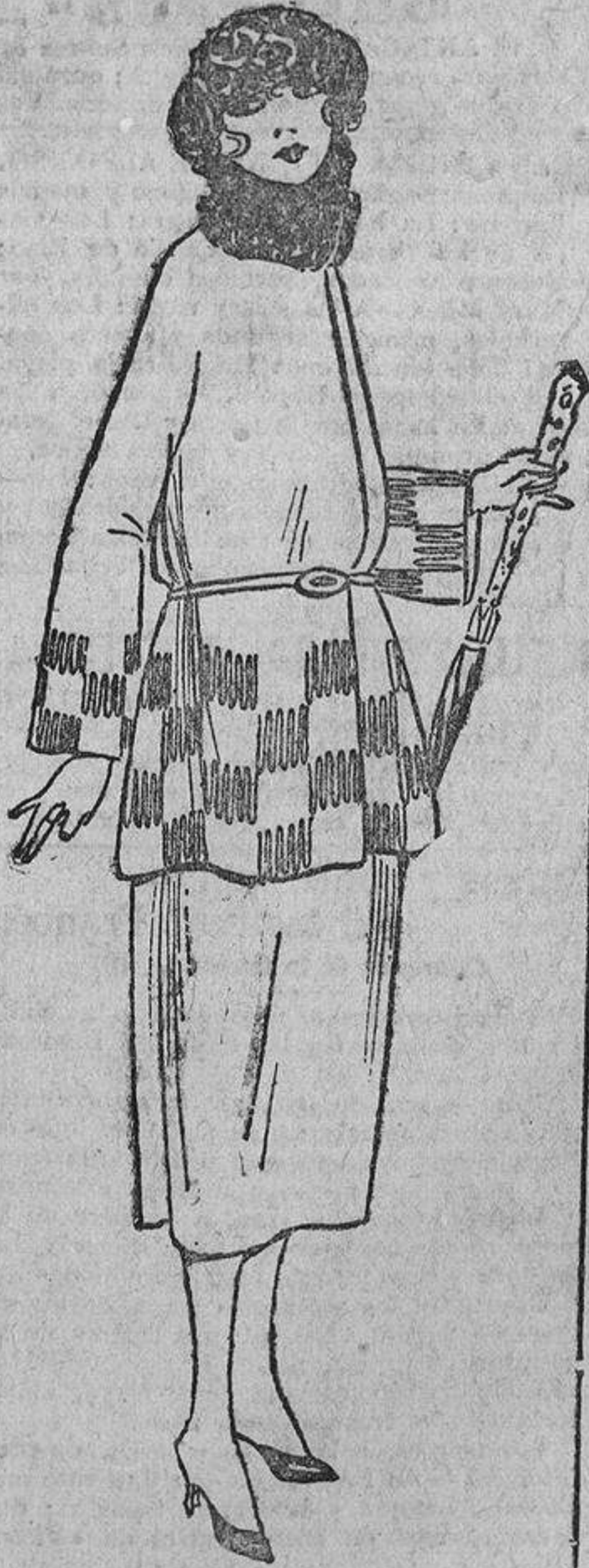
Un adorno sencillo, hecho con «soutache», y que se presta a bonitos efectos; pero lectoras, no agarréis el paraguas como lo ha hecho esta figurina para posar, porque parecería que lleváis un bastón de mariscal.

Por el momento sabemos fijamente, con la sabiduría que inspira al calendario zaragozano, que habrá lluvias en marzo y abril, calores y sequías en julio y agosto, abundantes cosechas en algunas provincias y fuertes mareas en septiembre en las cos-