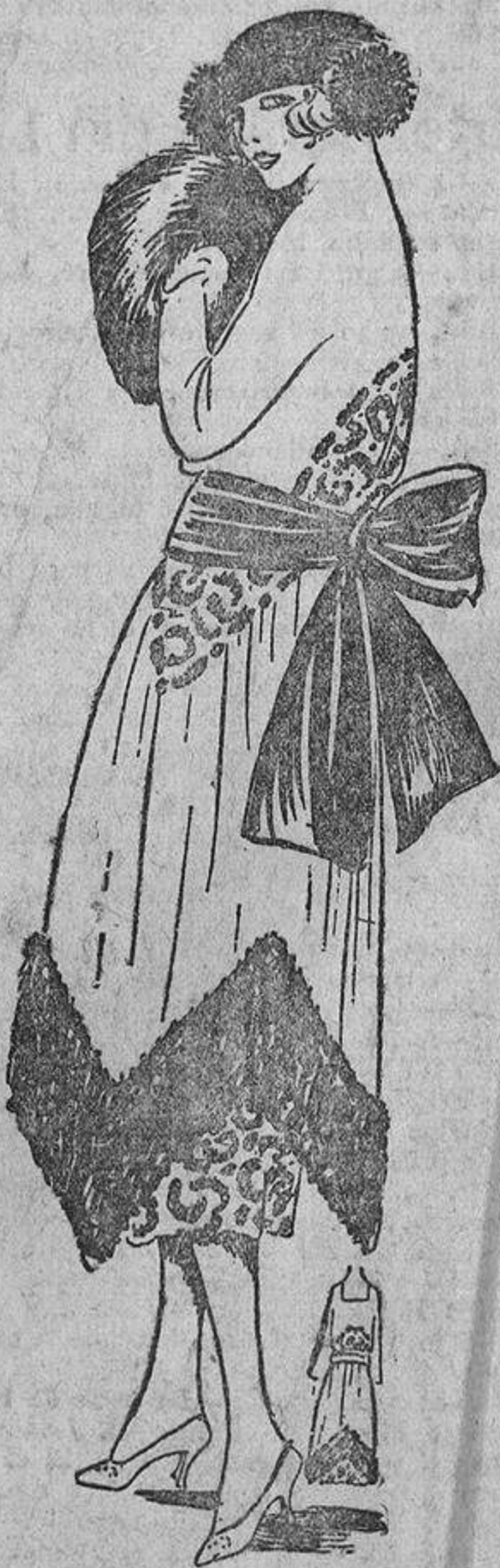
Nos vuelve un poco la espalda para enseñarnos la osadía de su banda negra sobre su vestido ultra elegante, de duvetina roja, con bordados de espuma y piel negra.