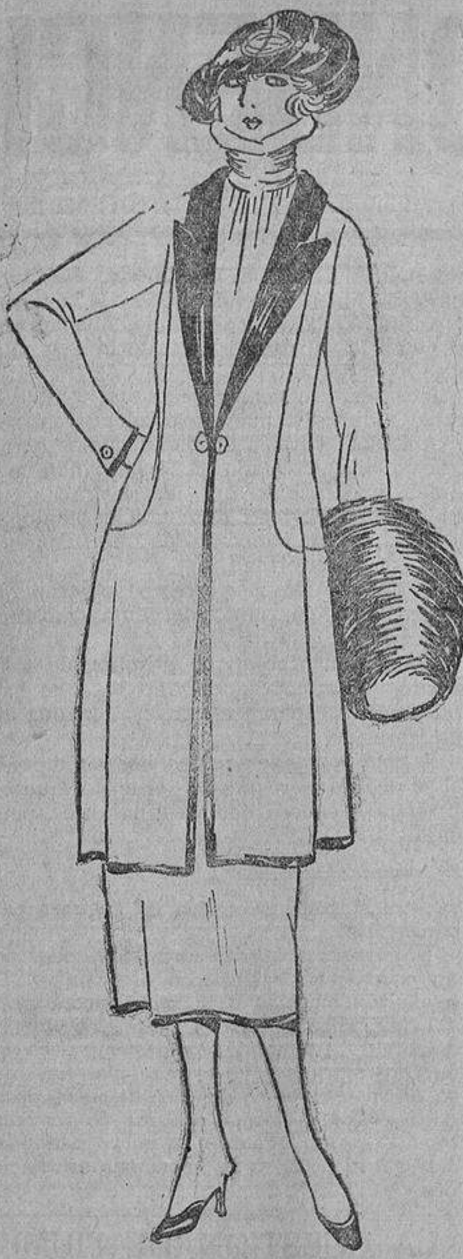
Clásico traje sastre, azul marino; solapas de raso o de su misma tela y trencillas negras.