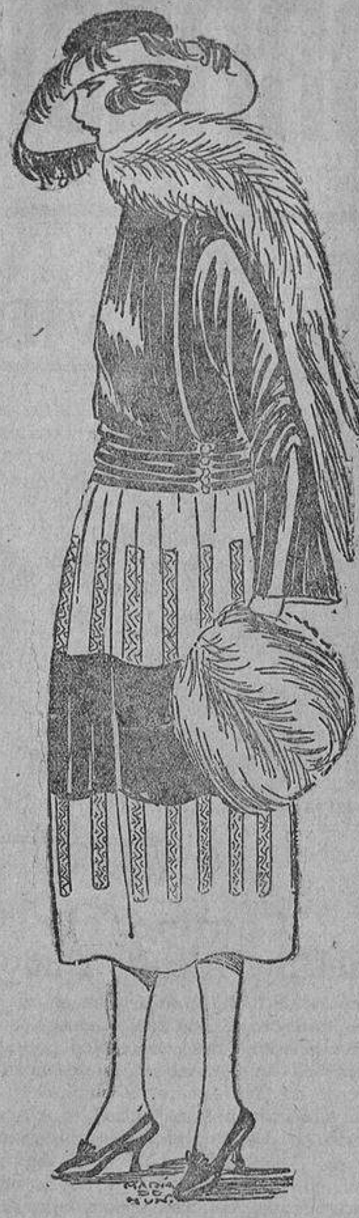
Una idea bonita para un «arreglo». El cuerpo de terciopelo negro, así como la tira del centro de la falda, y lo demás de taletán o paño con unos bordados que pueden ser negros o de color.