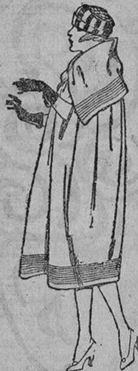
Capas de gabardina inglesa, diferentes colores, pespunte de adorno. De ptas. 130 a 160.