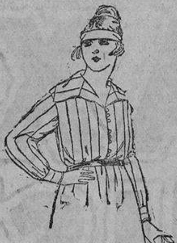
Blusas de franela listada De ptas. 9 a 15.