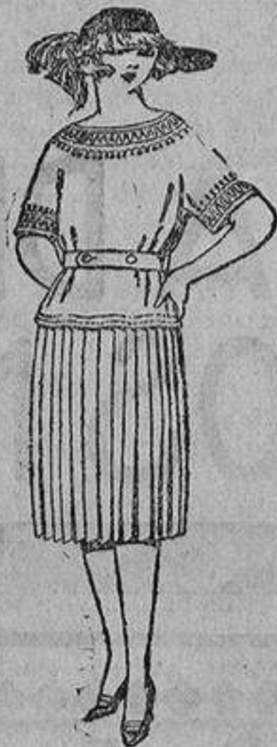
Trajes de gabardina, lanilla, sarga inglesa, etc., adornos bordados. De ptas. 100 a 130.