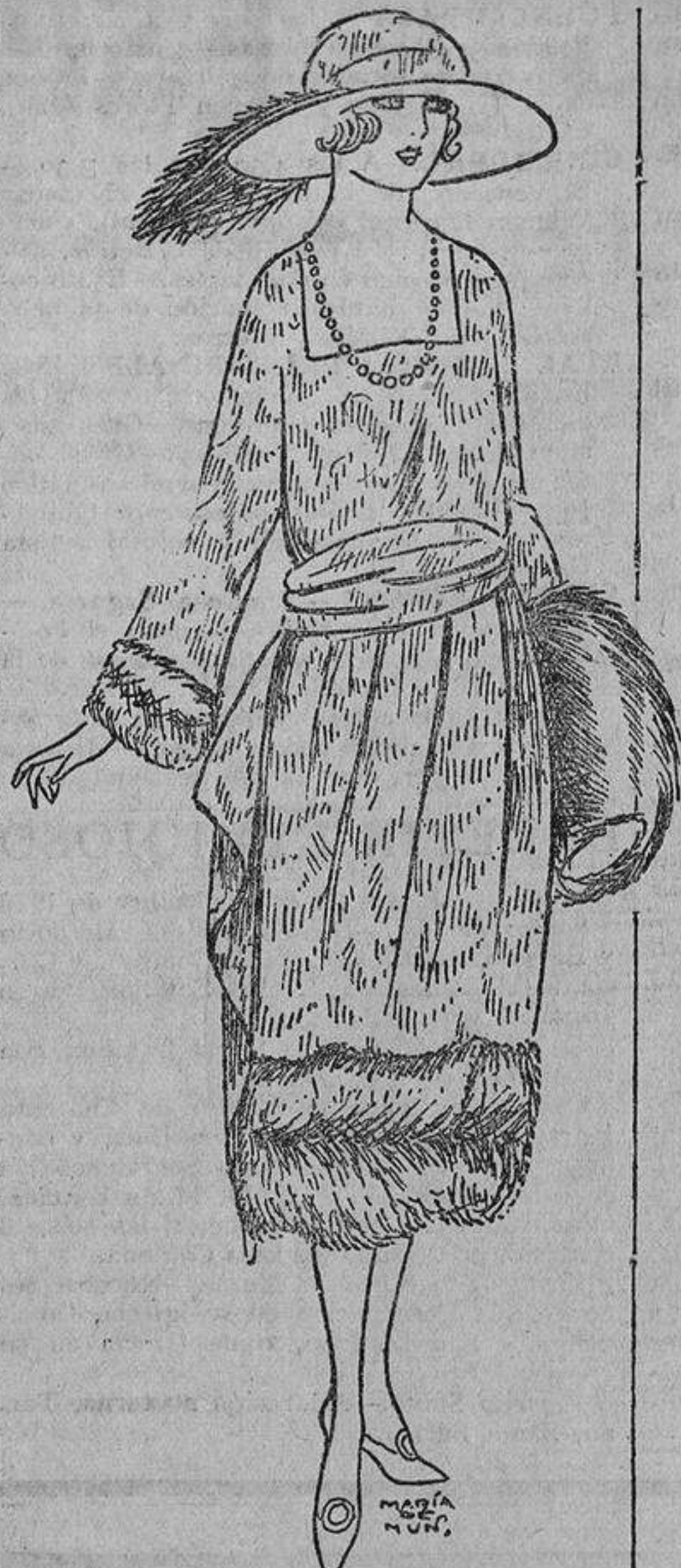
Cuando el tejido es suntuoso, un brocado gris, por ejemplo, debe elegirse una hechura sencilla, sin más adorno que un zócalo de piel, solo delante.

Entre Jacinta y su mamá eligen los vestidos, hechuras, adornos, y como doña Claudia exige que las dos hermanas vistan exactamente igual, resulta que la pobre Hena tiene que envolver su ahilado cuerpo en trajes ceñidos (como los de su hermana, para que no la engruesen) y usar una gama de colores que le sientan horriblemente mal.