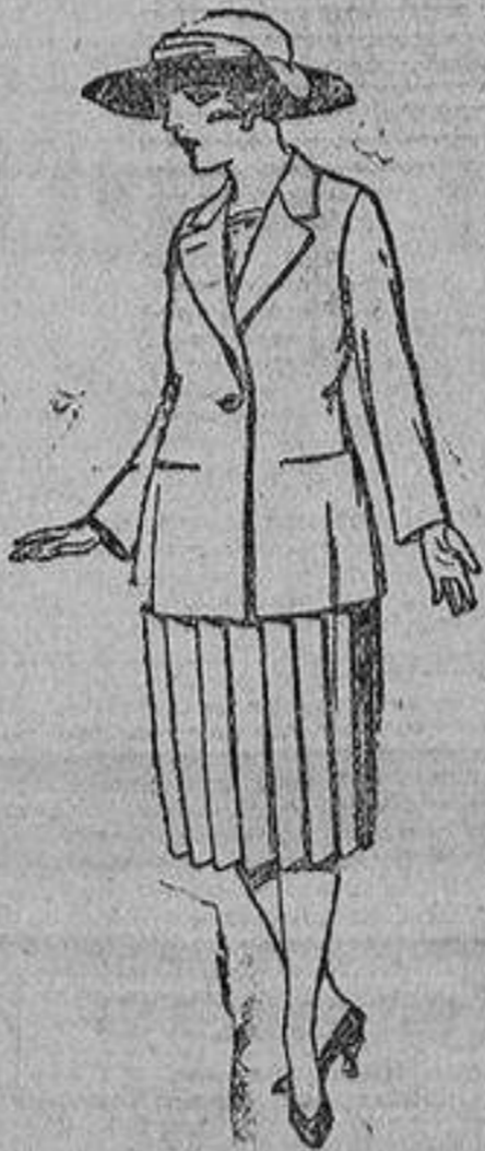
Trajes de lanilla, sarga, etcétera, en azul y color. De ptas. 90 a 120.