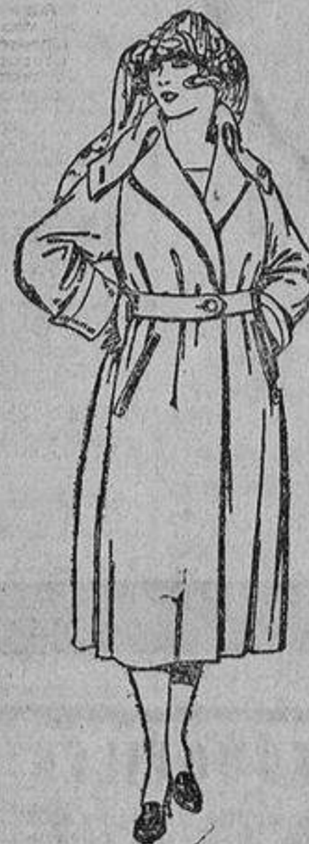
Abrigos de gabardina inglesa, impermeabilizada. De ptas. 110 a 200.

ROPAS CONFECCIONADAS PARA CABALLERO, SEÑORA Y NIÑOS