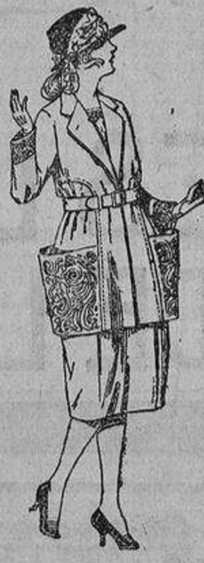
Vestidos de sarga inglesa, estambre, etc., en azul y color, adornos bordados. De ptas. 65 a 90.