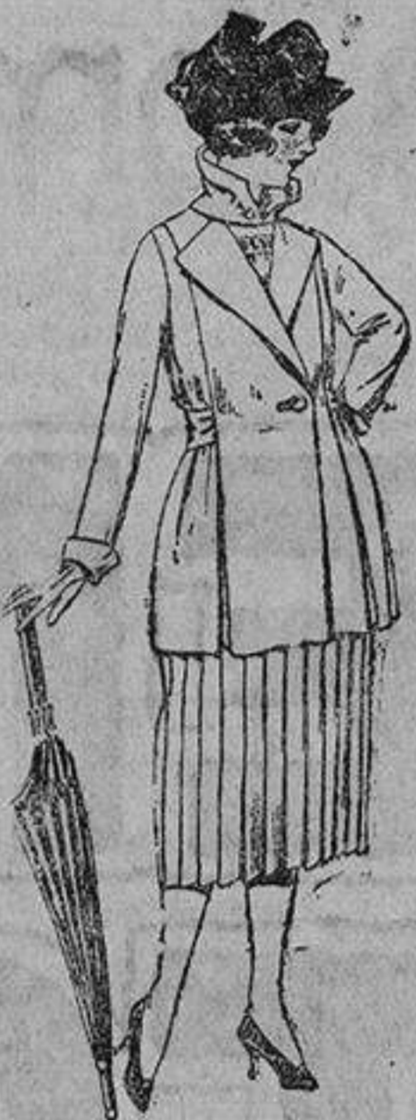
Trajes de gabardina, lanilla, estambre, etc., en negro, azul y color. De ptas. 130 a 165.

Barcelona, Alicante, Almería, Bilbao, Cádiz, Cartagena, Gijón, Granada, Málaga, Palma de Mallorca, Santander, Sevilla, Valencia, Valladolid y Zaragoza