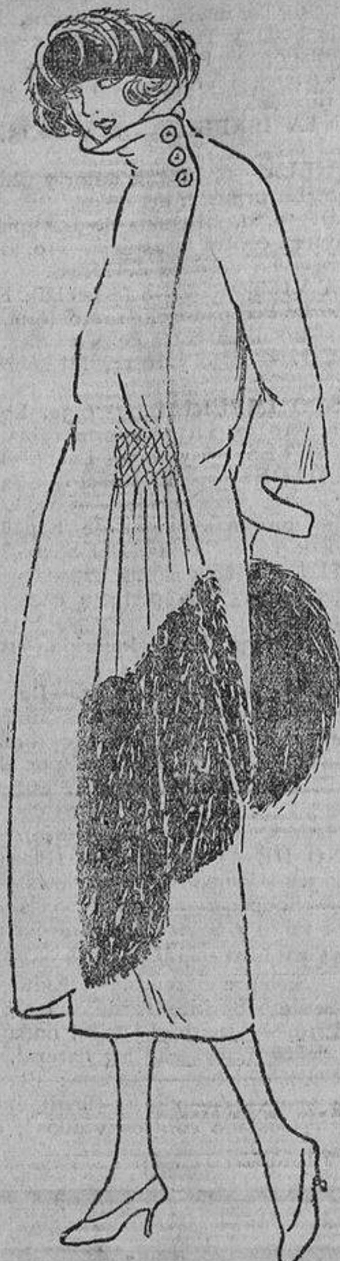
Un cuerpo esbelto puede permitirse el ir «fajado» en un vestido de duvetina cruzado a un lado y con frunces «nido de abeja» y piel.