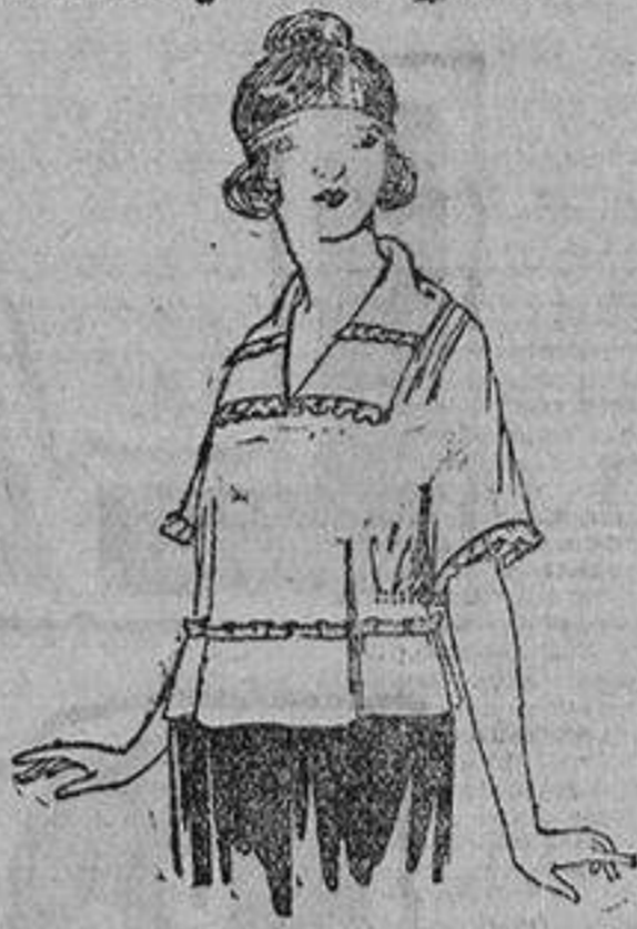
Blusas de crepón de seda, granadina, charmeuse, etc. De ptas. 48 a 70.