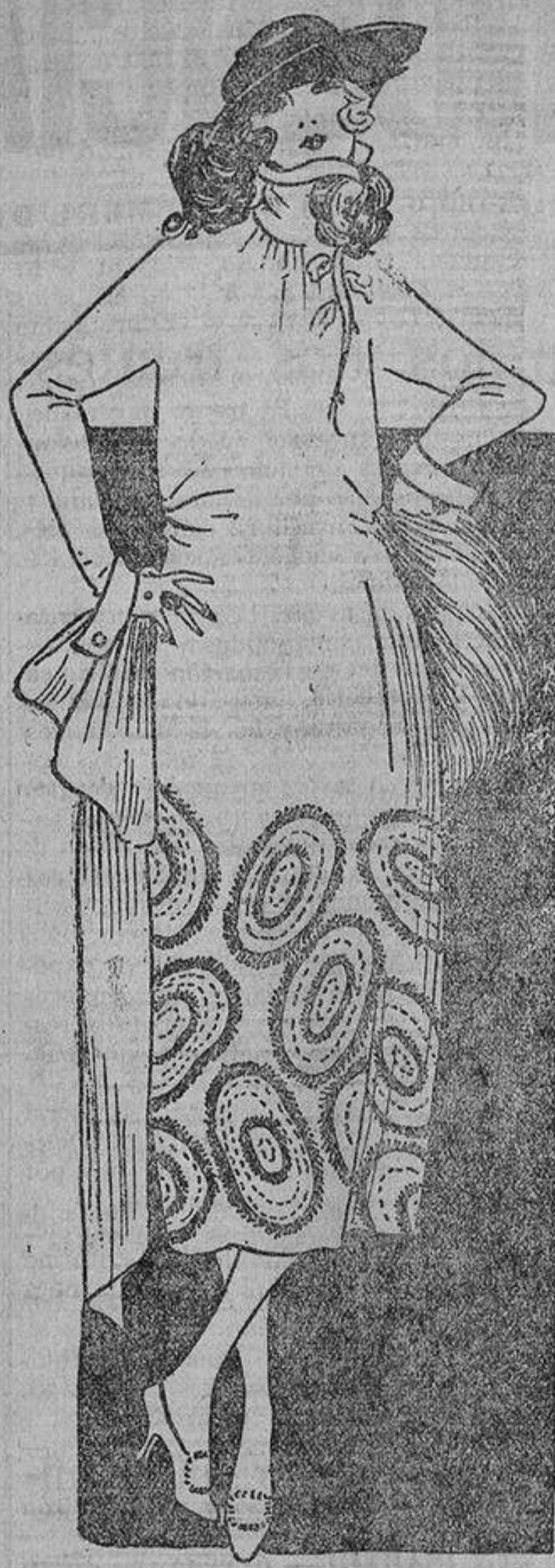
¡Qué lindo detalle, como adorno el de unos grandes óvalos hechos con tiritas de piel muy estrechos, como fleco, y unos pespunte!