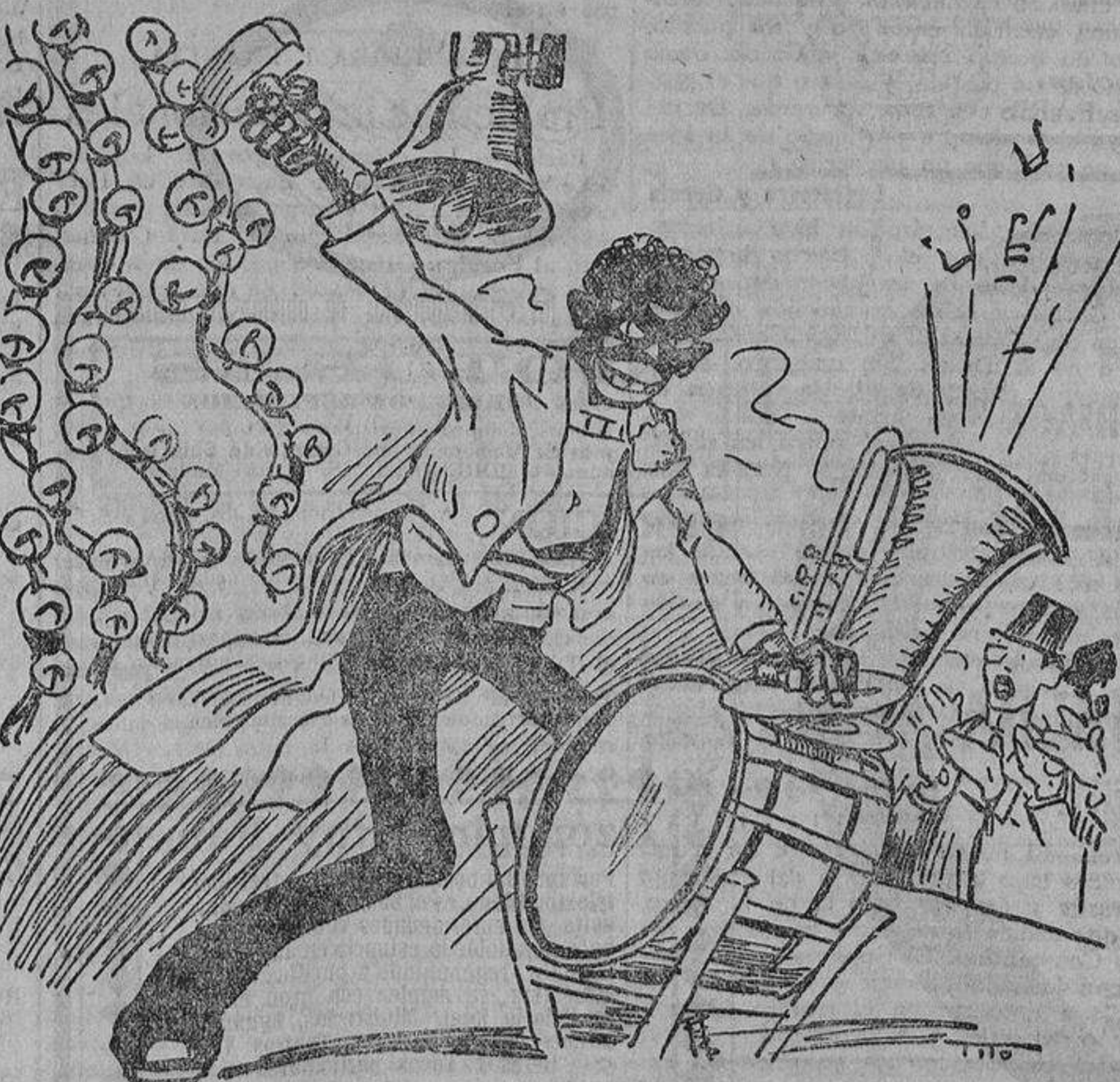
—¡Bueno; si esto lo hiciera en mi país, me mataban!