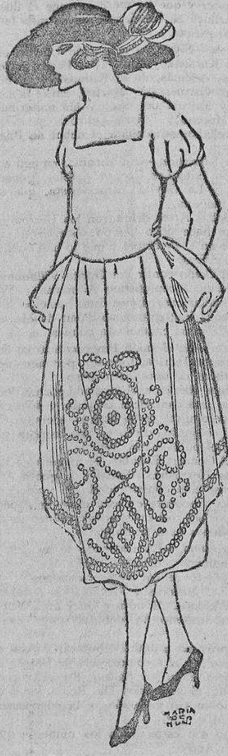
Por la tarde asiste a una fiesta benéfica; quiere estar seducida, a fin de obtener espléndidas limosnas, y por eso lleva un «chito» modelo de tafetán pétalo de rosa, bordado con ojete de corsé, negro. Una amiga suya lo ha copiado en azul marino con ojete blanco.