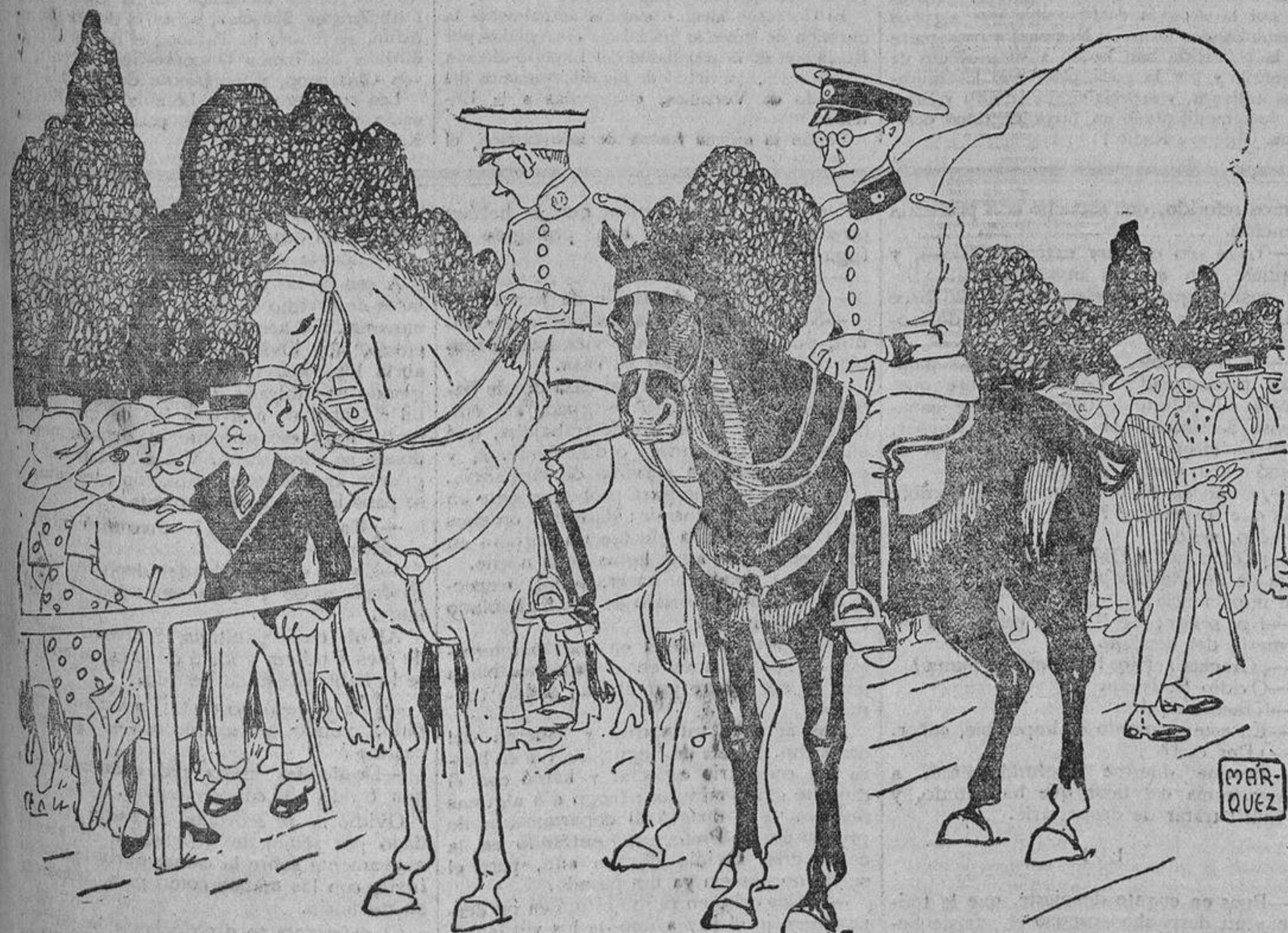
«Lo que son las cosas!... La carrera de militar me ha costado años, y ésta la he ganado en media hora escasa.»