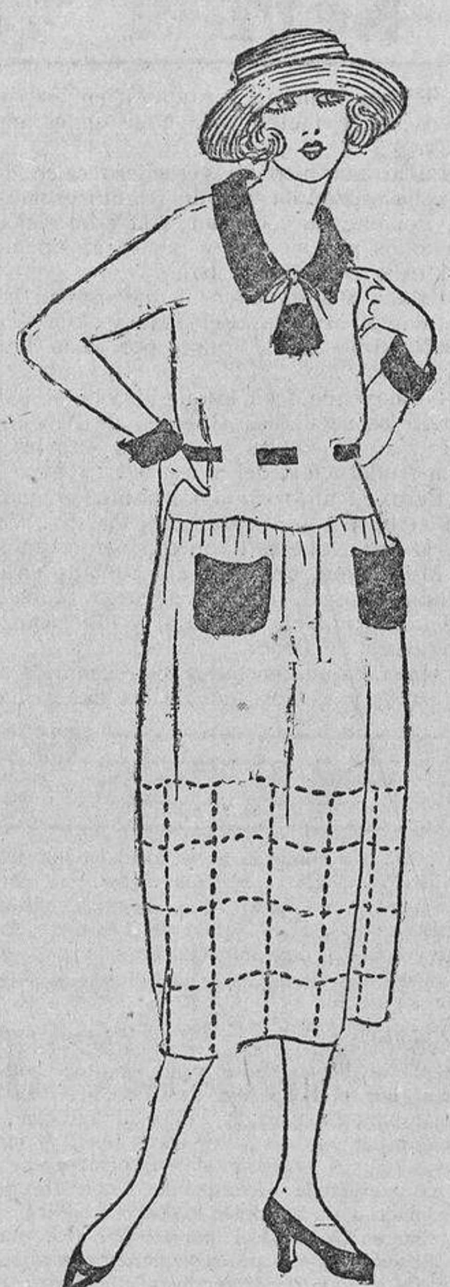
De un tejido de algodón crudo, tiene unas cadenas marcando un cuadrícula y unos bolsillos, puños, cuello, etc., del color de sus labios.