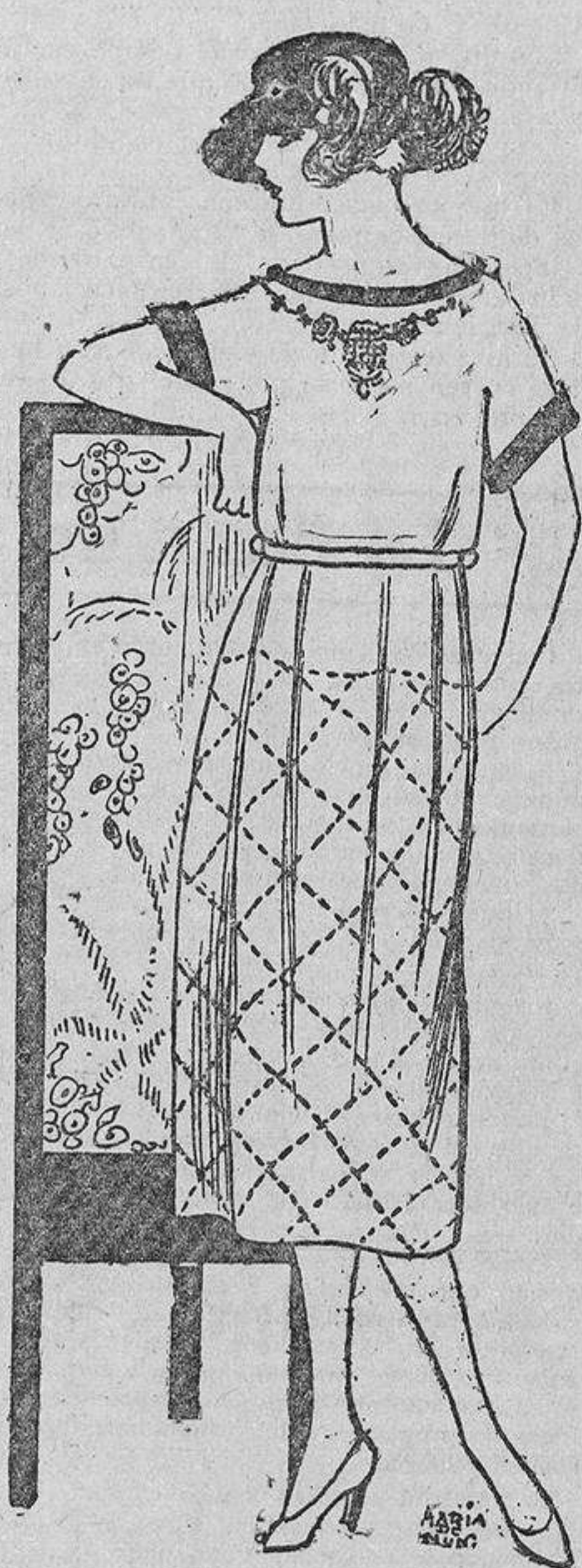
Sencillo, cual conviene a una joven bonita, de tela de hilo blanca adornado con cadenas y tela color canario.