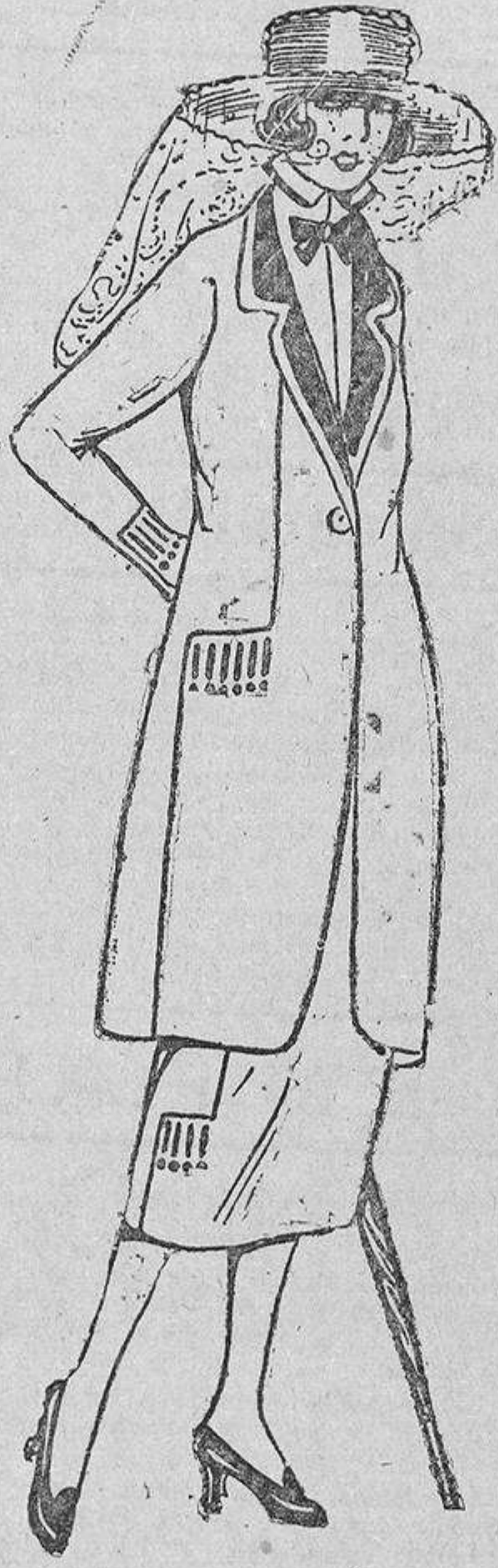
De líneas sencillas es este traje sastre de cashemirino adornado con tiras de piel y botones en un color vivo.