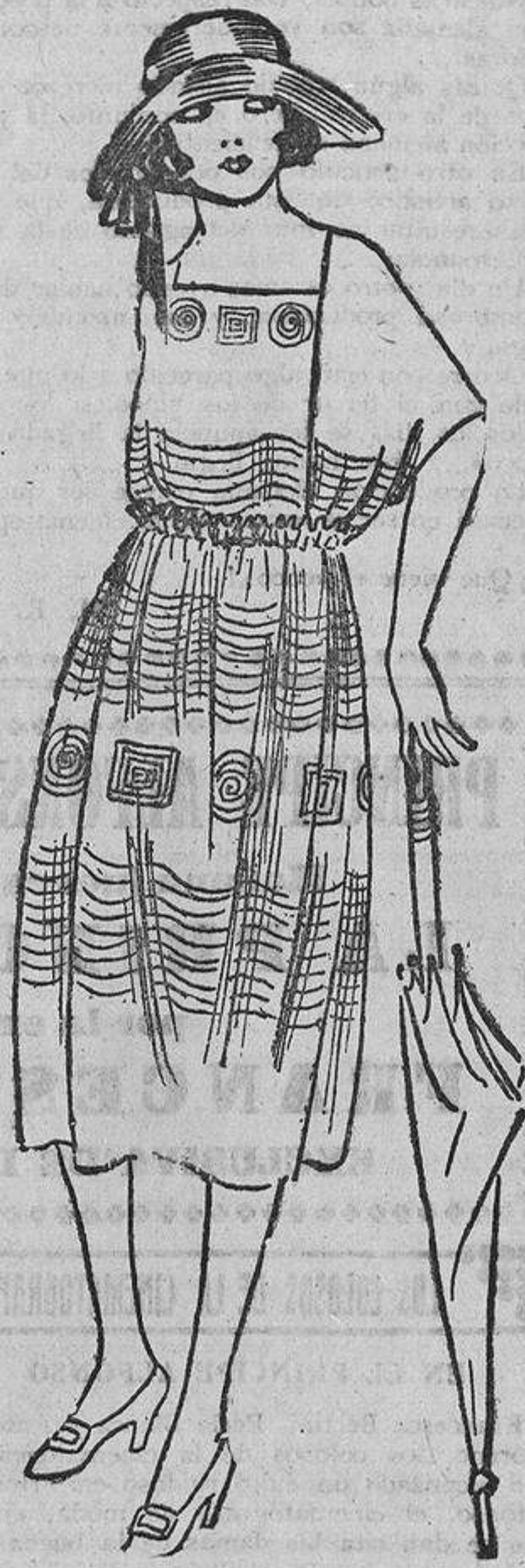
La prima de Anita, dos meses «más vieja» que ella, se ha comprado un vestido de crepón de algodón crudo adornado con grupos de plieguecitos y unas aplicaciones hechas con esa cinta estrecha blanca de los cuellos marineros.