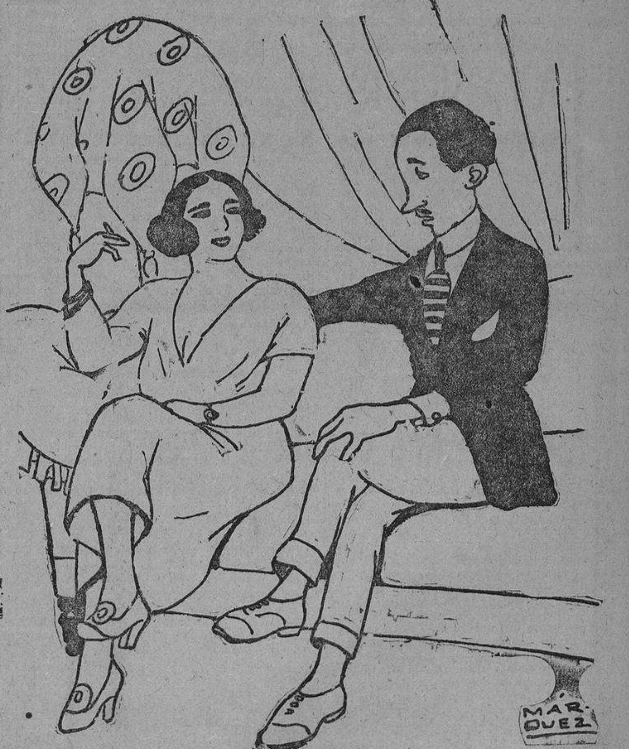
—Es extraño que una mujer tan bonita y con un buen caudal no se quiera casar. —Cualquiera se anima, ahora que hay un Landrú en cada esquina.

Antequera, con sus calles en cuesta, después de los llanos urbanizados de Sevilla, Cádiz y Málaga, es una nota inesperada. Hemos vuelto a encontrarlos, también de pronto, con la sorpresa del invierno. El Torcal, que envuelve con sus altos peñascales Antequera la blanca, la señorita, nos envía un soplo helado, que es una desilusión, a dos pasos de