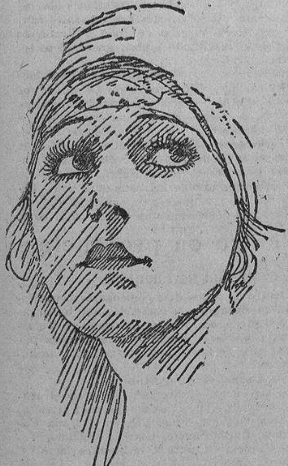
Gloria Swanson, la admirable «estrella» de la escena silenciosa, cuya belleza es excepcional

RAEL CINEMA PRINCIPE ALFONSO Grandes programas