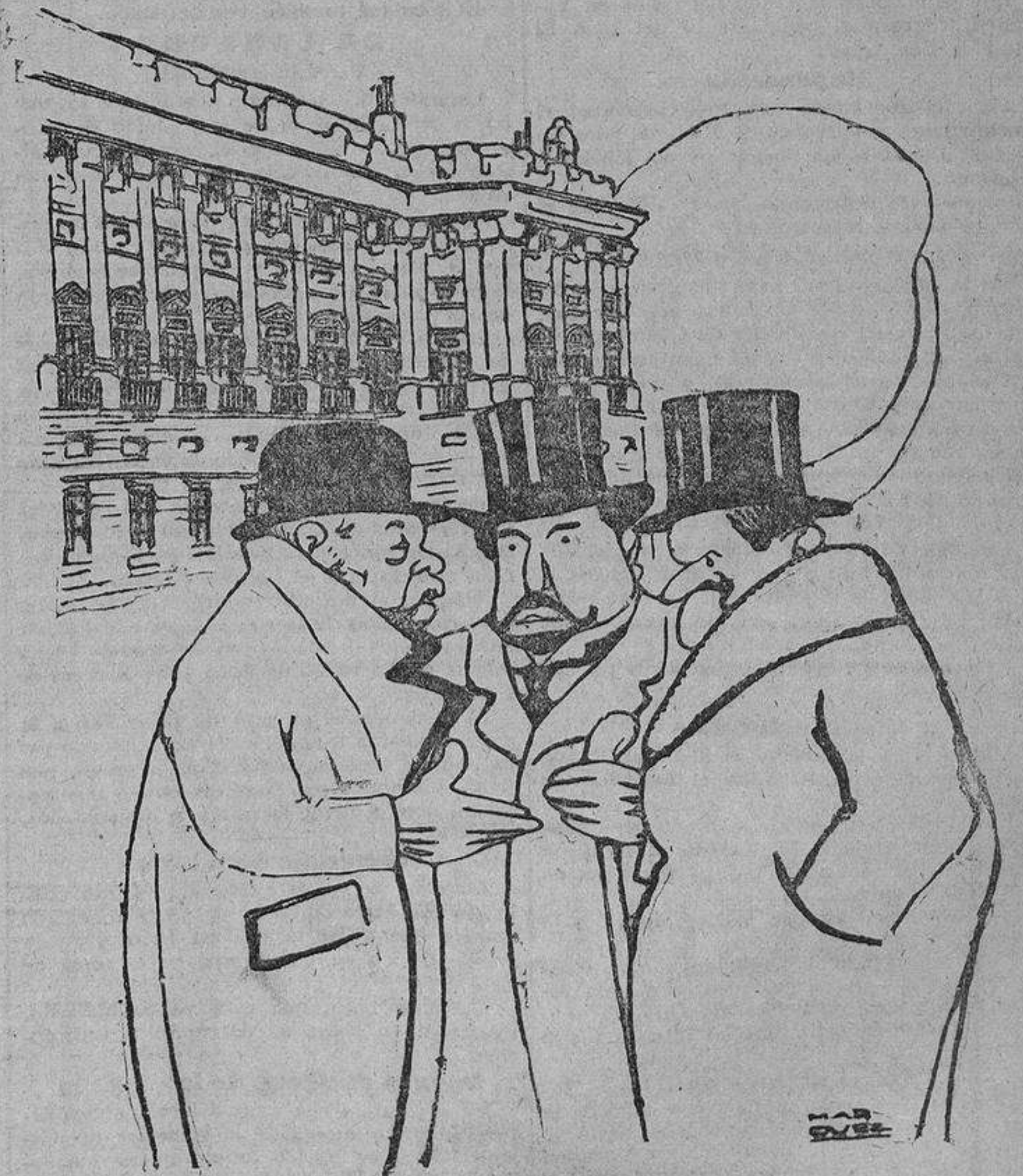
—Por fin solo me «ruido de teatro» lo de la proposición. —¡Qué le hemos de hacer!... Se conoce que no era hora de que nos llamaran a escena.