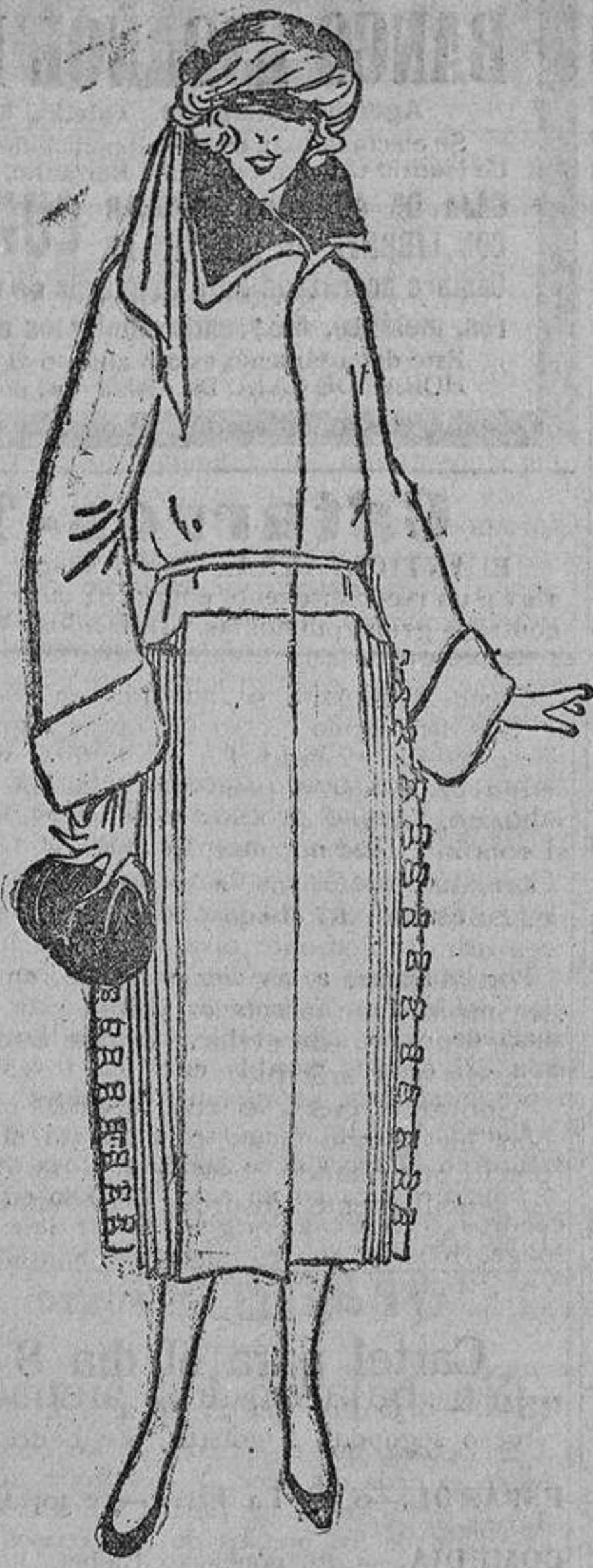
Abriego de entretiempo. Paño fino color mostaza con «plissé» a los lados y unos lacitos del mismo paño en la tabla que está en el centro del «plissé».