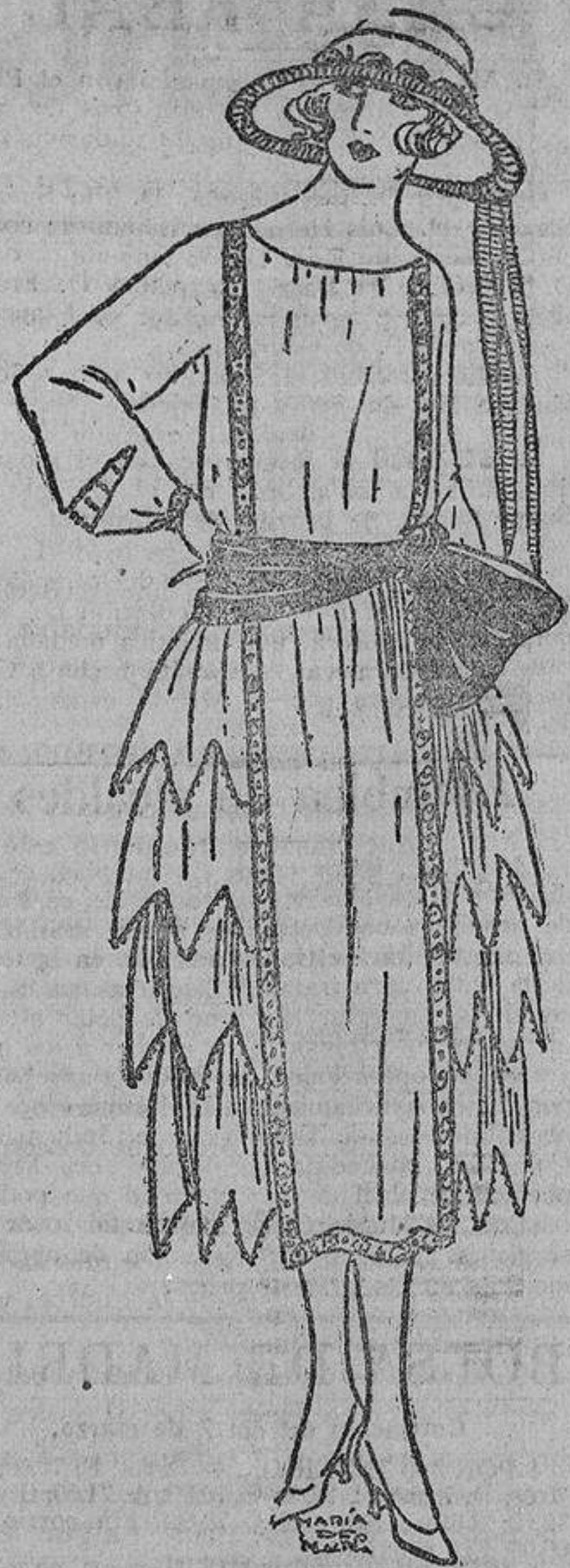
A fin de que las lectoras de «LA CORRESP.» sean las primeras en conocer la moda para este verano, he aquí un lindo modelo de crasón de China rosa, con banda azul porcelana y entredós, formando delantal, bordado con cuentas azules.