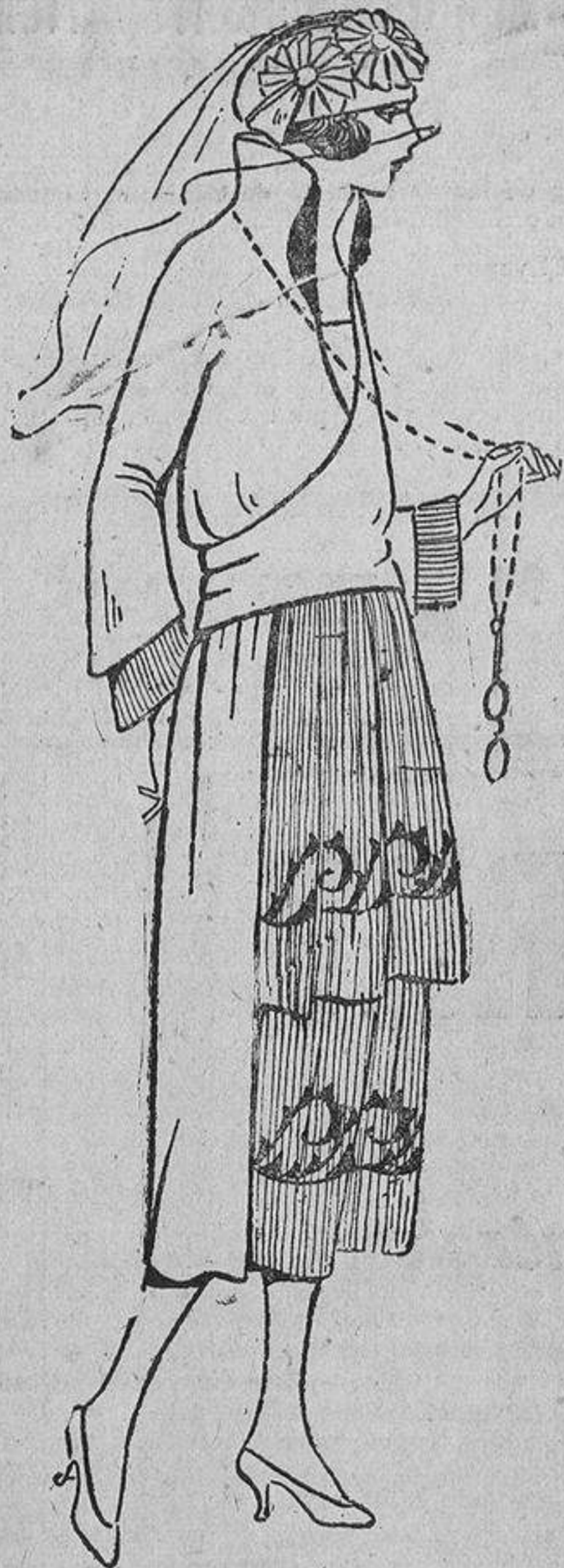
De «chameuse» azul marino, con dos volantes de crepón «georgette» bordados en azul «nattier»; cuerpo cruzado que se anuda en la espalda.