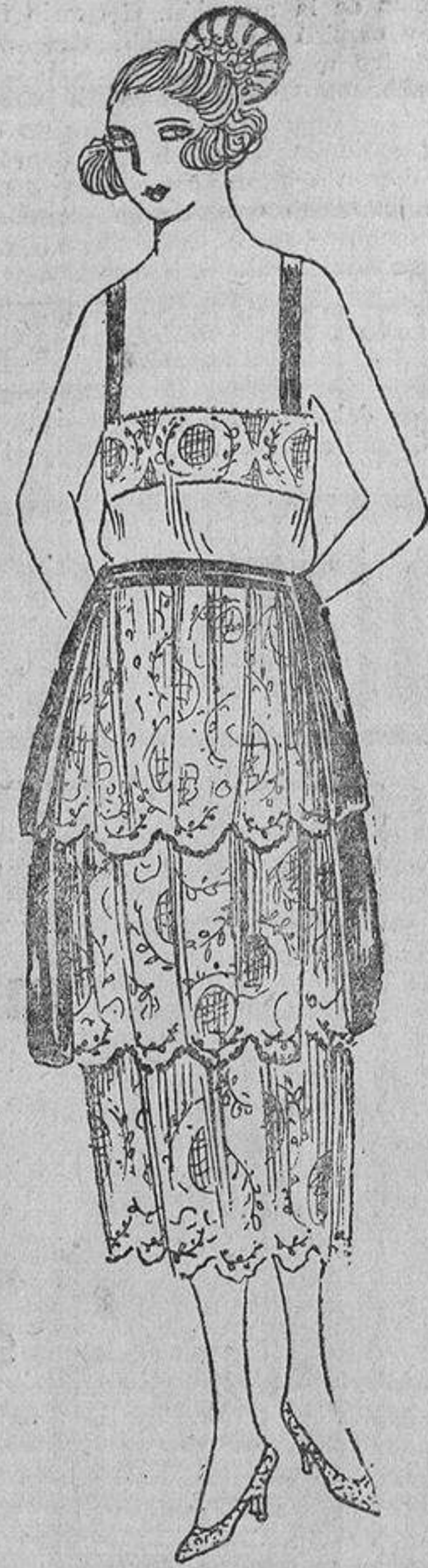
¿En este modelo creeréis, así como yo, ver un traje de baile? Nada de eso; se trata sencillamente de una combinación compuesta por tres volantes de encaje crema, que forma parte de un «trousseau» elegante.

pequeñas, hasta demasiado pequeñas, ¿por qué las cargan con sortijas? Las sortijas no sirven más que para disimular defectos.