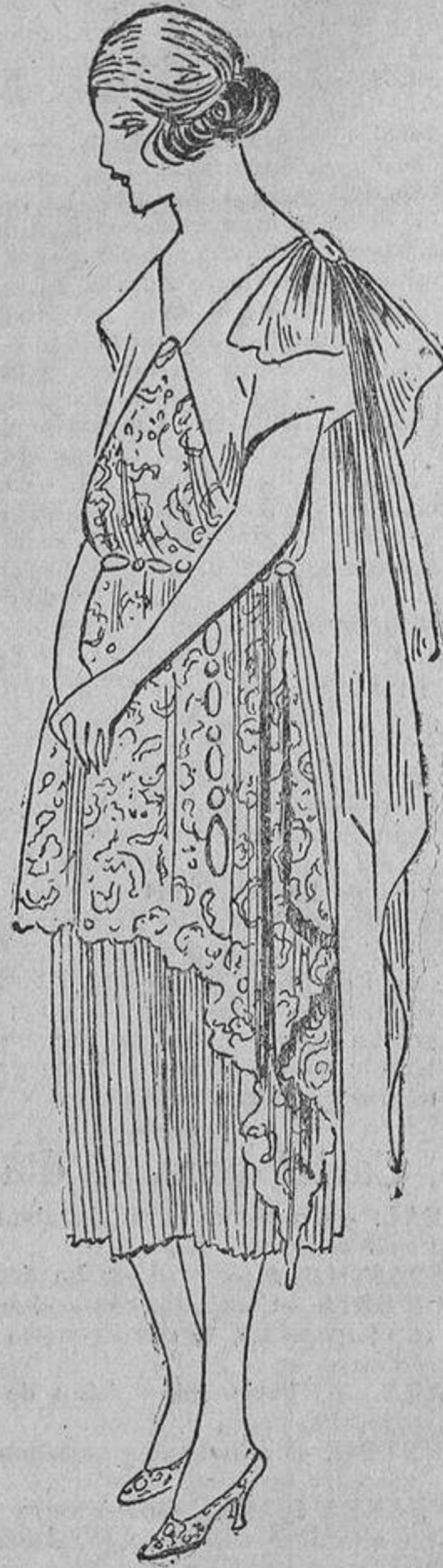
Sobre un vestido de crespón «georgette» rosa pálido, un encaje crudo formando caldas a los lados. En el hombro gran lazo de tul.

perfumerías, peluqueros, y todo el mundo los lleva.