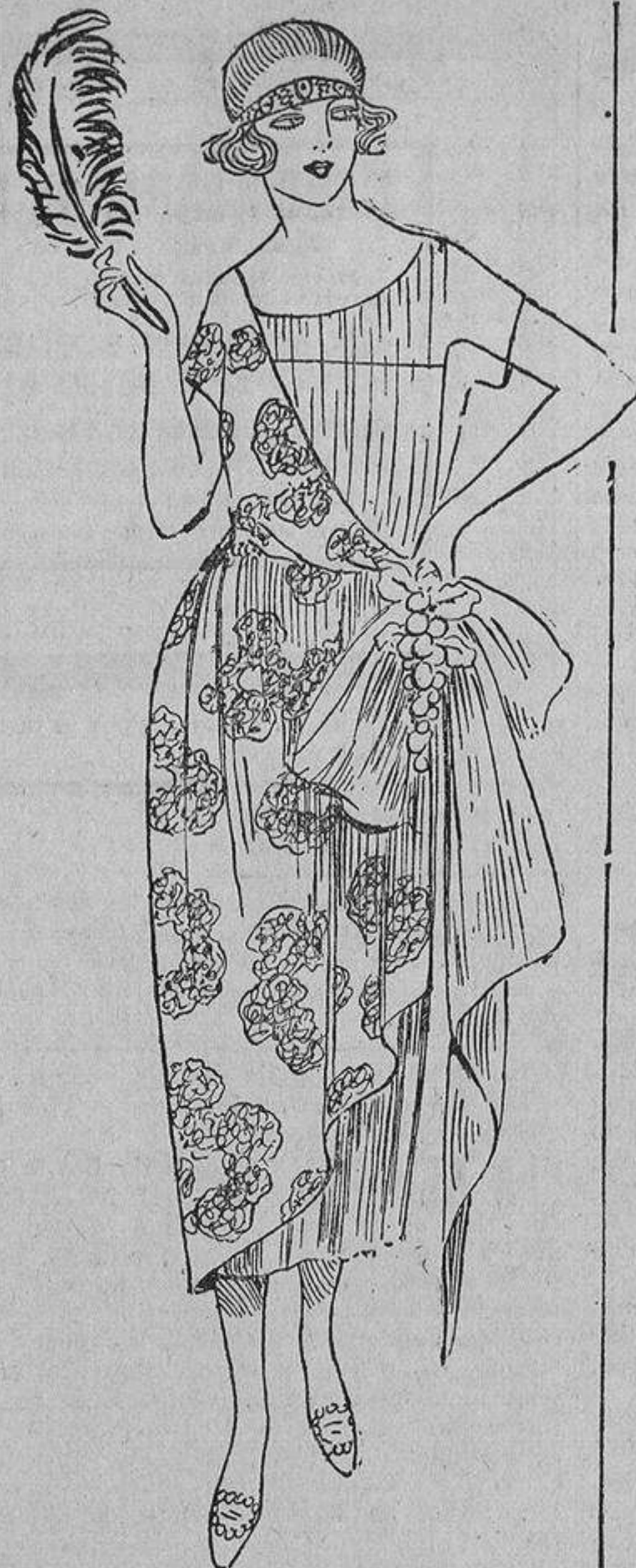
Muy artístico este traje de baile combinado con dos tejidos, uno de ellos brochado o con lentejuelas, tono sobre tono. Calda de tul a un lado y flores o frutas.

Esto proviene de que al estallar la guerra las francesas se juramentaron para no engalanarse con joyas de valor, en señal de duelo. Pero con esto no moría la coquetería y crearon estos nuevos adornos, que, cumpliendo con lo prometido, no escandalizaban por su riqueza y lujo, y satisficieron las ambiciones de adorno de las coquetas. Se llevaban con todos los trajes, a todas horas; pero ha llegado un momento en que se han vulgarizado demasiado. Los venden en los bazares, mercerías,