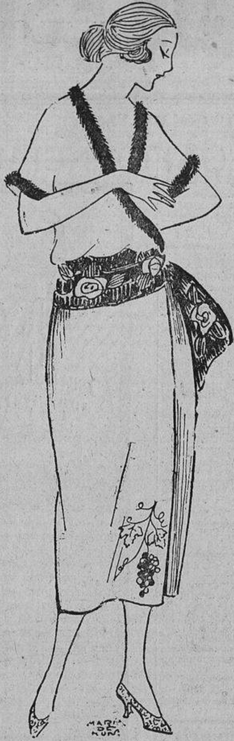
Sencilla y coquetona esta bata de grueso crêpon de lana bordada con piel, y sobre la cual puede ponerse, o un estrecho cinturón o una gran banda de fantasía.

Los egipcios lo divinizaron, los germanos lo tomaron como símbolo de la liber-