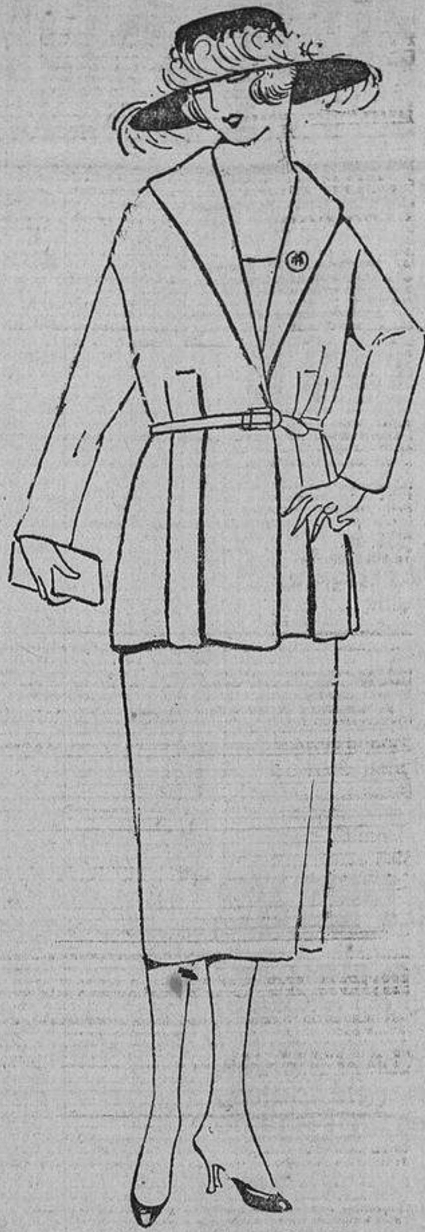
De lana esponjosa color cuerda, con dos faldas delante y dos detrás, cinturón de cuero escudito bordado, con las iniciales.