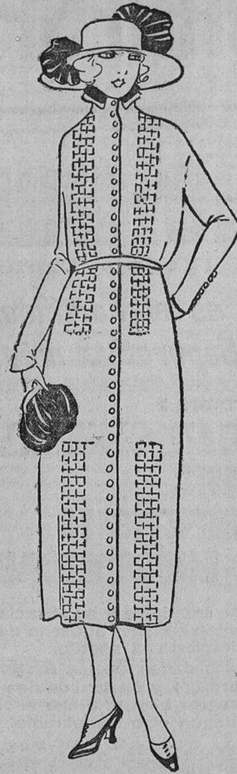
Sobre un traje azul marino, unos pespunte rojos formando un cuadrículado.

tad invencible, Mahoma lo puso en el paraíso, Platón ha hecho de él un adorno de la República.