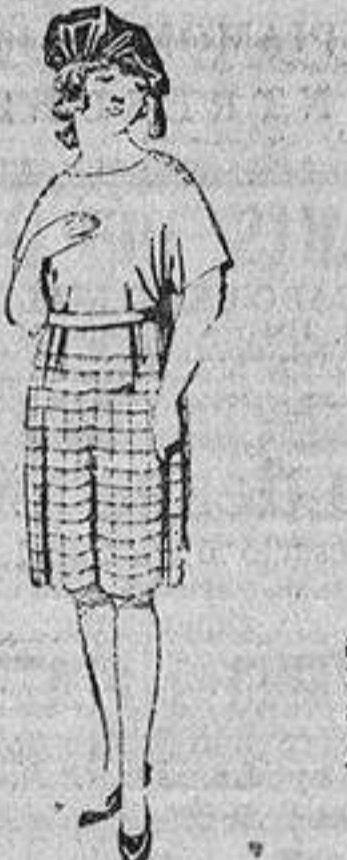
Vestidos de sarga inglesa, estambre, etc., en negro, azul y color, adornos punto. De ptas. 118 á 150.

Peletería, Camisería, Géneros de punto, Zapatería, Paraguas, Bastones, Guantería, Corbatería, Sombrería, y Artículos de viaje