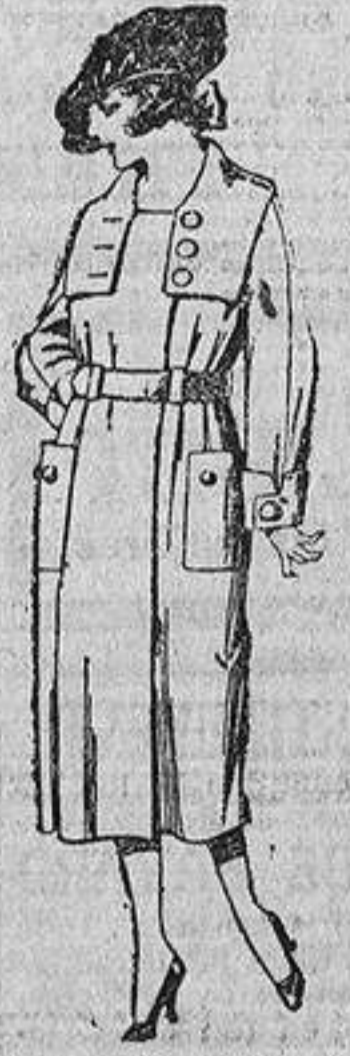
Abrigos de cheviot, ratina, pañeto, etc., en azul y color, para jovencitas de doce á quince años. De ptas. 38 á 60.