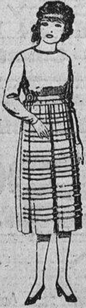
Vestidos de sarga inglesa, estambre, etc., en azul y color, para jovencitas de doce á quince años. De ptas. 52 á 80.