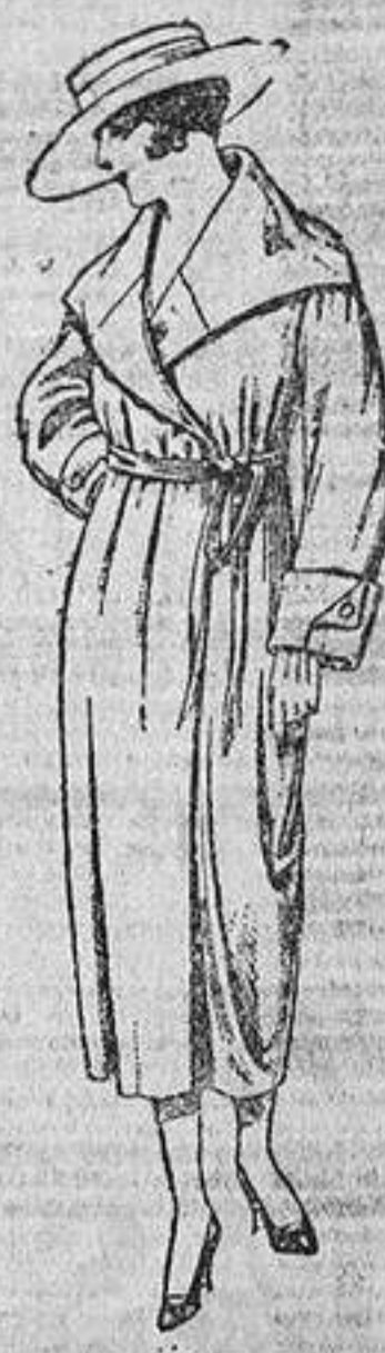
Abrigos de punto de lana, en negro, azul y color. De ptas. 55 á 160.