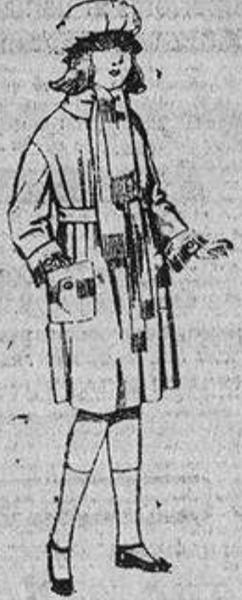
Abrigos de gamuza, pañeto, cheviot, etc., en azul y color, para niñas de cuatro á nueve años. De ptas. 36 á 50.

Ropas y artículos confeccionados para Caballero, Señora y Niños.