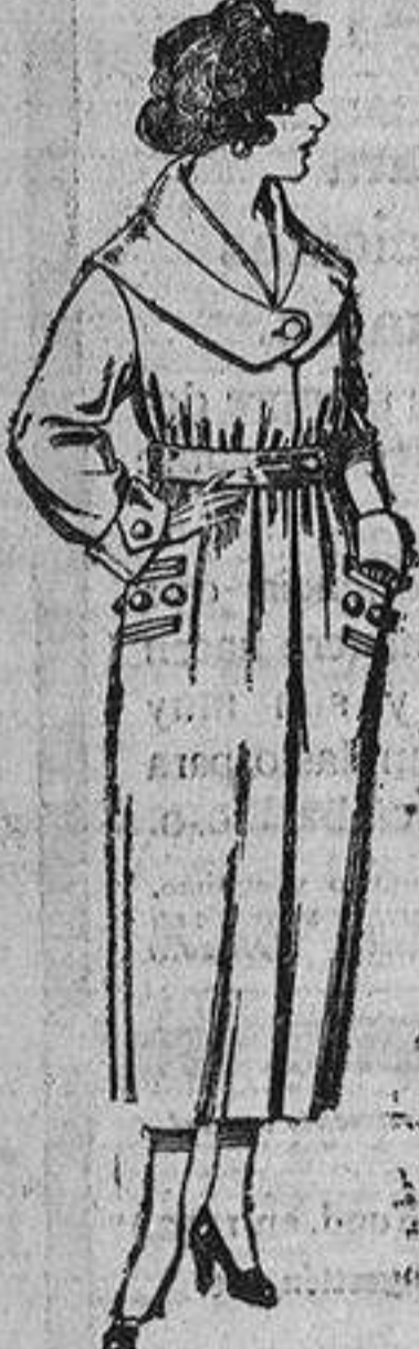
Abrigos de gamuza, pañeto, etc., en negro, azul y color. De ptas. 45 á 90.