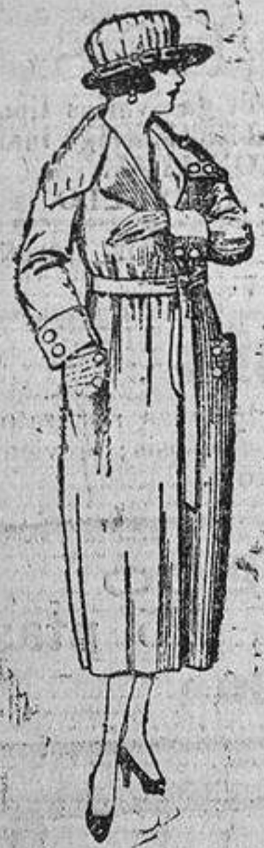
Abrigos de gamuza, pañeto, etc., en negro, azul y color. De ptas. 70 á 110.

Barcelona, Alicante, Almería, Bilbao, Cádiz, Cartagena, Gijón, Granada, Málaga, Palma de Mallorca, Santander, Sevilla, Valencia, Valladolid y Zaragoza.