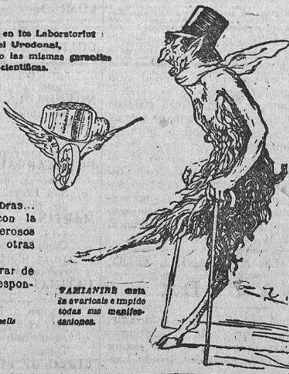
VAMIANINE cura la avariosis e impide todas sus manifestaciones.

Preparado en los Laboratorios del Urodonat, y presentando las mismas garantías científicas.