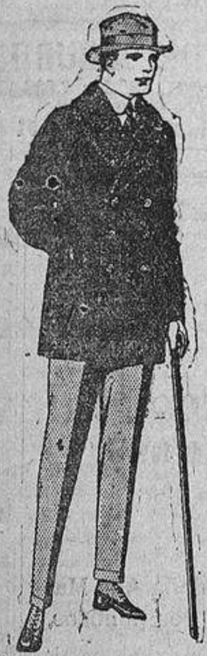
Pellicas de ratina, castor, etc., con cuello de astrakán, de