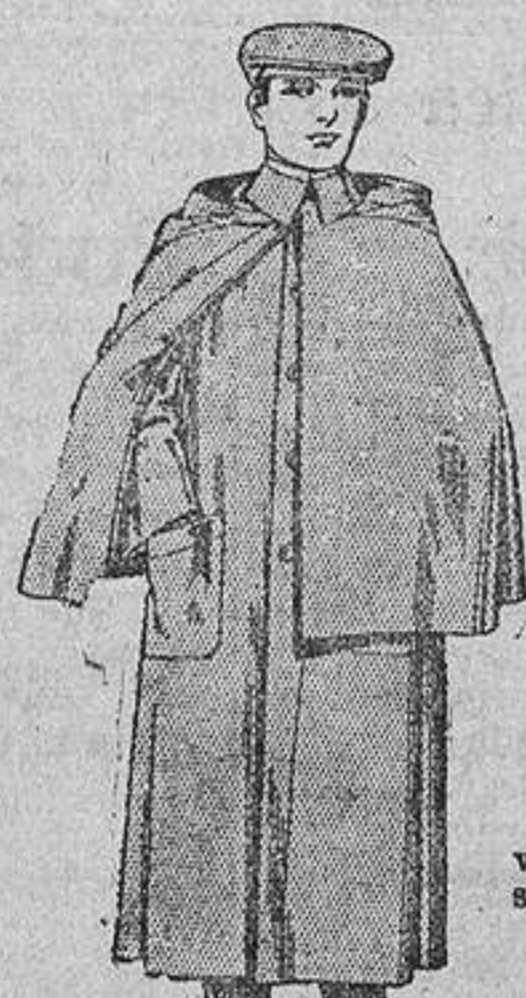
Gabanes de gamuza ó vigonia, con vistas de seda, de

Barcelona, Alicante, Almería, Cartagena, Bilbao, Cádiz, Gijón, Granada, Málaga, Palma de Mallorca, Santander, Sevilla, Valencia, Valladolid, Zaragoza.