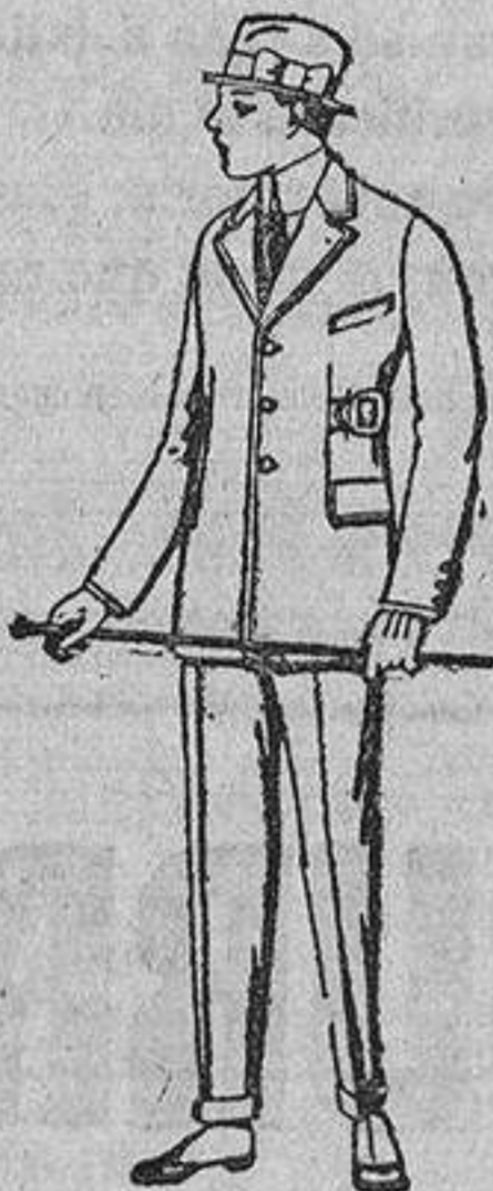
Impermeables mackferland, en negro y azul, de