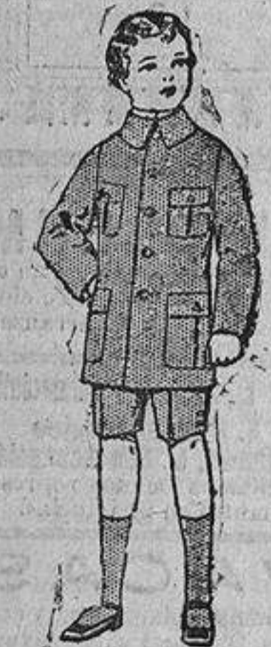
Trajes de patén, modelo sport, para niños de 4 á 9 años, de