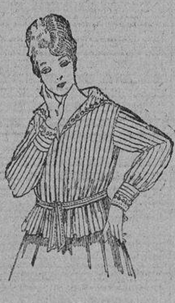
Blusa de voile listada, cuello organdina bordado, 4 ptas. 9.50