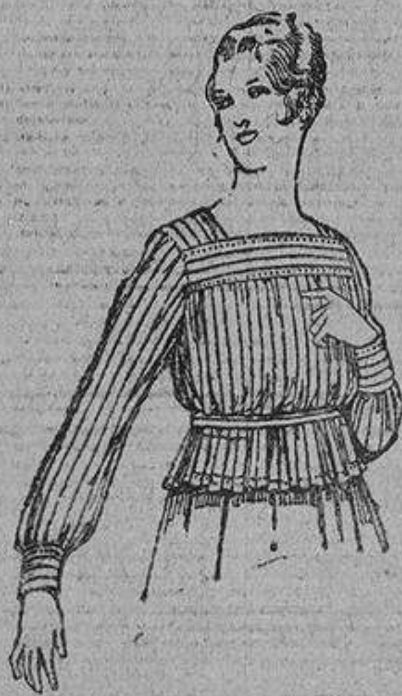
Blusa batista listada, 4 ptas. 4.50