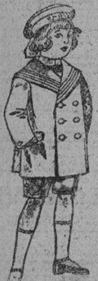
Trajes «matelote», de viñeta ó lana azul, para niños de 4 á 9 años, de pesetas... 14 á 32