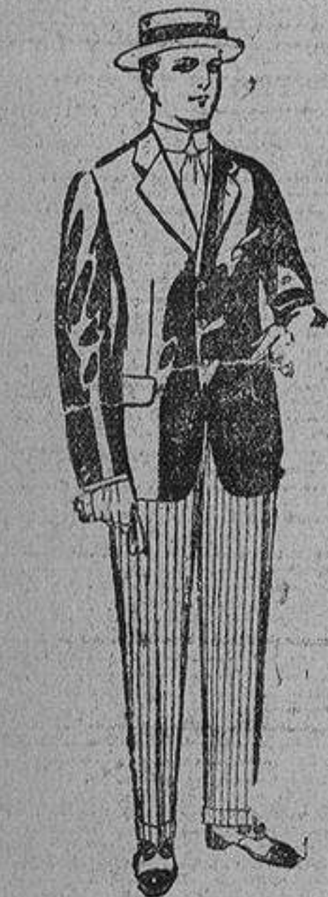
Trajes de alpaca negra, de pesetas... 32 á 55

Ropas confeccionadas para Caballero, Señora y Niños.