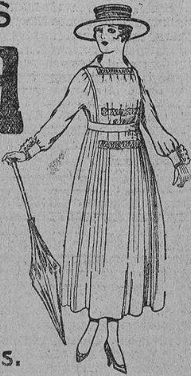
Vestidos de lanilla negros, azules y colores, de pesetas... 60 á 70