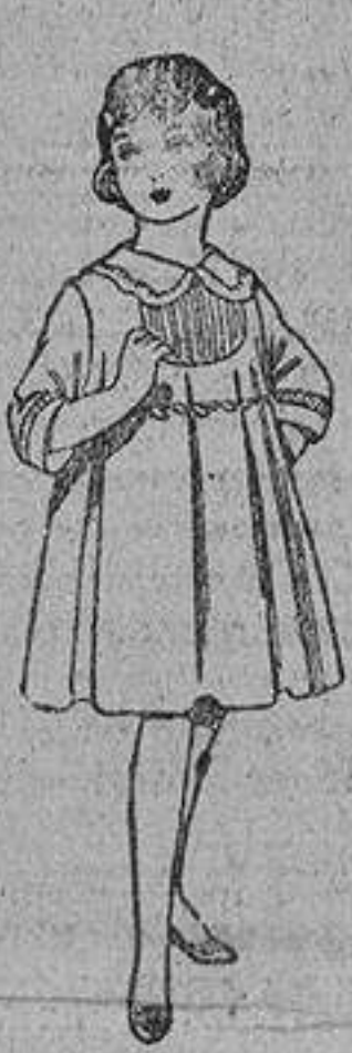
Vestido de lanilla azul, con bordados, para niñas de 4 á 9 años, de pesetas... 22 á 28

Camisería, Géneros de punto, Corbatería, Guantería, Zapatería, Sombrerería, Paraguas, Bastones y Artículos de Viaje.