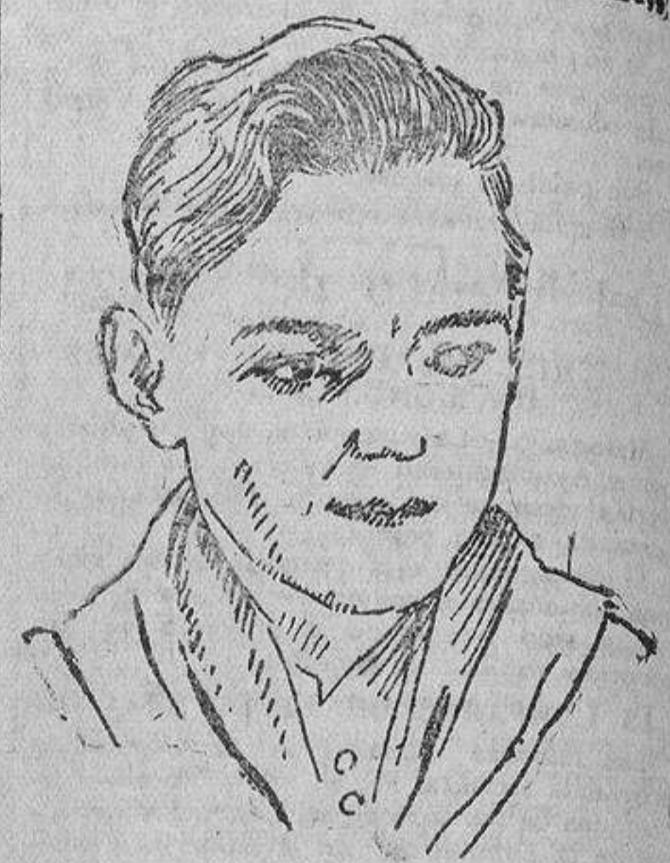
Buck Jones eminente actor dramático norteamericano