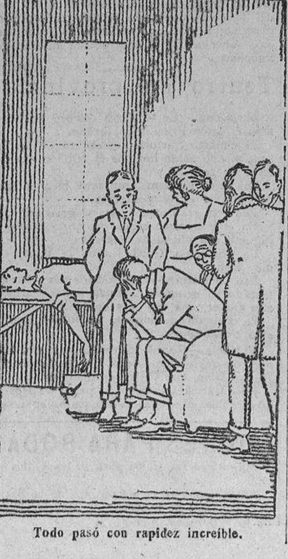
Todo pasó con rapidez increíble.

Un silencio helado siguió a aquella palabra. El joven estaba un poco pálido, pero decidido, sereno, imponente. —Señores... Me doy perfecta cuenta de la extraordinaria importancia de mi misión. En este momento, tan próximo a esa «muerte» que todos temen y que yo llamo, les voy a pedir su juramento de que nadie en el Mundo mas que nosotros ocho sabrá lo que ha sucedido aquí esta noche. Estamos solos en la quinta; para las autoridades, yo me he suicidado por un motivo sentimental, y cuando ustedes han advertido el hecho ya era inútil prestarme auxilio. De todo cuanto tengo, libros, aparatos, etc., mi padre hará entre ustedes el reparto que crea más conveniente, reservándose él lo que quiera. Y ahora, señores, despedámonos hasta la otra vida. No abandonen jamás a mi padre. Uno por uno, Jack fué abrazando a todos los sabios. Mr. Harry Tyvlild escribió: «El pequeño Greenwood acaba de despedirse definitivamente de mí. Es un sér admirable. Son las dos y siete.» Tras abrazar a su padre, que por un prodigioso esfuerzo de voluntad no lloraba, Jack se tendió sobre la colchoneta y le dijo a Kraemer: —Vamos allá. Kraemer abre a Jack la puerta de lo desconocido. Todos rodearon la mesa; fué un momento angustioso. El alemán Kraemer—¡sólo él habría