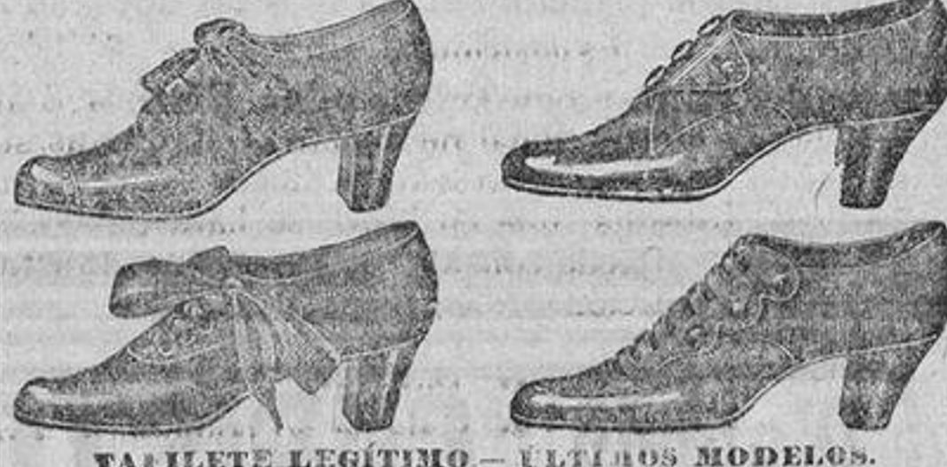
VARIETE LEGÍTIMO—ÚLTIMOS MODELOS. Espoz y Mina, 20, VIGO, y Romonones, 16, tienda.

Gran depósito de específicos nacionales y extranjeros ESPECIALIDAD EN JARABES MEDICINALES inalterables y de pureza bien acreditada