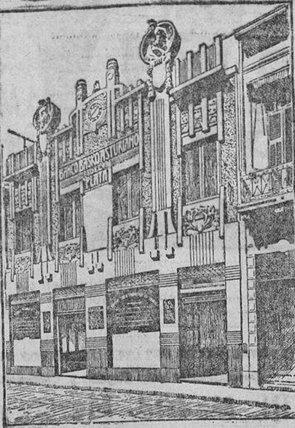
EDIFICIO DEL BANCO

Los grandes Mercados del Plata consumen anualmente del Extranjero productos por valor de 500 millones de pesos oro, y de España sólo 14.