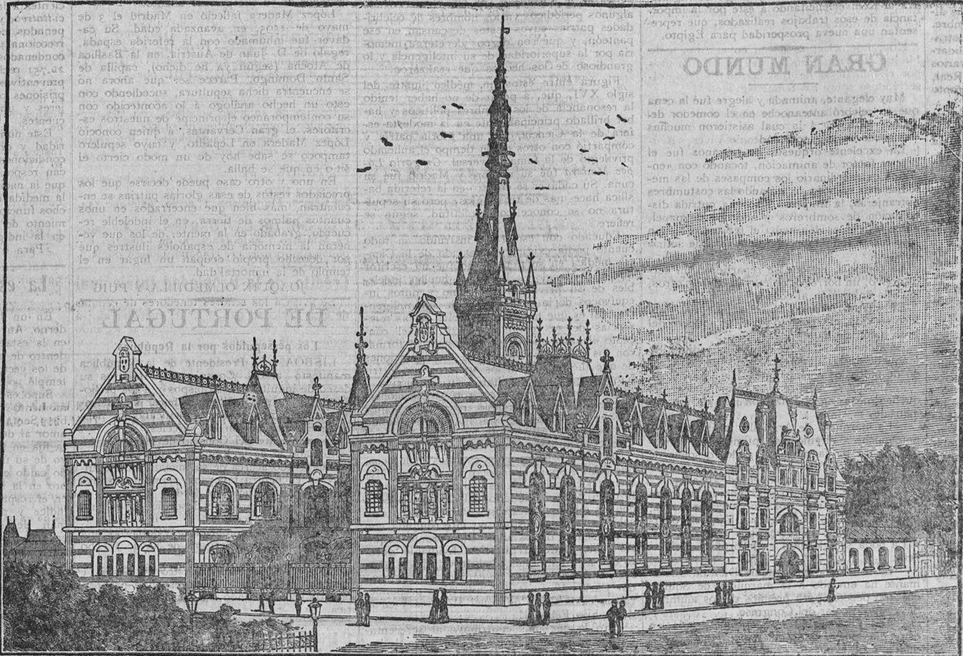
La fábrica del Licor BENEDICTINE ocupa una superficie de 10,000 metros cuadrados, hace trabajar 350 obreros en Fécamp y produce cerca de 2.000,000 de botellas al año.

El Licor BENEDICTINE se usó en muchas ocasiones y con la mayor eficacia contra las enfermedades epidémicas; así es que tiene su sitio indicado en el hogar de cada familia.