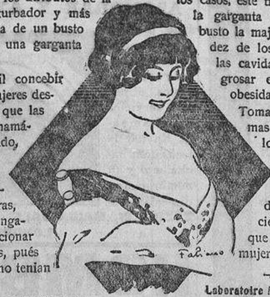
Laboratoire Médical, 16, Rue Clauvau, PARIS

Tomada en obleas minúsculas, no mas gruesas que una píldora, lo que permite seguir el tratamiento con suma facilidad, la GALÉGINE DE NUBIA constituye verdaderamente el único producto científico, eficaz y sin peligro que se debe recomendar á las mujeres y á las niñas.