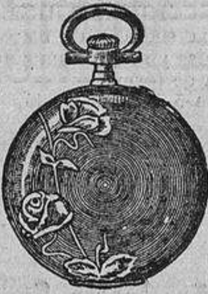
N.º 3. Las Rosas