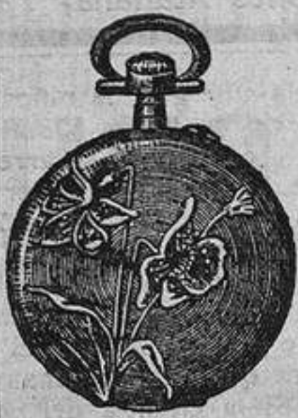
N.º 1. Los Narcisos