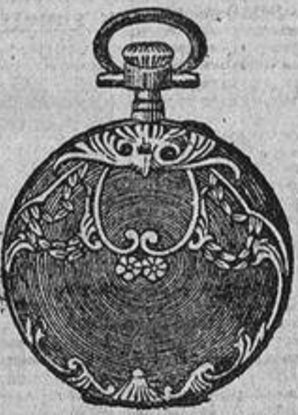
N.º 4. Luis XV