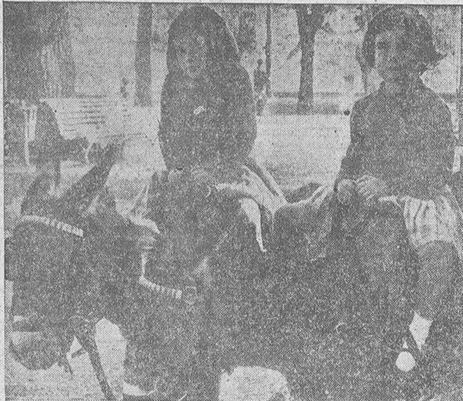
Roma.—Isotta e Isabel, las gemelas Rosellini, que han quedado solas en Roma, después de la ruptura de sus padres, Ingrid Bergmann y Roberto Rosellini. La famosa actriz sueca, como sabrán los lectores, acaba de obtener la separación de su esposo.

Serán las cuestiones que EE. UU. llevará a las reuniones de la «Nato»