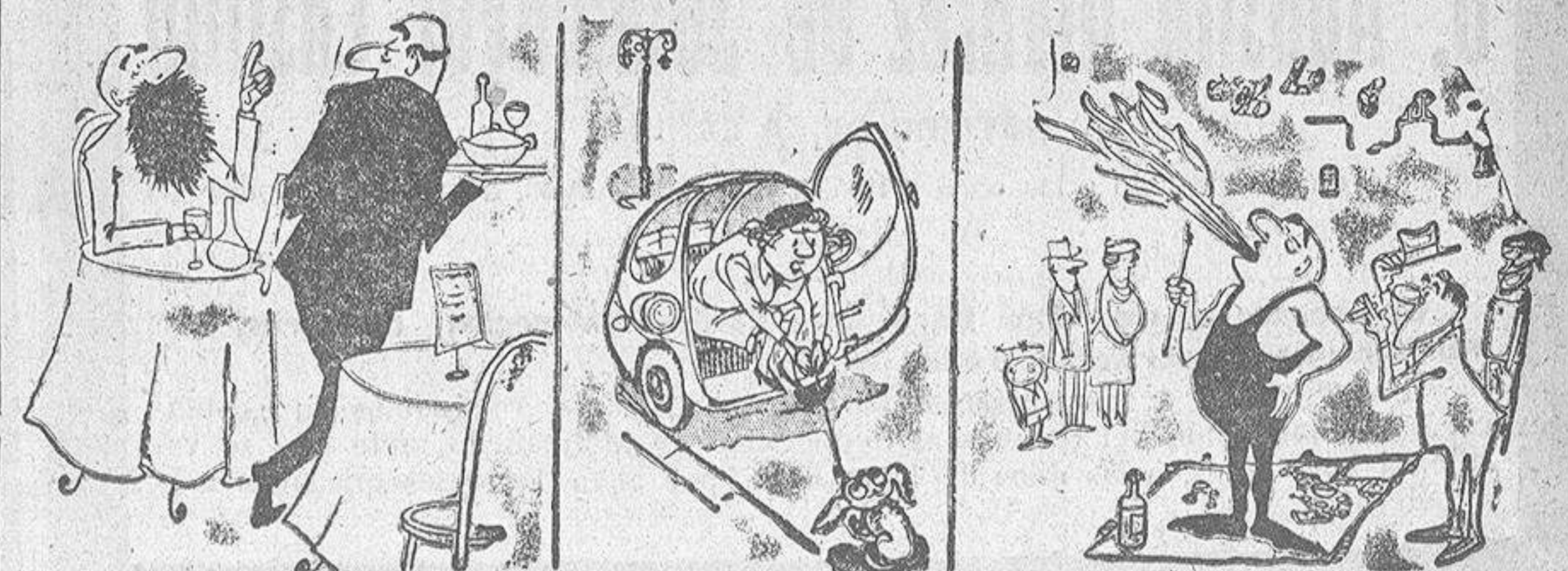
--Camarero: ¡Caldo gallego y una pala! --Sube, bobo, que no se trata de un "Spatski". --Un poco de luz, por favor.