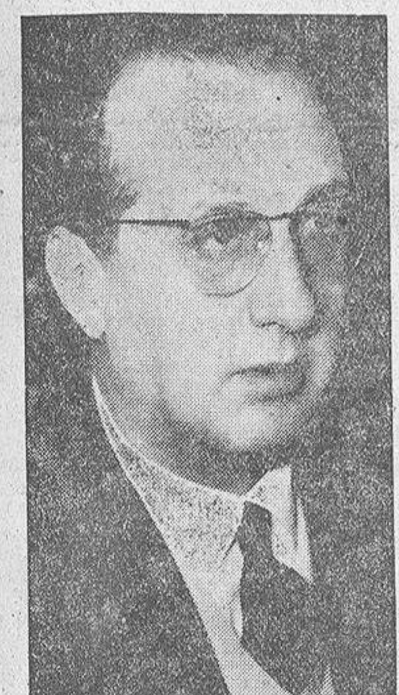
Excmo. Sr. D. Gabriel Arias Salgado, ministro de Información y Turismo

Autoridades y jerarquías, amigos y camaradas: Nuevamente me cabe el honor de