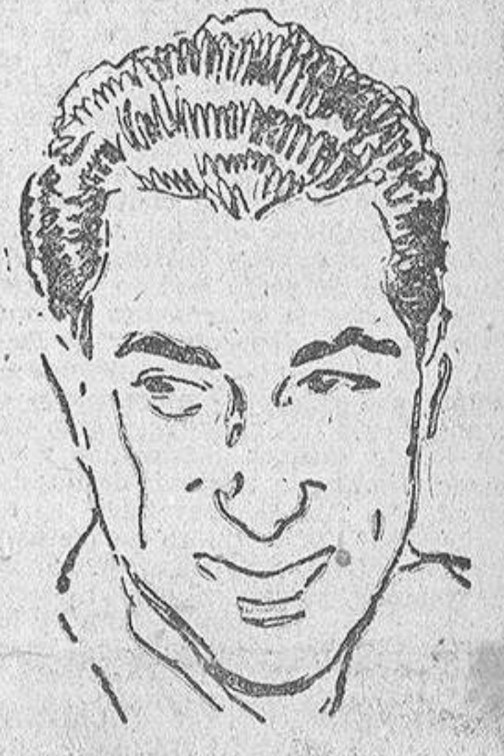
MARQUES DE PORTAGO

EL CAIRO, 12.—En círculos gubernamentales se afirma que "Egipto e Inglaterra realizan conversaciones no oficiales para preparar el terreno en pro de la reanudación de relaciones comerciales entre los dos países". Estas relaciones quedaron interrumpidas a raíz de la suspensión de relaciones diplomáticas provocada por la intervención militar anglo-francesa en Egipto, en el pasado mes de noviembre.—(EFE)