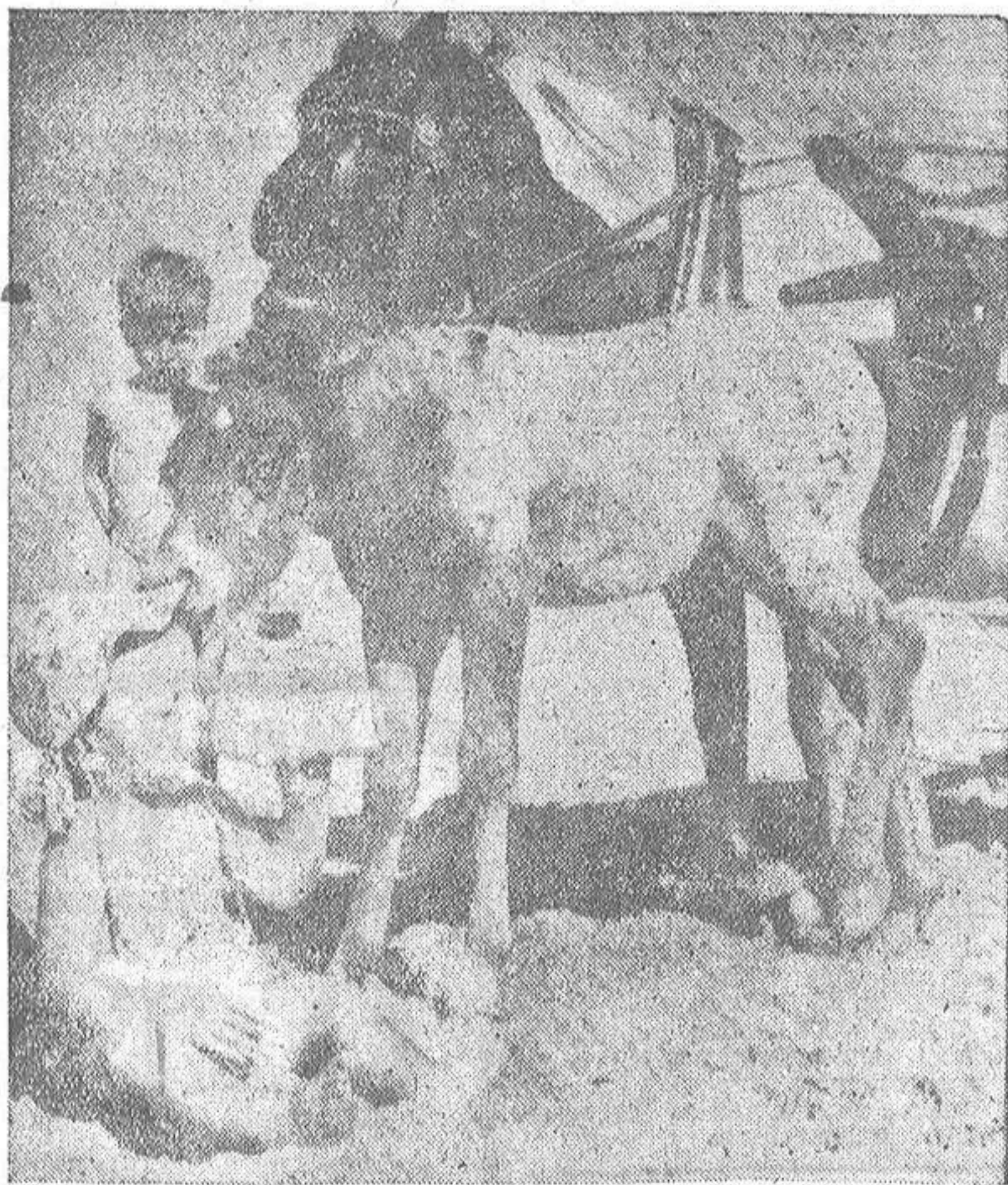
La brisa marina ha sido siempre buena aliada del apetito en la infancia; por ello ese pequeño empuja el codo, impasible a la proximidad del envidioso pottillo, que pide participación, en forma poco diplomática. Y es que cada vez van siendo menores las diferencias sociales.