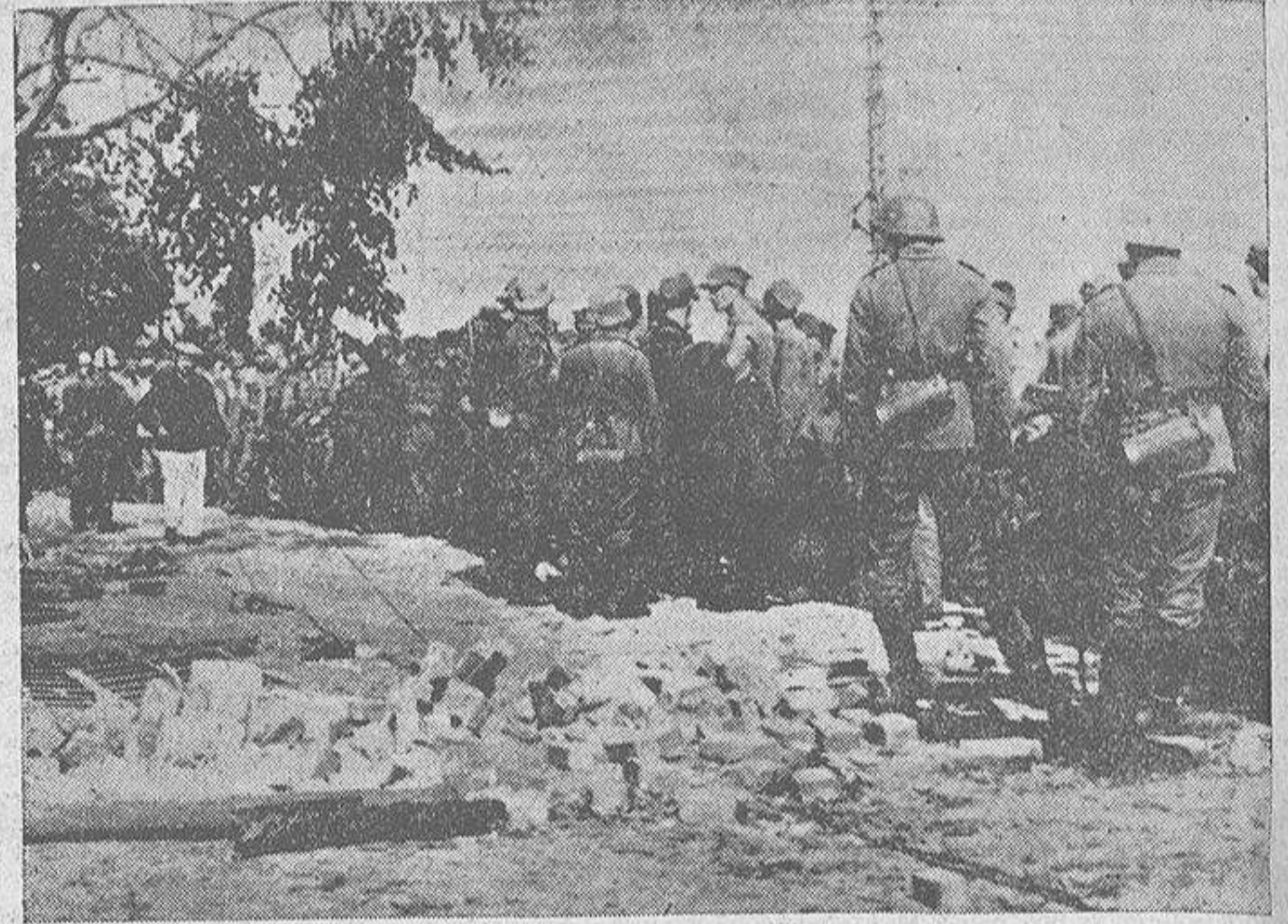
Prisioneros polacos en los campos de concentración establecidos en el interior de Alemania