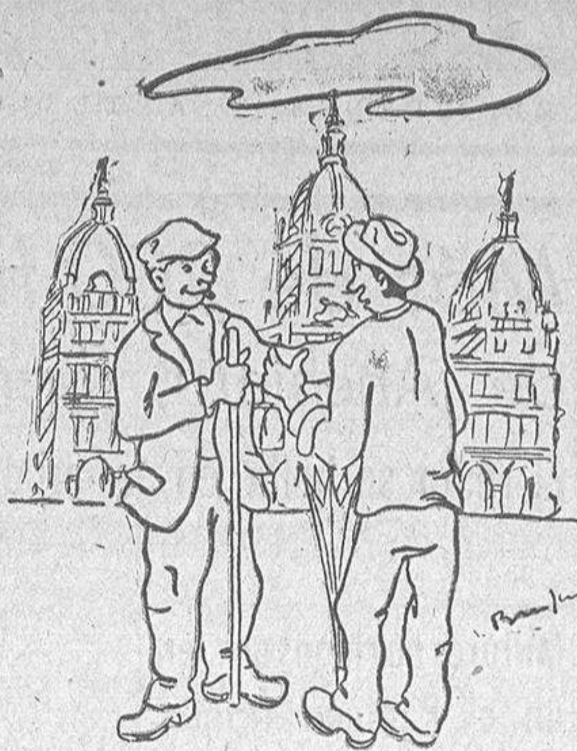
—¿E que van facer elqui? —Pouco. Xa s'estrenou. —Porque xa patinaron os concexales.