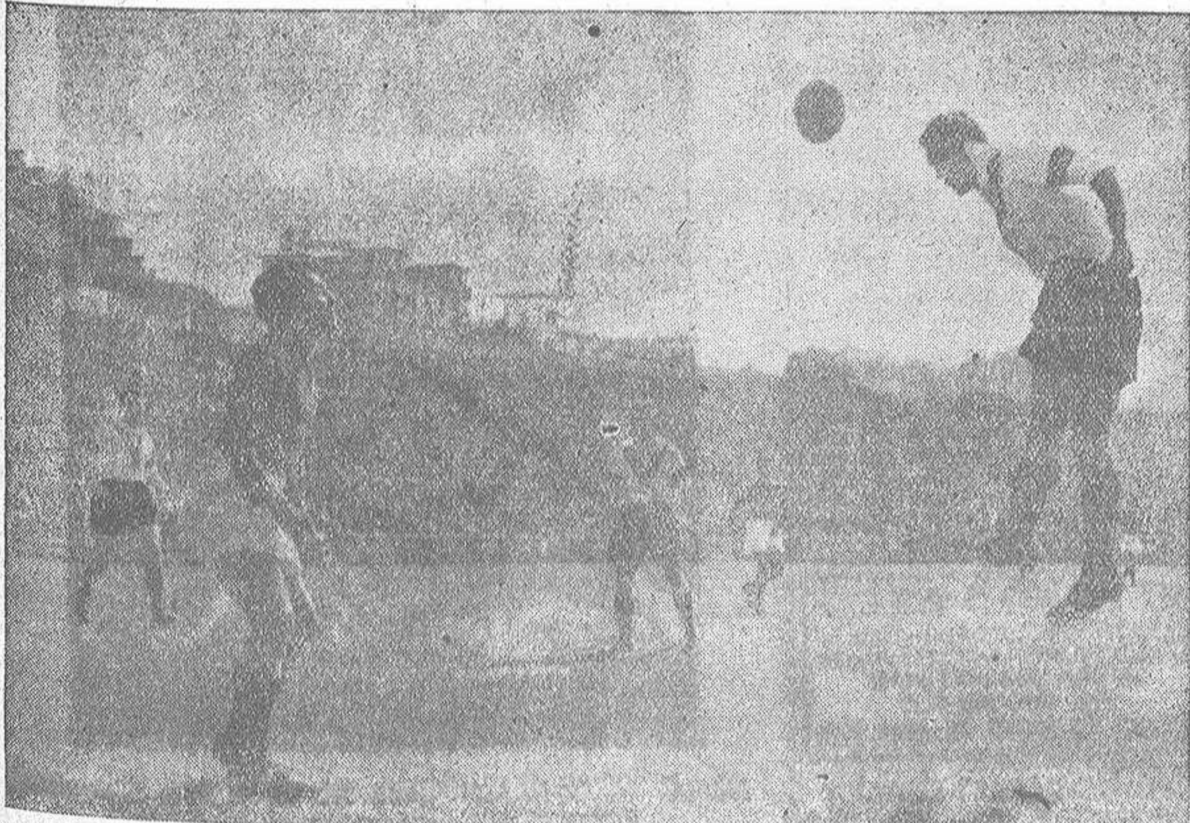
El remate oportunísimo y certero del interior francés Sesia, llegó hasta la red valenciana, cuando todavía no habían dos minutos de juego. Fué un saludable aviso para las huestes de Quincoces.