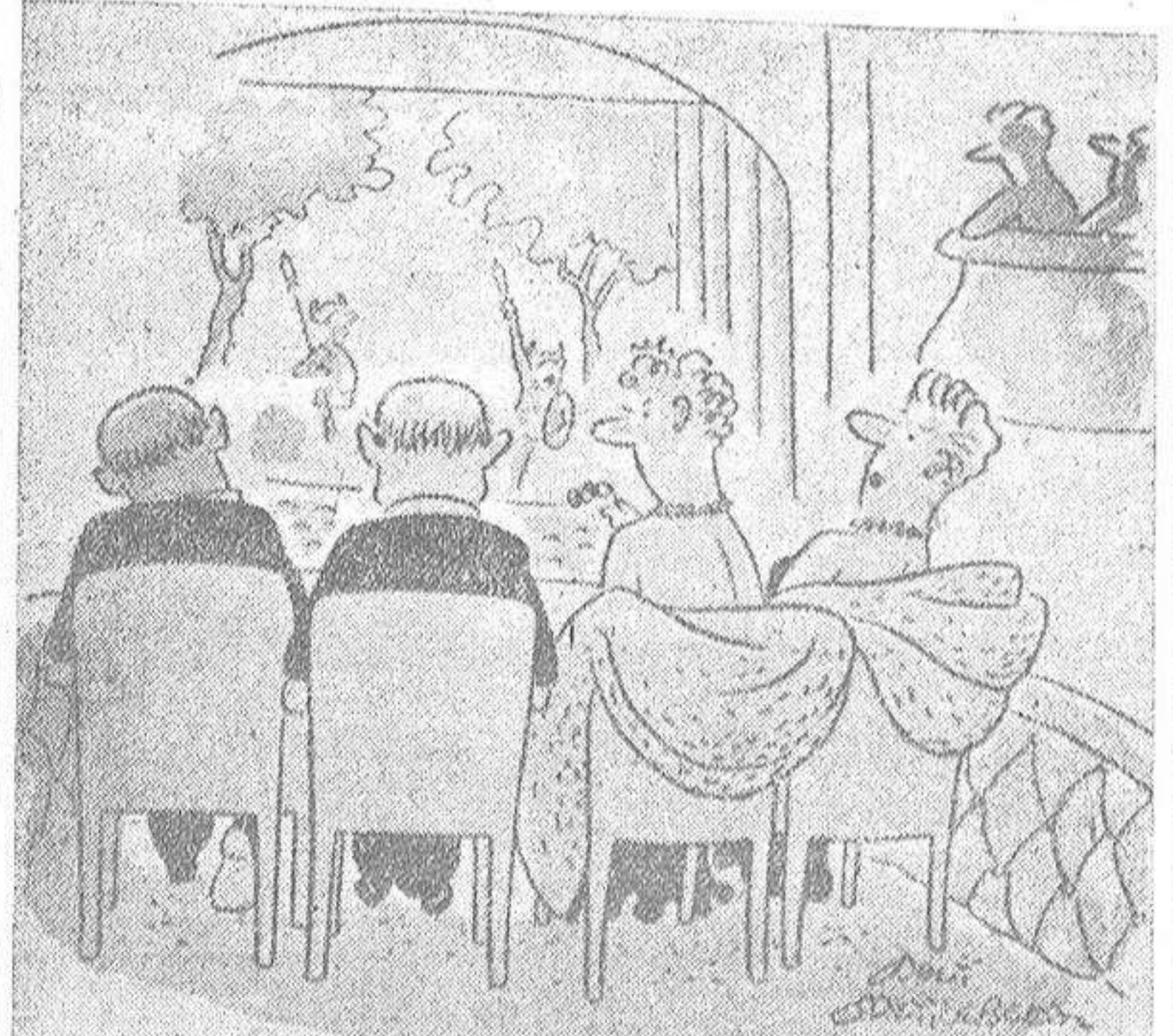
—Pepe también está dormido; sólo que tiene cuello duro.