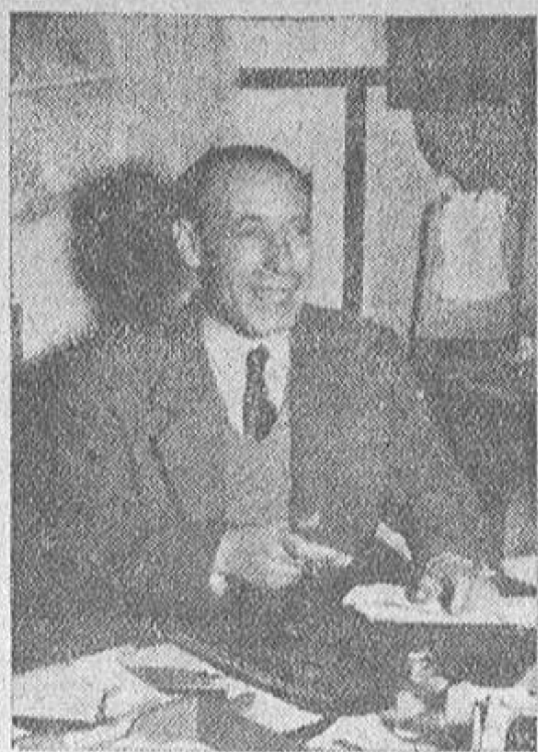
Después de un día de Alcalde me invitarían a quedar en el Ayuntamiento