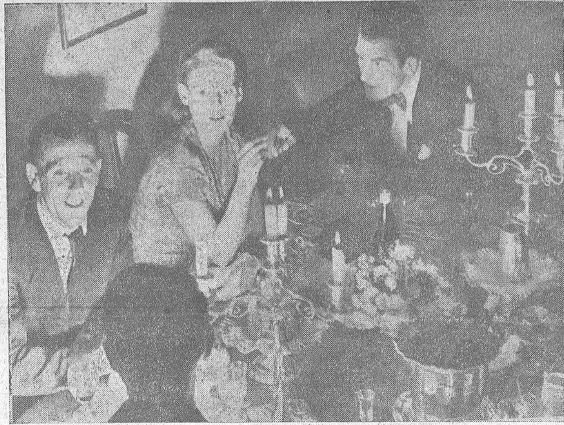
Una dramática cita en un restaurante de Londres: tres asesinos condenados a la horca, indultados en el último momento y libres, ya después de haber pasado cierto número de años en la cárcel, se reúnen a comer invitados por un psiquiatra—que es el cuarto comensal, de espaldas al fotógrafo—para contar sus impresiones, sus sufrimientos y la nueva vida que han emprendido al reincorporarse a la sociedad