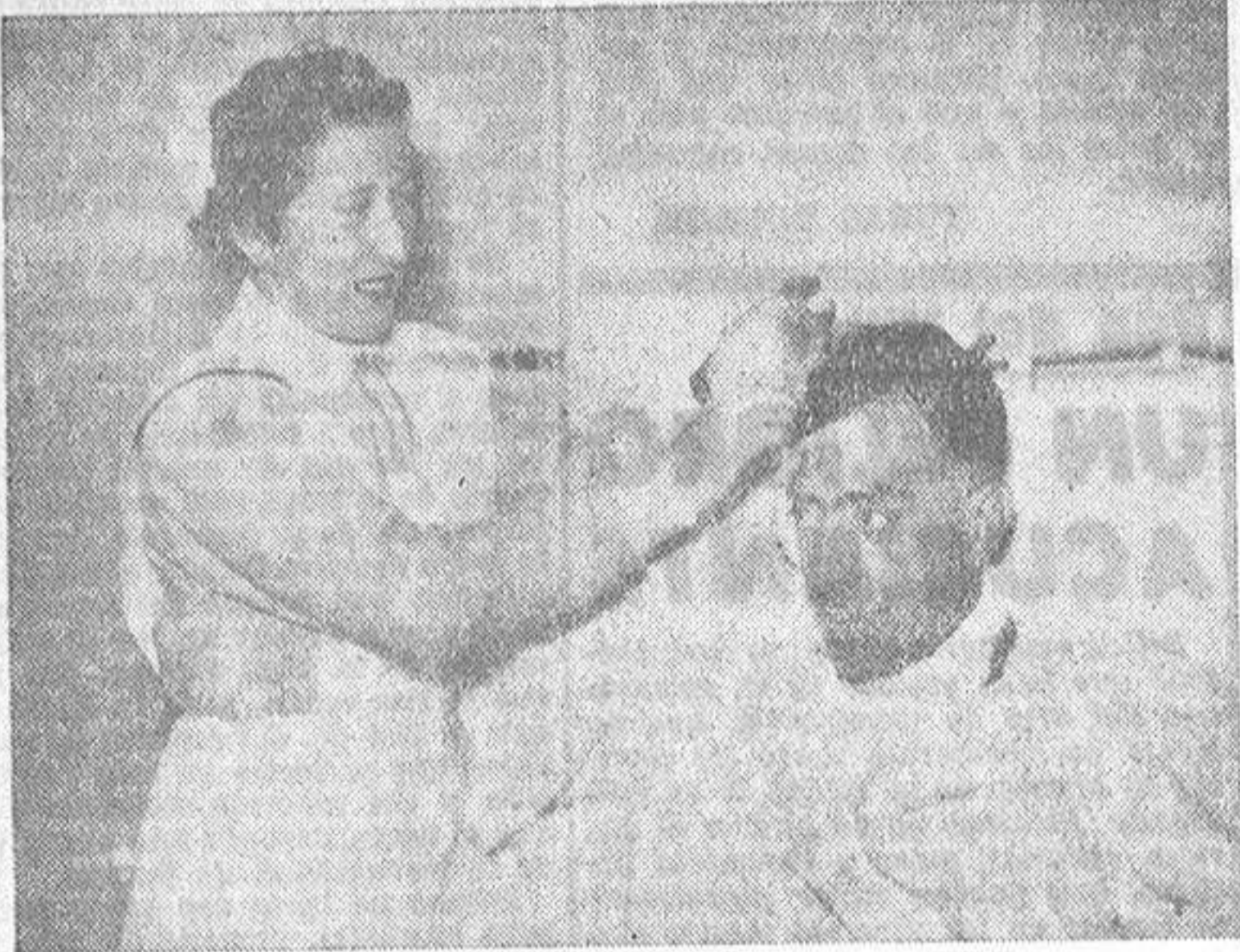
Otro enfermo que cuatro días antes de posar para el fotógrafo sufrió, a causa de un cáncer, la extirpación total de la laringe. Alimentado por sonda los primeros días, ya sin fiebre siquiera, poco después comerá normalmente. Dentro de dos meses contará con su propia voz —nueva voz esofágica— lo bien que le fué en la Residencia

da. El cirujano coruñés del Seguro de Enfermedad descubrió el verdadero valor de su sutura. Un hombre puede sufrir la extirpación total de la laringe, alimentarse por vía normal cuatro días después y hablar sin aparato alguno al mes y medio. Y eso en La Coruña, en la Residencia del Seguro de Enfermedad, por obra y gracia del especialista en Otorrinolaringología. No se crea usted que hace falta ir a Nueva York para ver estas cosas.