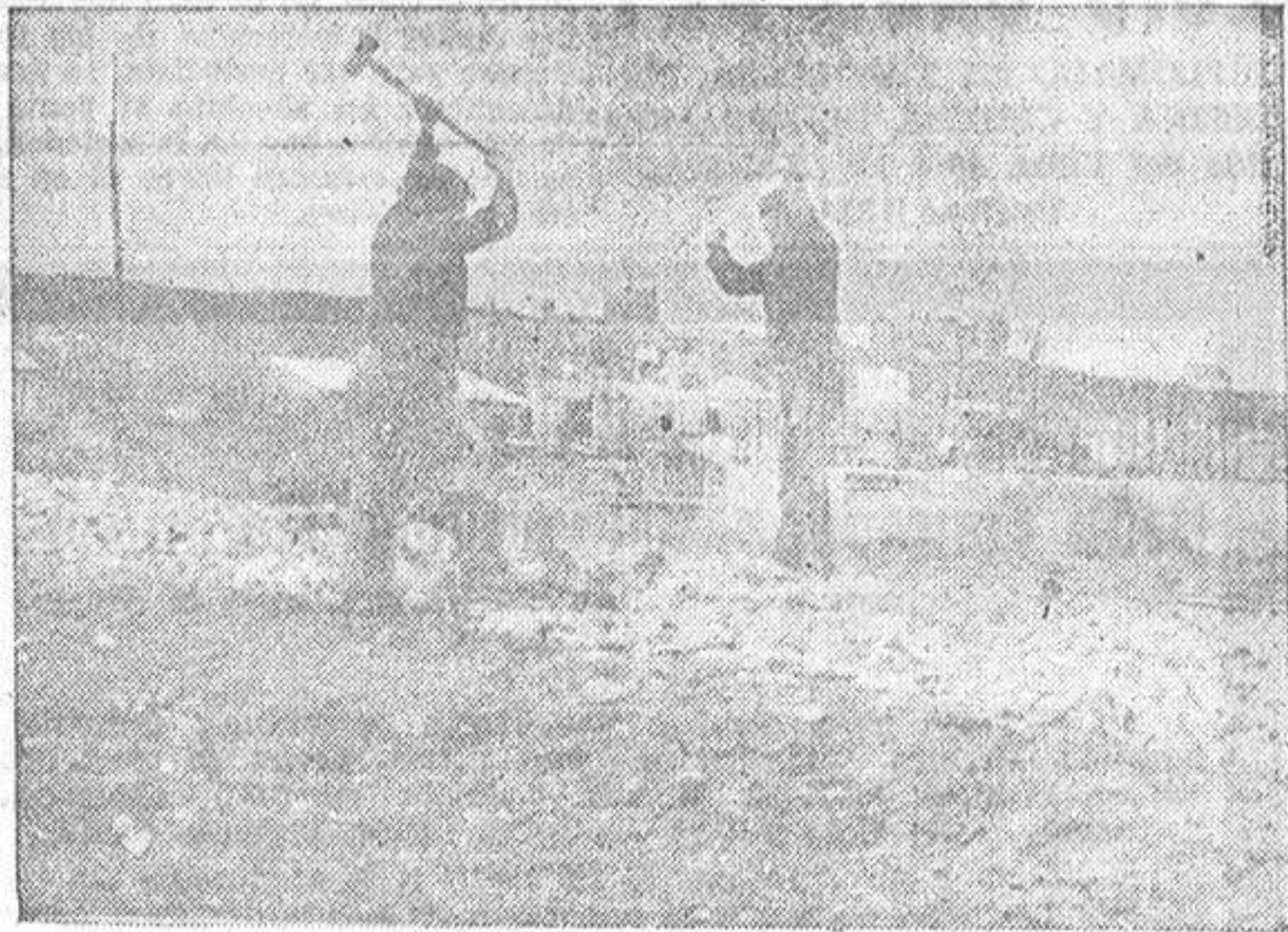
que unirá al matadero industria en el trazado del enlace ferroviario. He aquí a dos obreros trabajando con la estación de la RENFE

He aquí, trazado en un rápido reportaje, una de las mejoras con la que Lugo ha de contar en plazo breve y que le ayudarán a elevar su nivel económico e industrial. Algo de lo que Lugo ya se siente orgullosa y que vendrá a favorecer el desenvolvimiento de la cabaña y la mano de obra no solamente lucense, sino de Galicia toda, puesto que, por la gran magnitud de su capacidad, su influencia se irradiará hasta los más apartados rincones de nuestro agro e industria regionales.