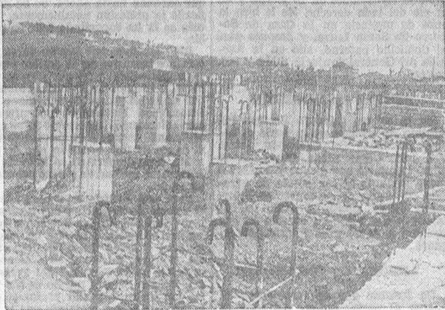
Ciento sesenta mil metros cúbicos de tierra, en una superficie de 18 hectáreas, han sido removidos para la construcción del Matadero Industrial de Lugo

Albairos es un barrio casi rural enclavado en los alrededores de la ciudad. A unos cuatrocientos metros de