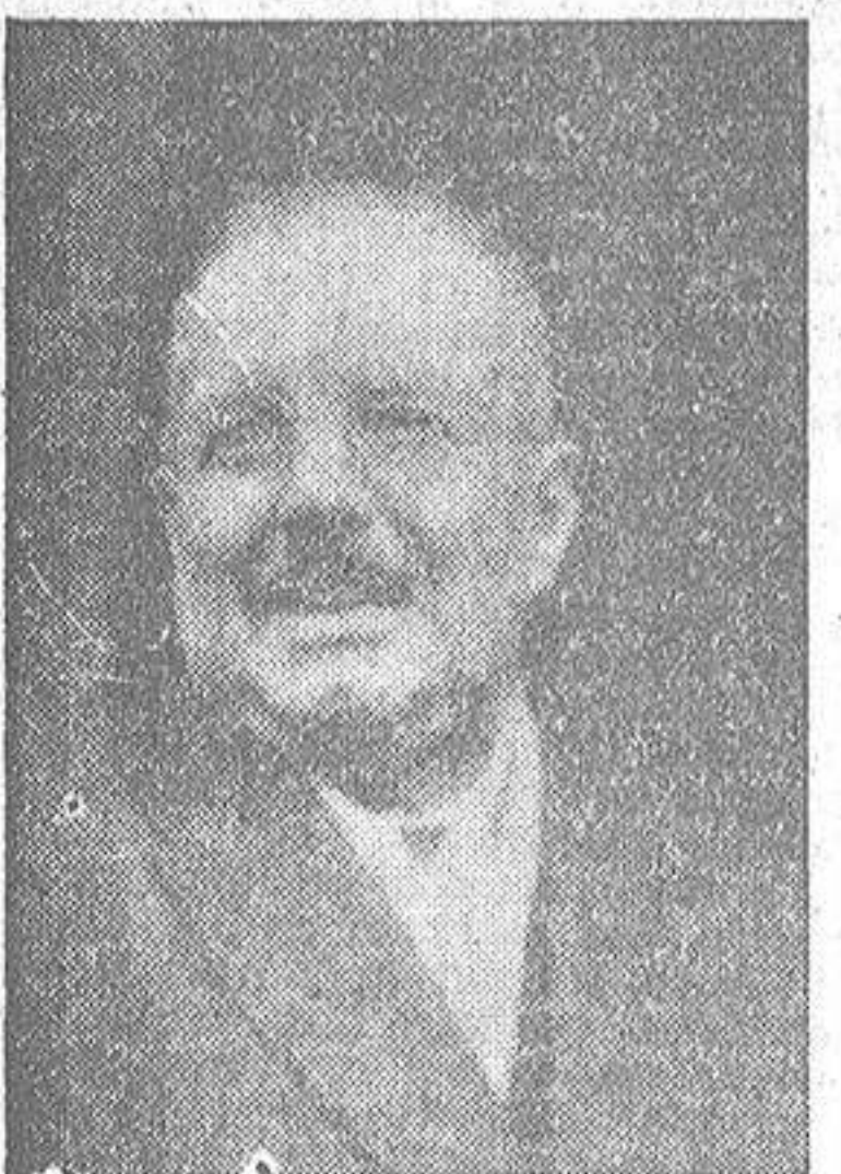
Carlos Ibáñez, Presidente chileno

SANTIAGO DE CHILE, 22.—Los presidentes de Argentina y de Chile firmaron anoche un acuerdo que servirá de base para una unión económica entre sus respectivos países, que entrará en vigor antes de transcurridos cuatro meses.