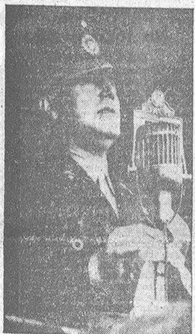
General Perón, Presidente argentino

Los firmantes desean que otras naciones vecinas se sumen a la unión