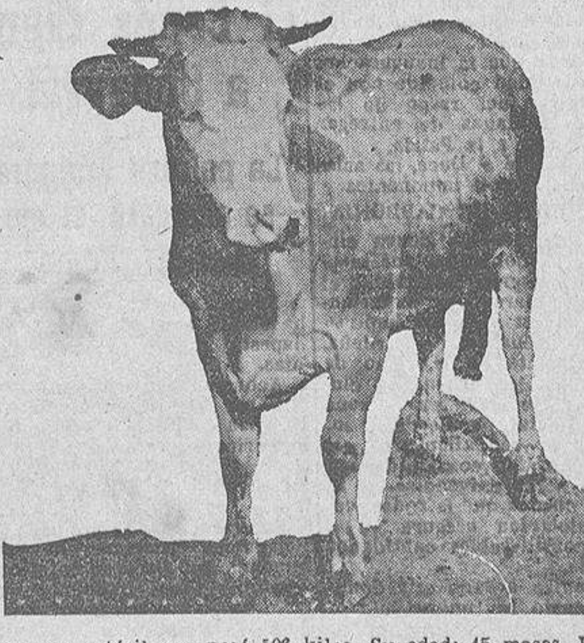
Ternera estéril que pesó 506 kilos. Su edad: 15 meses. Este es el tipo que debe buscarse y mejorarse, procurando que la selección y alimentación adecuada conviertan en normales los casos de precocidad