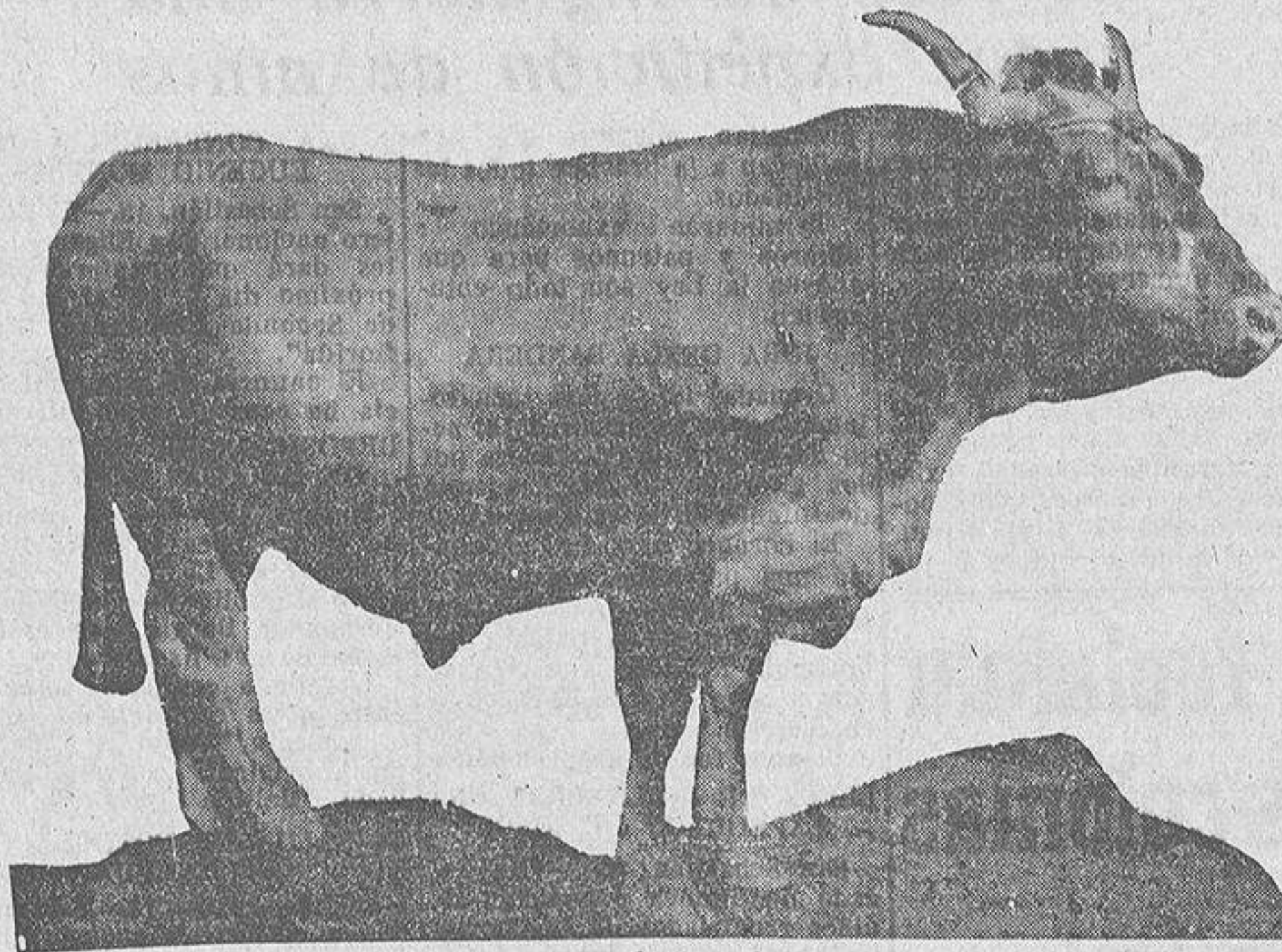
Buey de la comarca de Bergantiños. De 5 a 6 años de edad. Pesó 850 kilos. Algunos alcanzan la tonelada. Próximos estudios demostrarán si es o no remunerador la cría y engorde hasta límites tan altos

pinos o los eucaliptos, patatas en los cuales las enfermedades de este tubérculo y el abandono por no cambiar la semilla reducen esa cosecha a proporciones exiguas, etc. Galicia tiene su riqueza en los prados y en los pastos. Por su clima, por su tierra, como Santander, que ha entendido mucho mejor su economía. Habrá menos variedad en el paisaje, más monotonía en los colores, pero se producirá mucha más riqueza para la Patria, y se la hará más independiente, al no tener que depender del extranjero en una porción de productos por los que hasta ahora tuvo que rendir vasallaje obligado. No se olvide usted que una gran fuente de consumo de nuestro ganado y de nuestros productos está en Africa del Norte, cada vez más española. En esta región antes se importaban seis o siete millones de España y noventa del extranjero y ahora sucede todo lo contrario.