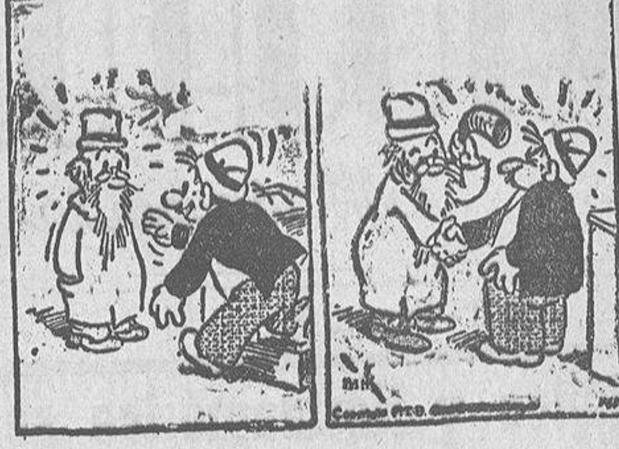
Un discurso infeliz.