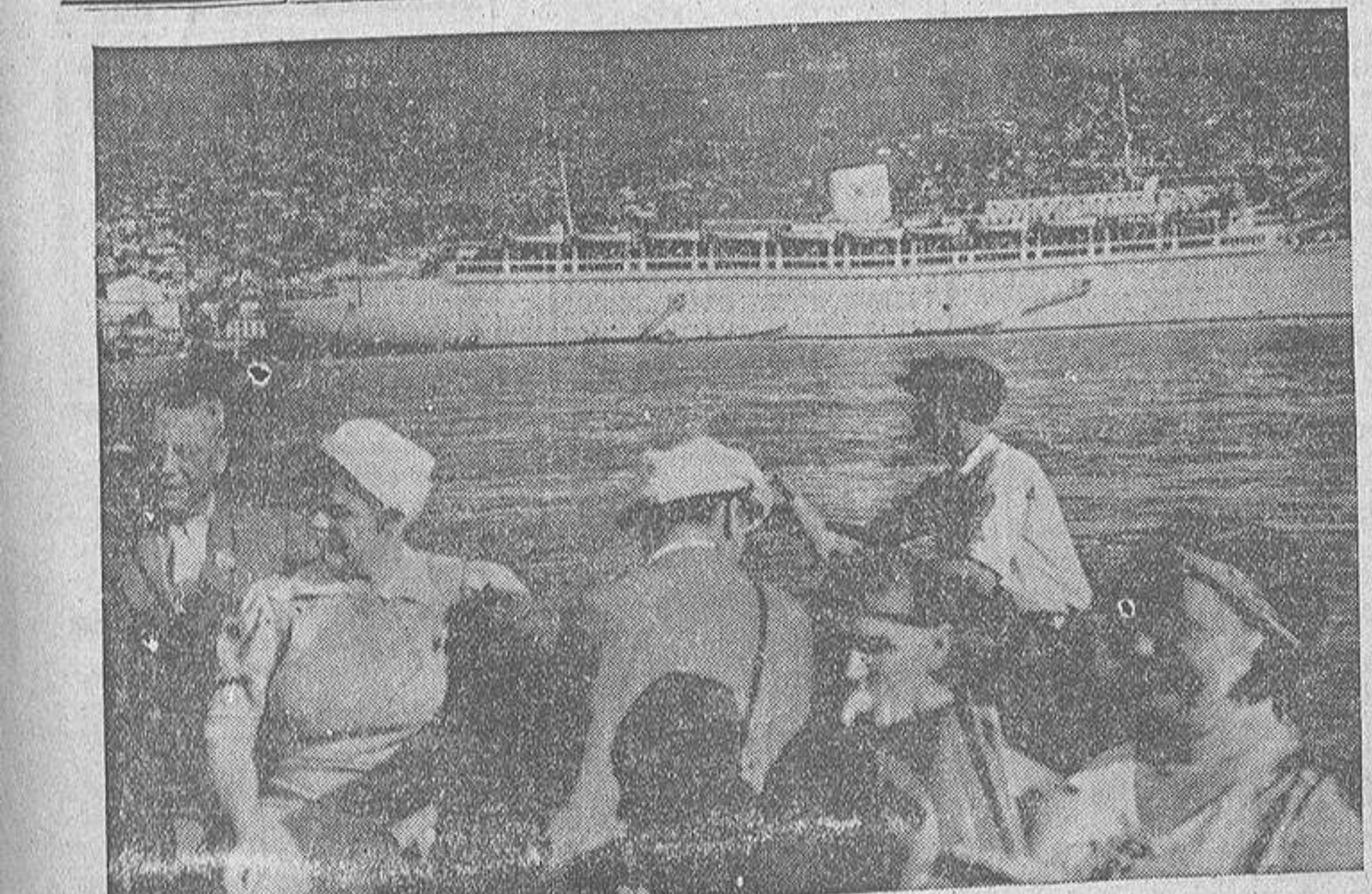
LOS VIAJES DE LA ORGANIZACION "FUERZA Y ALEGRIA" — El gran buque alemán "Wilhelm Gustloff" fondeando en el puerto de Madeira. Más de mil empleados y obreros pasan sus vacaciones a bordo del mencionado barco, construido precisamente para tales viajes de recreo.

Pidamos a Dios luces para nuestros gobernantes. En esa información que se publica hoy en otro lugar de este número, pueden encontrar todos, orientaciones sanas, saludables. De que sean recogidas con amor y eficacia, depende el porvenir del campo y como consecuencia, el de la ciudad. He ahí un buen programa rural de Gobierno. La producción en una sola mano: el Estado, y todos los demás elementos de ese Estado, para colaborar con él y devolverle todos sus ciudadanos y sus atenciones, produciendo siempre, progresando, multiplicando las riquezas de la madre tierra, vivero fecundo de bienes espirituales y materiales dentro de la Patria amada.