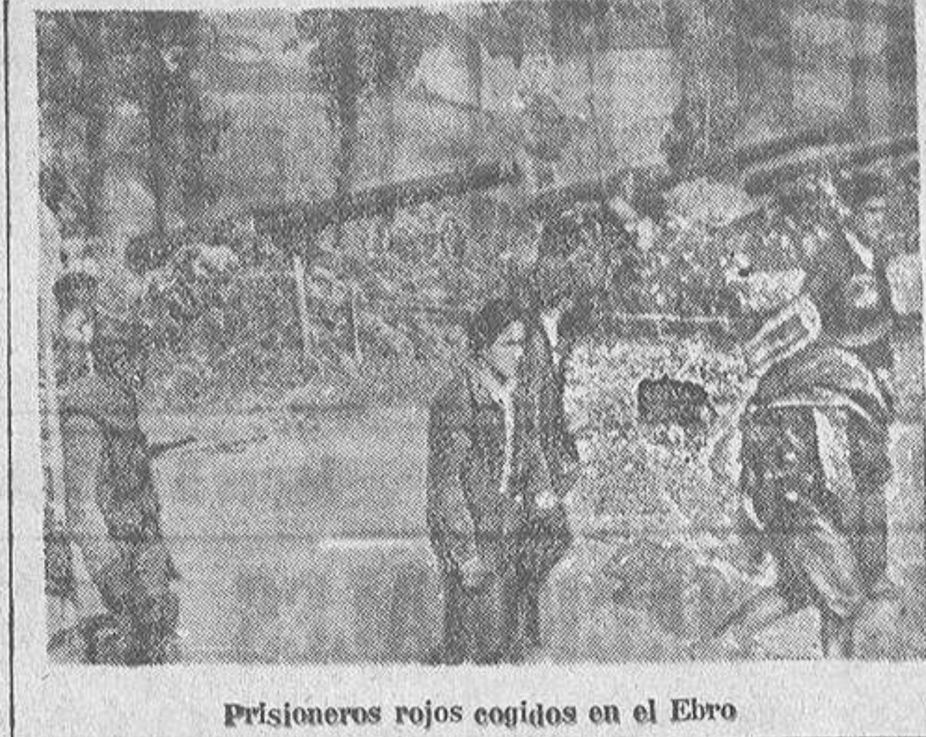
Prisioneros rojos cogidos en el Ebro