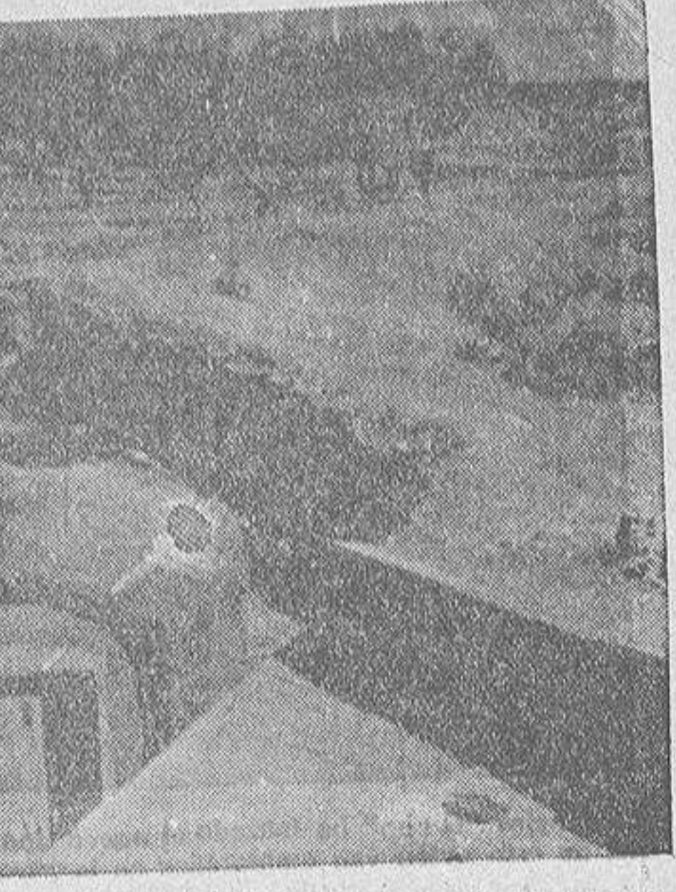
Trincheras construidas afanosamente por los rojos en cumplimiento de la consigna "resistir, resistir, resistir" y que han caído en poder de nuestras tropas