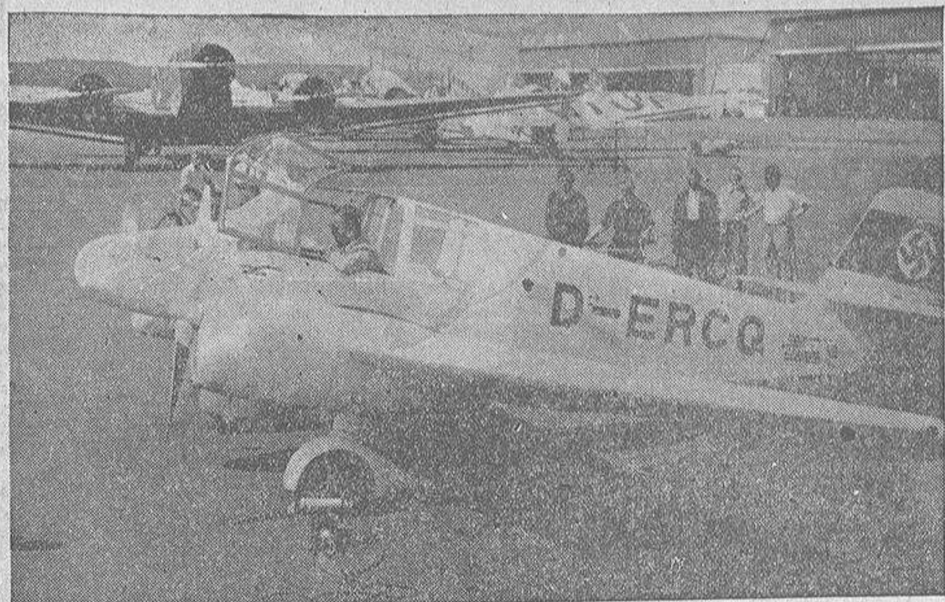
La fábrica "Gotha" ha lanzado el nuevo tipo de avión "Go 150" para el turismo. Los dos motores de este avión van emplazados en la parte baja de las alas. El consumo de este avión es de 12 litros de gasolina por 100 kilómetros. Su precio no es superior al de un automóvil corriente.