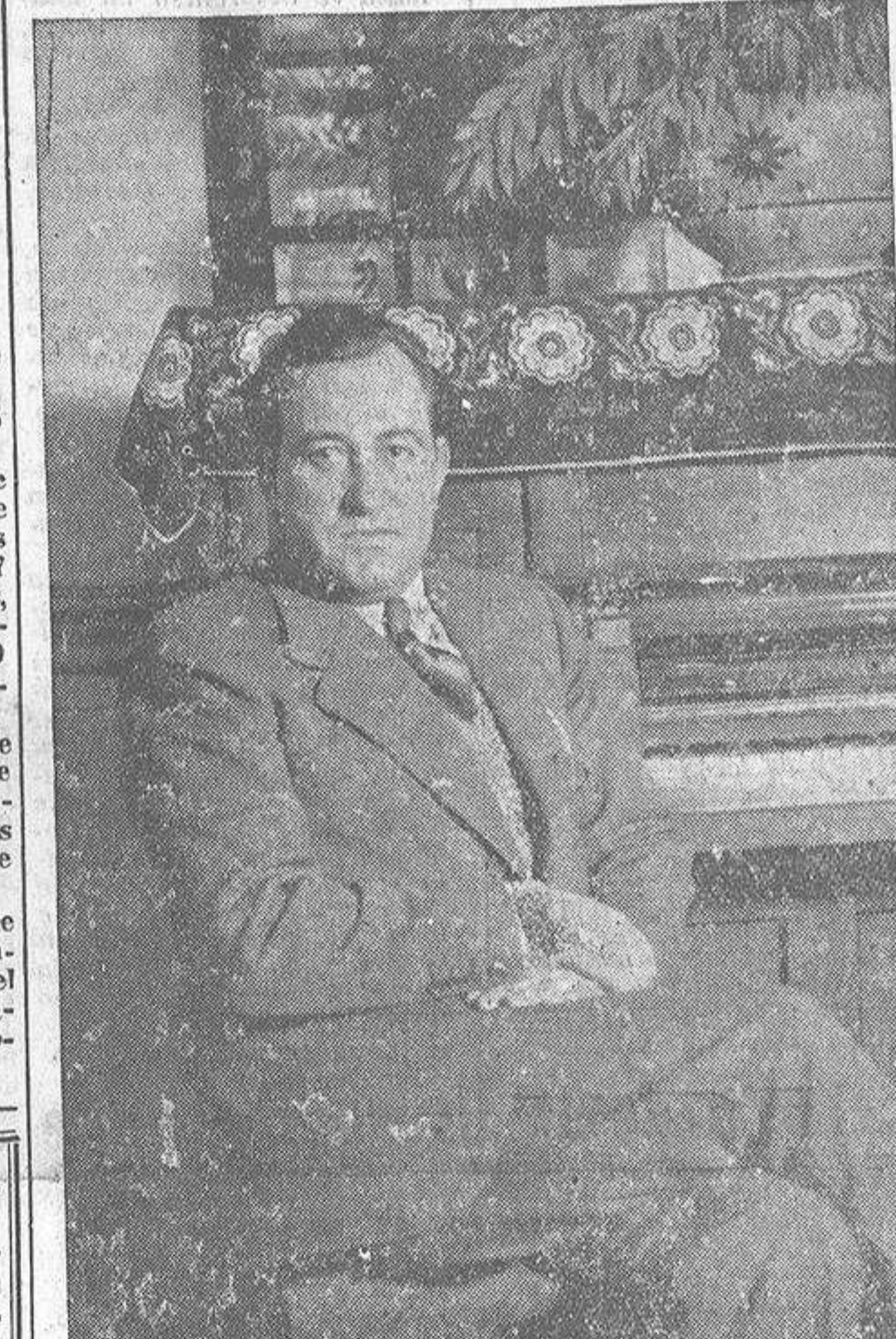
Una gran pérdida para el Arte