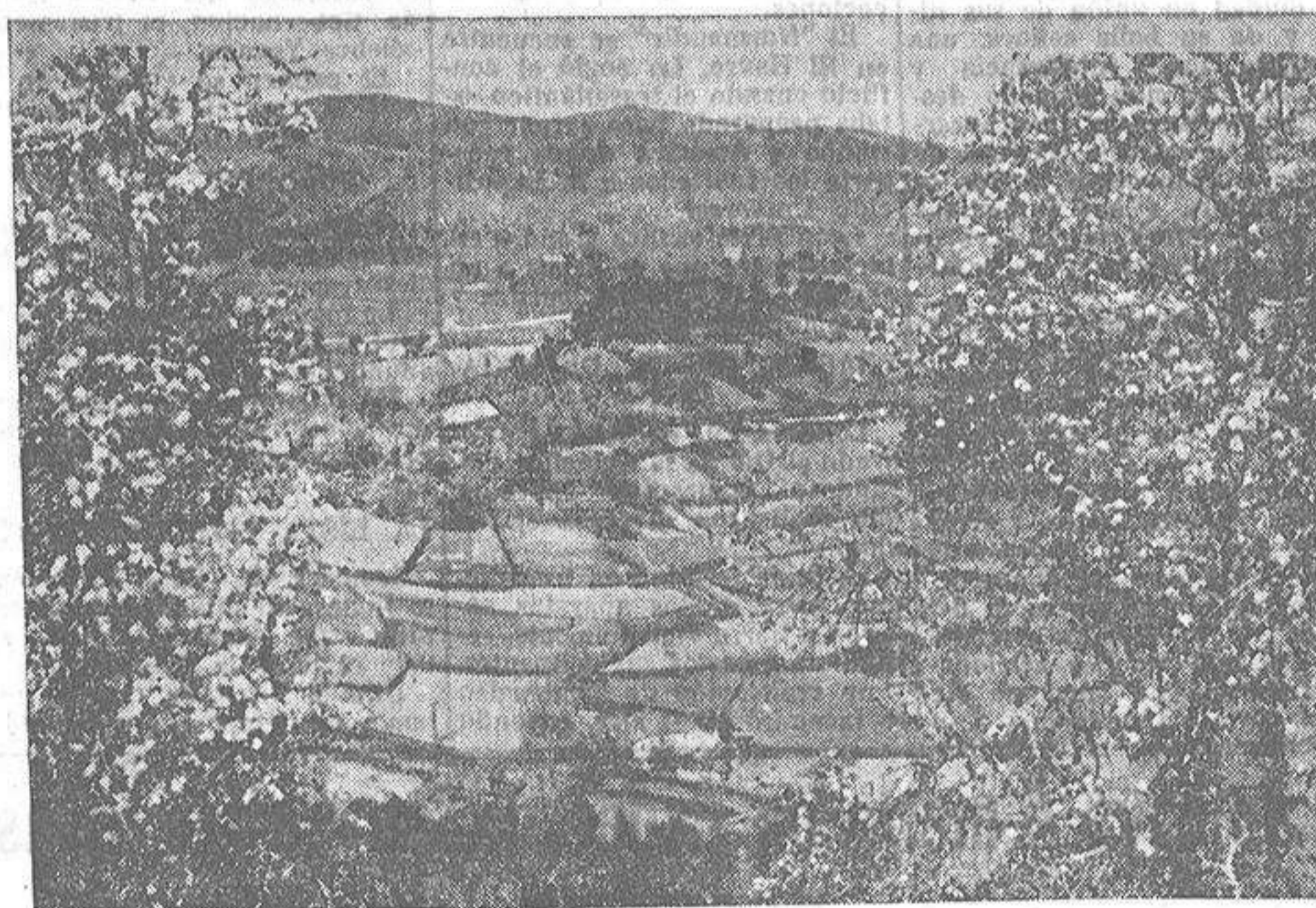
Entre dos árboles en flor se ofrece a la perspectiva del lector un bellísimo paisaje, uno de nuestros insuperables valles en los que muestra la división de la propiedad perfectamente delineada

—¿Pero a Galicia le corresponde un papel tan importan-