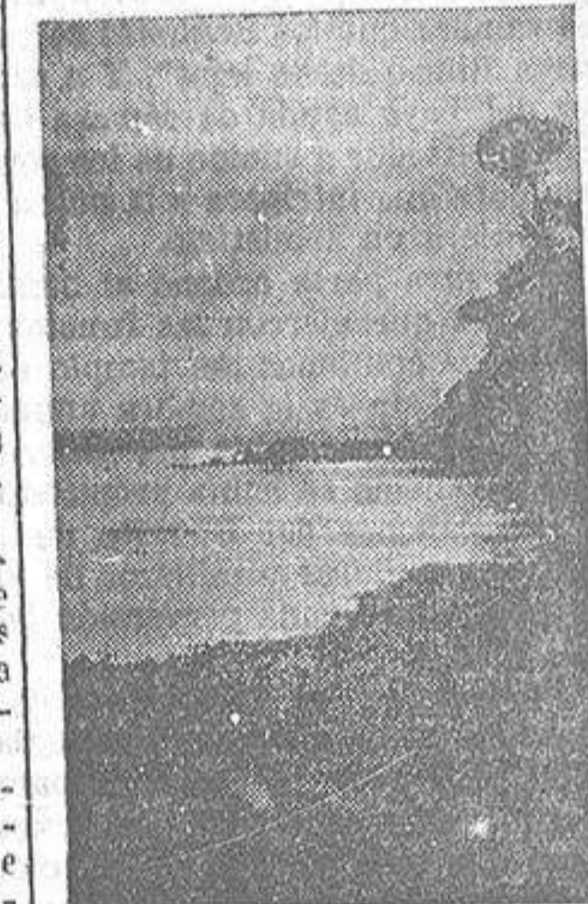
Destacando sobre el acantilado de la costa se alza un airoso pino dueño y señor de nuestros bosques y futuro protector de las instituciones de previsión a través de cotos sociales forestales que se implantarán en nuestra región