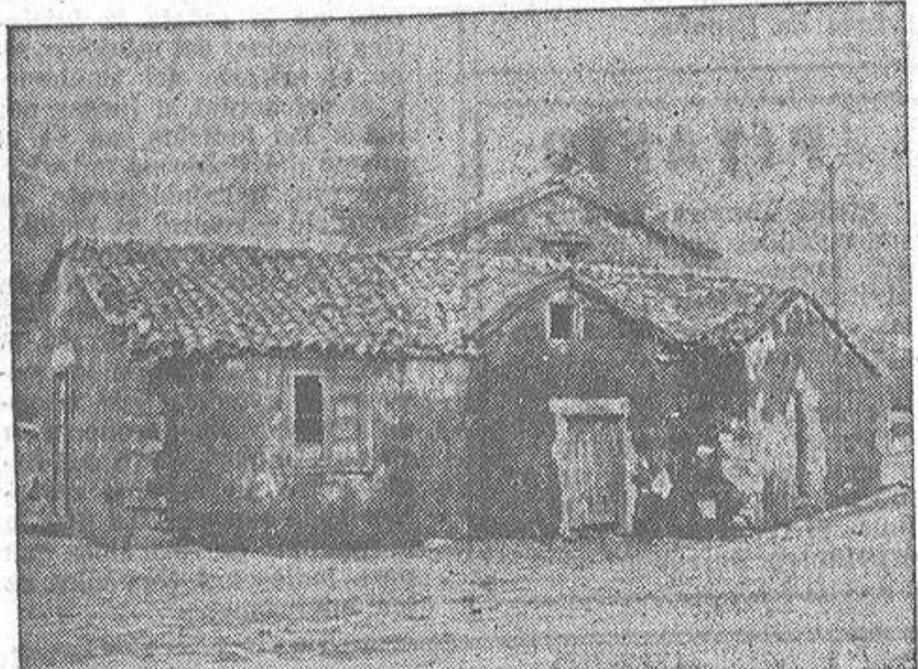
Esa casucha, de aspecto miserable, sin cales, rota, denegrida, no es albergue de irracionales, sino vivienda campesina, de nuestros modestos y sufridos labradores dignos de mejor suerte y que en la nueva España gozarán de un vivir más confortable con el apoyo de las corporaciones agrarias y del Estado

Su tenacidad, constancia y audacia no conocieron límites. Su actividad no sólo se extendió a las aplicaciones de este mineral (investigar y buscar su fuerza motriz), sino que extendió su actividad a otros ramos, absorbiendo numerosas minas de carbón y hierro y creando numerosas industrias. De esta manera se explica cómo llegara a reunir la fabulosa fortuna que se calcula en 2.000.000.000 de dólares (cerca de 14.000.000 millones de pesetas). Las donaciones que ha hecho para fundaciones y establecimientos de enseñanza son tan numerosos que se cree que su valor pasa de los 500.000.000. Sus creaciones más importantes son: la Fundación de Rockefeller, el Negociado de Educación General y el Instituto General para investigaciones médicas. Uno de sus donativos aislados fué de 10.000.000 dólares para la Universidad de Chicago. Otro de sus donativos de 400.000 dólares en 1925 para la construcción en Madrid de un Instituto de Física y Química.