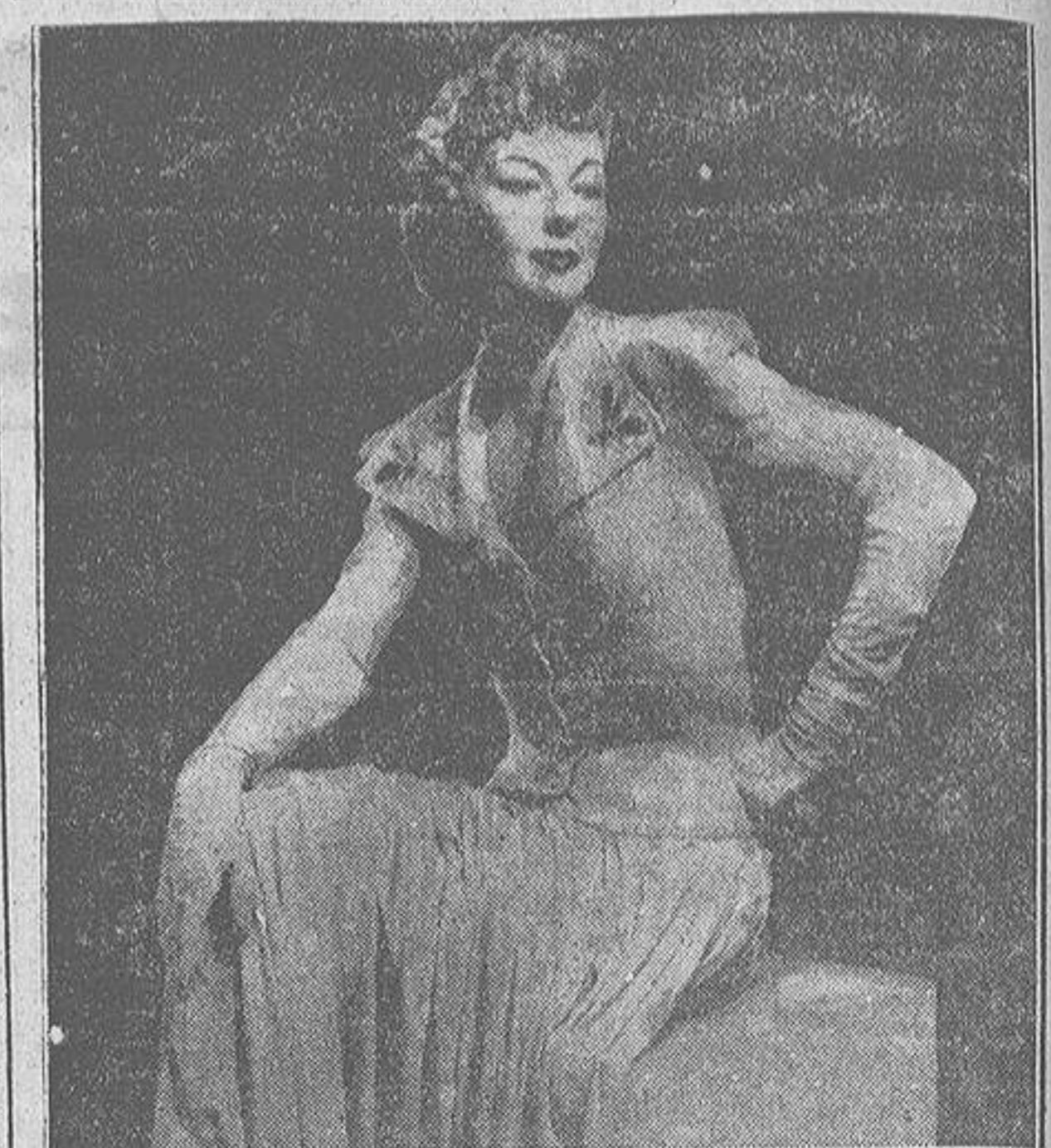
Las chaquetas tejidas a mano, acompañando los conjuntos de noche se presentan como la última novedad en los centros elegantes.