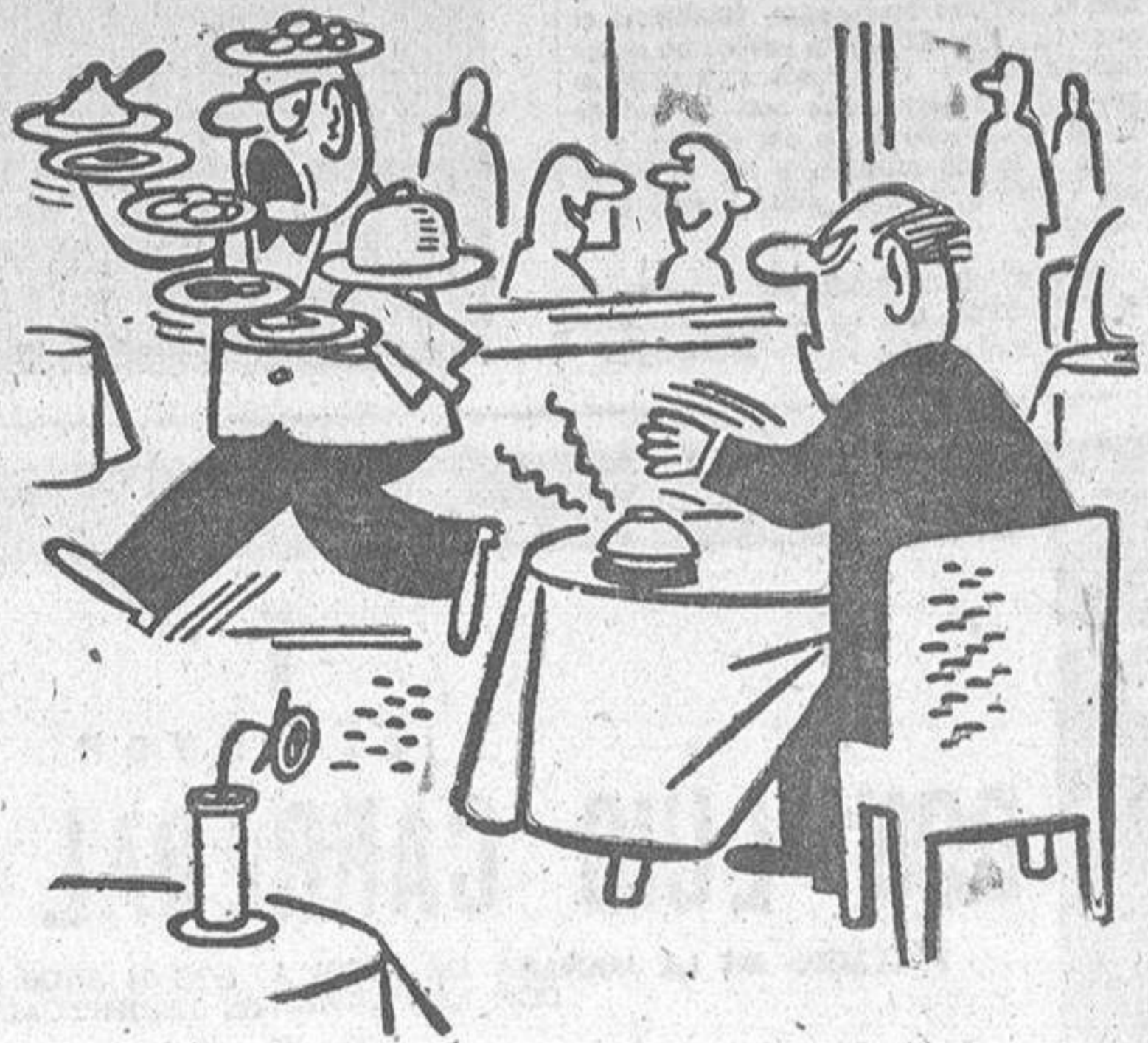
--Un momento, por favor... Me encuentro ocupadísimo.