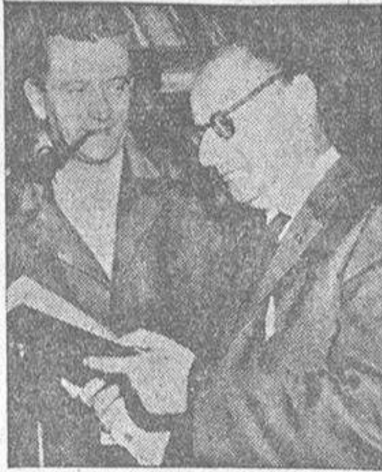
LOUIS PAUWELS Y JACQUES BERGIER

LOS libros de “ciencia-ficción” cuentan con gran número de adeptos en nuestra época. Puestos de moda en las postrimerías del siglo diecinueve por Julio Verne, habrían de tener destacados continuadores años después. Frente al espíritu racional, un poco imbuido por el positivismo comtiano que alentaba en el famoso novelista francés, los posteriores cultivadores del tema buscan otros mundos más sorprendentes, en los que lo real y lo fantástico lleguen a una conjunción. Los relatos de Herbert George Wells o de Aldous Huxley han merecido los honores de las múltiples ediciones a los idiomas más diversos. Pero acaso nada ha logrado mayor difusión en torno al particular, y en tan poco tiempo, como “El retorno de los brujos”, obra en colaboración de los escritores franceses Louis Pauwels y Jacques Bergier, que ahora llega hasta nosotros.