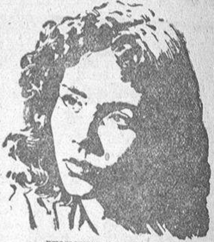
JENNIFERS JONES, protagonista femenino de “La colina del adiós”.

RESULTARIA difícil destacar, sobre los demás, uno de los estrenos citados, ya que por lo menos tres de estas nuevas películas mantienen a lo largo de su realización un nivel decoroso. Quedan, por lo tanto, excluidas las muestras cortas de Popeye y esa “Mademoiselle Angel” que aburre de puro candorosa. Pero si hubiera que hacer una excepción, no cabe duda que “La colina del adiós” ofrece un conjunto de valores mayormente apreciables, más que nada por la excelente interpretación de Jennifer Jones y William Holden y la delicada dirección del veterano Henry King, que ha sabido matizar adecuadamente cada momento importante de una emotiva historia de amor. Quizá haya alguna reiteración evitable en el relato, pero produce una sensación deliciosa esa fuerza apasionada que conmueve los sentimientos de la pareja protagonista, saltando por encima de convenciones sociales y obstáculos legales, para vivir la realidad hasta que a muerte rompe el gran idilio. No hay casi acción en este tema, saca-