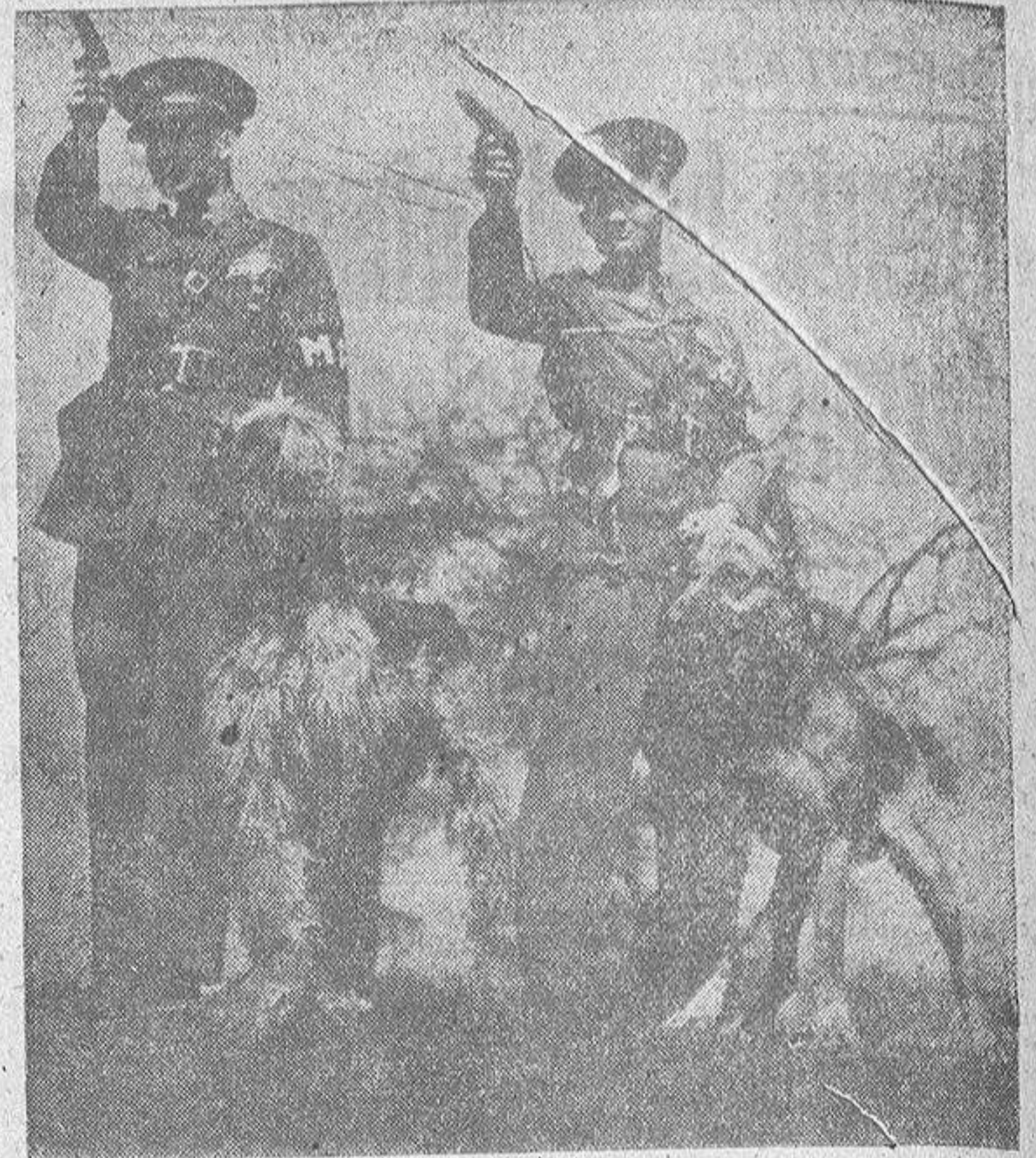
Un perro afgano (a la izquierda) y un perro de pastor alemán, mientras se les entrena para que estén tranquilos a pesar de los disparos de pistola, en una peñera de la costa Este de los Estados Unidos, donde se someten a instrucción a diversas razas de perros, antes de destinarlos a unidades en campaña.