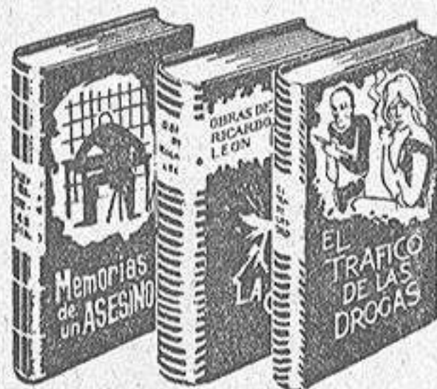
(Tres de los 11 volúmenes)