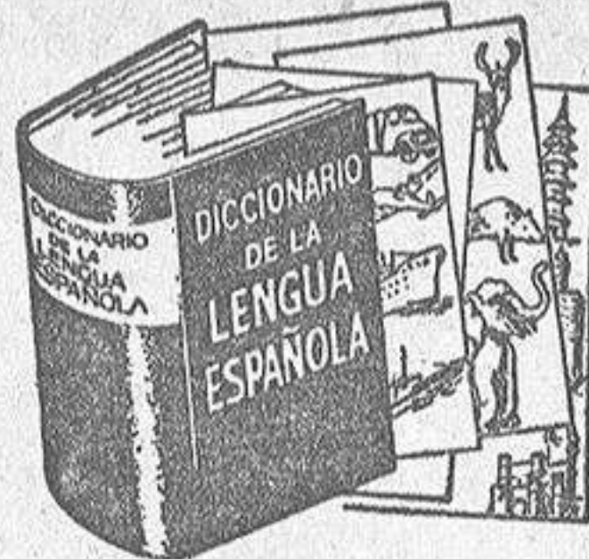
(Encuadrado en tela y oro)

RESPUESTA: Hasta ahora se vino proclamando por los Tribunales que si el inquilino, representante o delegado de una Compañía de Seguros, en casos como el suyo no se daba la figura del subarriendo. Pero la Sentencia del Tribunal Supremo de 11 de Abril de 1962 sostuvo que como el piso arrendado lo era a una persona natural y estaba ocupado por las oficinas de la Delegación o representación de una persona jurídica, había que concluir que un extraño a la relación arrendaticia usaba y disfrutaba de la cosa arrendada, cuya introducción sin conocimiento del arrendador era causa de resolución del contrato. De todos modos, creo que en su caso no podría llegarse a la misma conclusión.